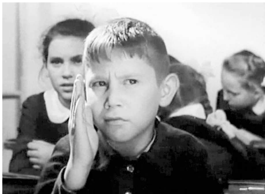
Кадр из фильма «Три с половиной дня из жизни Ивана Семенова, второклассника и второгодника»

Из-за того, что нам, педагогам, чаще всего не дают оставлять детей на повторное обучение, многие ребята лишены этой реальной помощи. Подобная редко применяемая практика обрастает непониманием окружающих. Не давая согласия на повторное обучение, родители подвергают детей огромной нагрузке, те вынуждены наверстать пропущенный материал, еще больше отстают от нового, и в итоге выдыхаются.