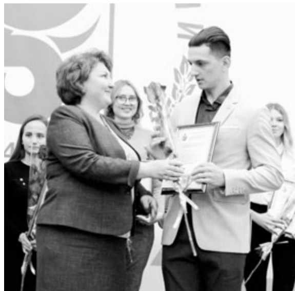
Вручение профсоюзных стипендий

Самой активной дискуссионной площадкой стал круглый стол на тему «Профсоюз - это плюс?», который провел заместитель