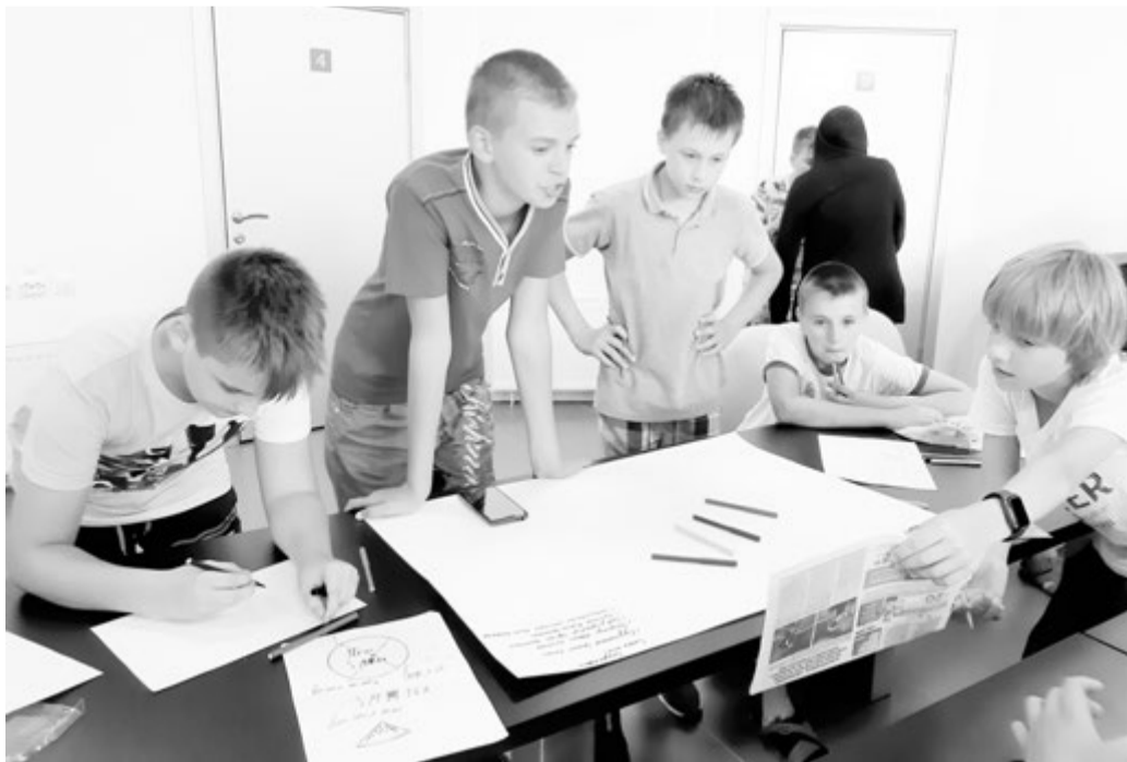
Ребята создают стенгазеты

Мы же прекрасно понимаем, что 90-е, нулевые годы нивелировали, дискредитировали учительскую профессию. И сейчас к нам приезжают дети, которых воспитывают родители, выросшие на негативных тенден-