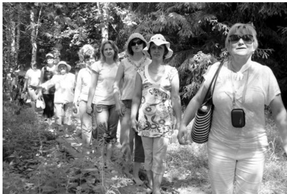
Поездка на озеро Светлояр. Идем вокруг озера, загадываем желания

А теперь представьте конкурс стихотворений в роще Лучинник, когда каждый, независимо от своей специальности, прочитал любимые пушкинские строки. Сколько «чудных открытий» было! А как увлеченно мы расписывали доски, выводя цветы городицкой росписи, лепили глиняные свистульки, создавая шедевры народных промыслов. Все это на обычной, стандартной