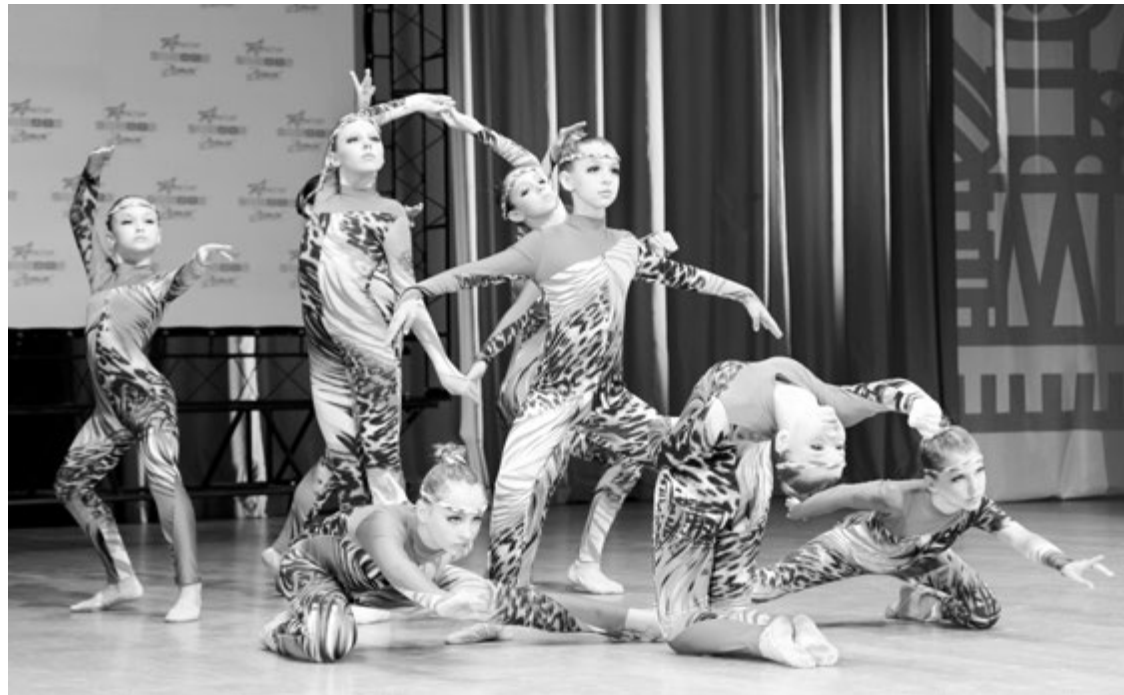
Танцевальный ансамбль «Искорки»