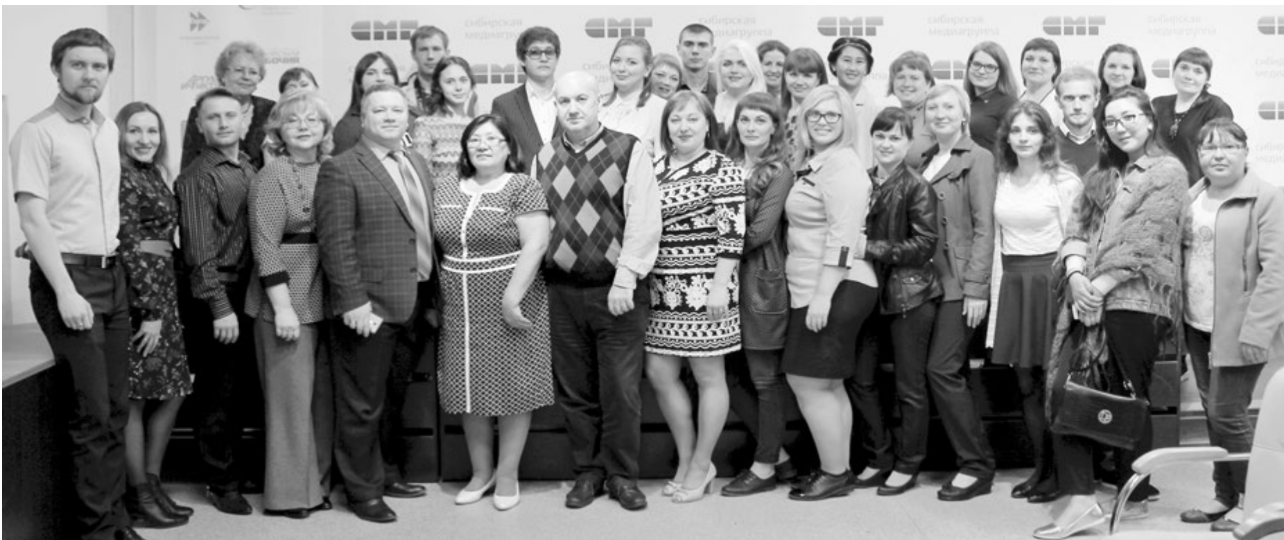
В гостях у медиахолдинга