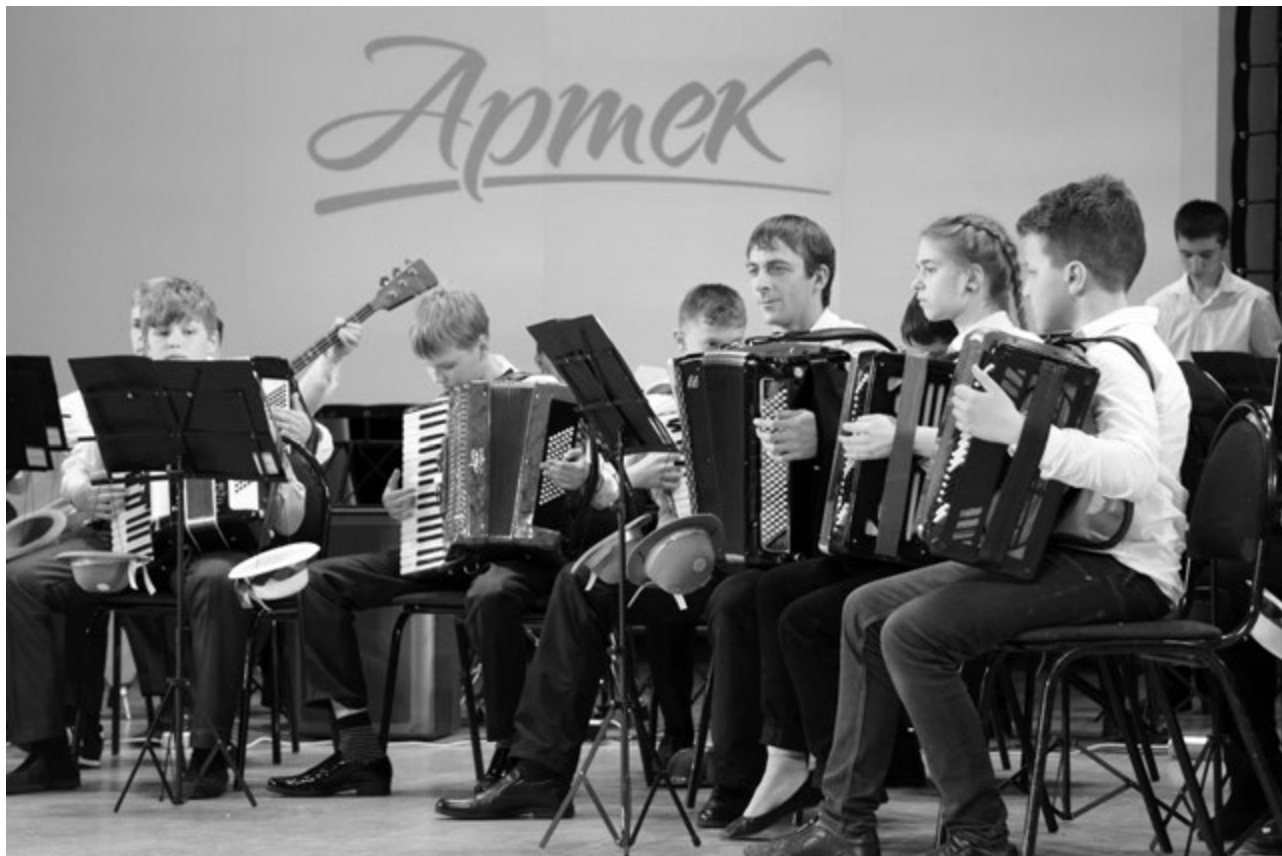
Оркестр баянистов и аккордеонистов

поделилась своим мнением об увиденном и услышанном.