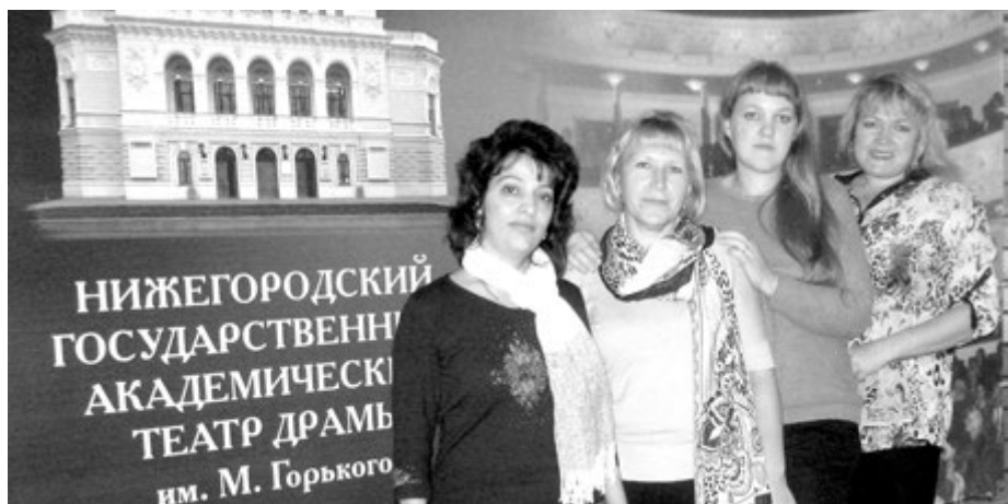
Наш коллектив в Нижегородском государственном академическом театре драмы имени М. Горького

Профсоюзная жизнь в нашем учреждении бьет ключом. Скучать нам не приходится. И каждый праздник не похож на другой.