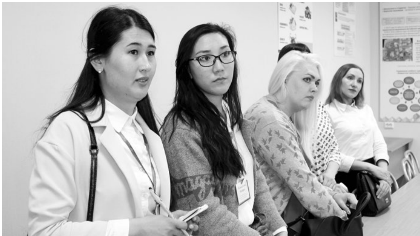
В стенах краевого института повышения квалификации работников образования

Молодые педагоги, присутствовавшие на тренинг-даче, не отсиживаются в профкомах, а принимают непосредственное участие в профсоюзной жизни образовательных организаций, активно отстаивают свою позицию. Поэтому необходимо не