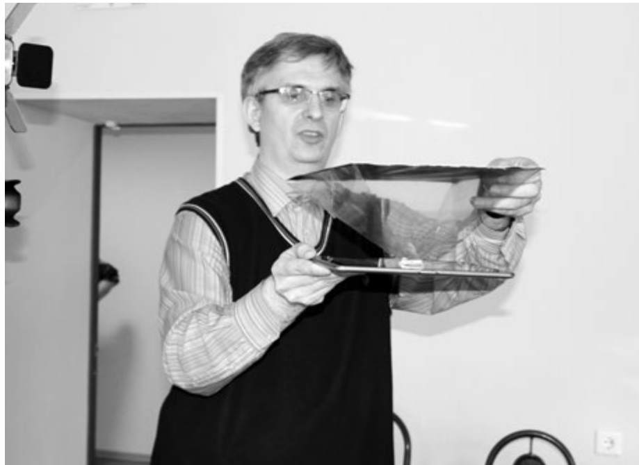
В лаборатории АК ИПКРО

Во время работы тренинг-дачи молодежному профактиву предоставили немало уникальных возможностей лично пообщаться с интересными людьми - профес-