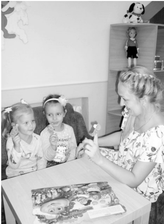
В пальчики играем, творчество развиваем

станция Куцевская, Куцевский район, Краснодарский край