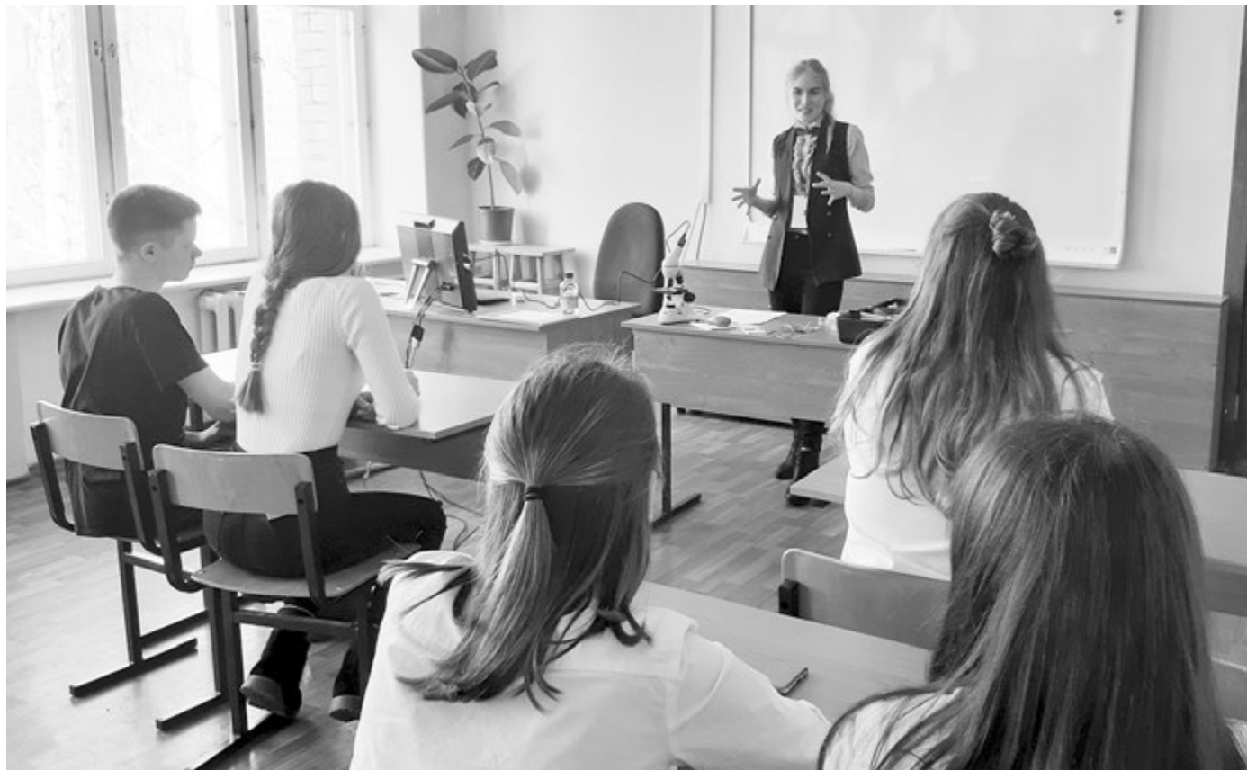
Урок для школьников проводит школьница