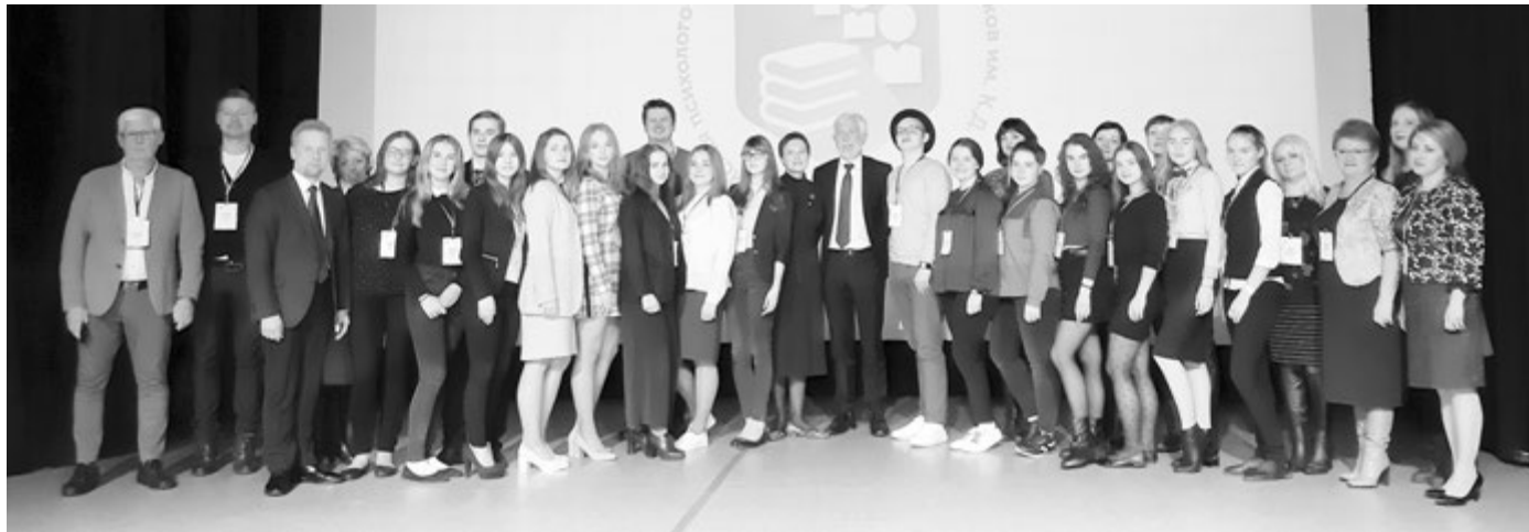
Участники и организаторы олимпиады

На церемонии закрытия, которая прошла в старинном здании Ярославского государственного педагогического университета им. К.Д.Ушинского, новых заданий не было.