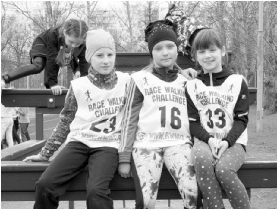
В этот раз в соревнованиях участвует много девочек