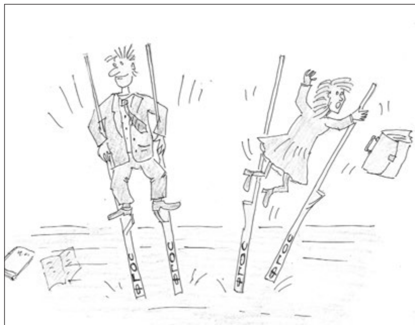
ФГОС шагает по стране