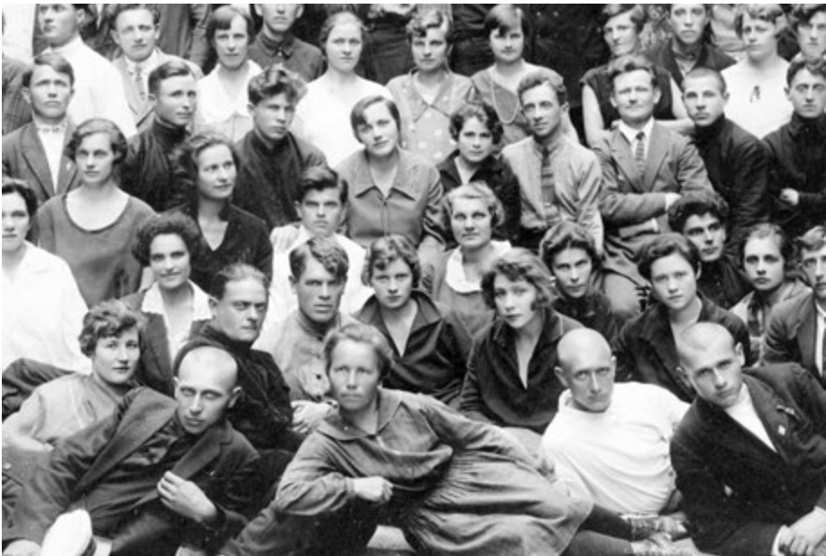
На курсах Союза РАБПРОС в Челябинске, 1930-е годы

В 1918 году Педагогическое общество было преобразовано в Союз учителей, который вошел в Совет профессиональных союзов Челябинского уезда. С 1922 по 1934 год в Челябинской губернии действует Профсоюз работников просвещения РСФСР (РАБПРОС). А в 1934 году, когда была образована Челябинская область, создан обком Профсоюза работников просвещения.