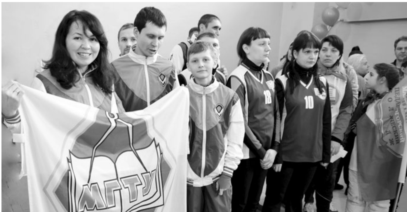
Круглой дате посвятили фестиваль «Сто спортивных достижений»