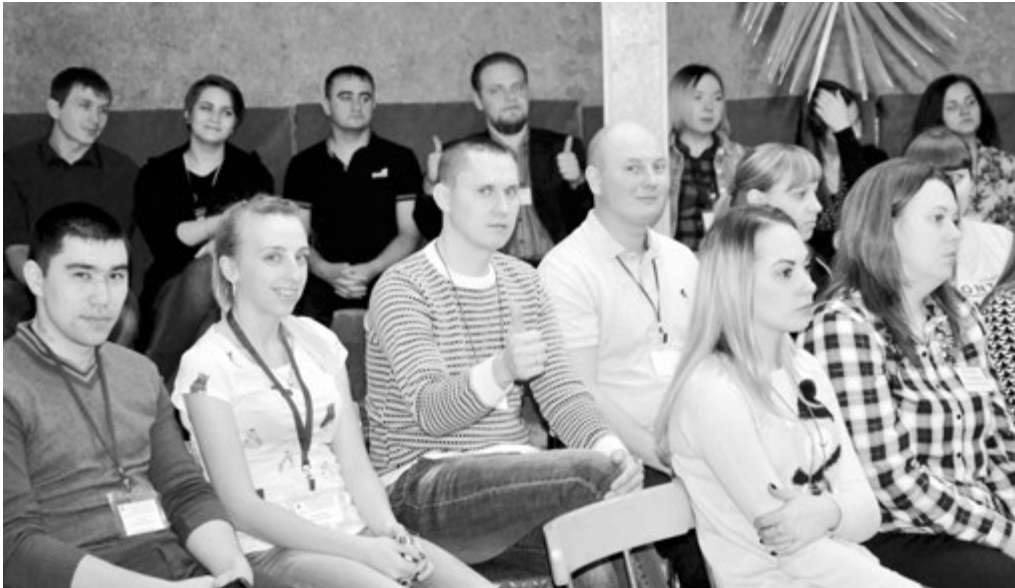
Встречи в зимнем саду

- Бывают мысли уйти из профессии, но встреча с людьми, которые любят свою работу, мотивирует идти дальше, преодолевать трудности и покорять новые вершины. Спасибо профсоюзу за общение с интересными людьми. Такие мероприятия заряжают молодых специалистов положительными эмоциями, сохраняют их на рабочих местах.