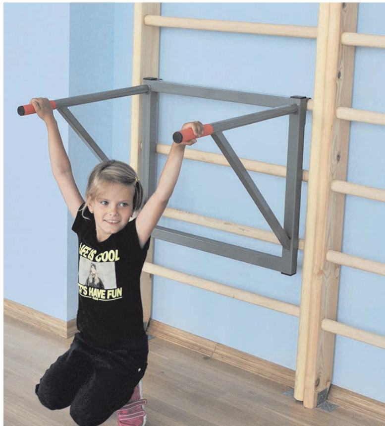
К новым спортивным результатам готовы

- Все это мы бережем, - отмечает руководитель музея, учитель техно-