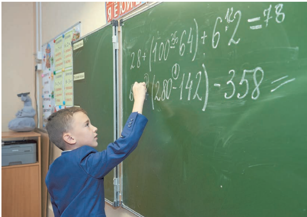
Математика - это увлекательно!

Отмечу, что мы часто обсуждаем вызовы цифровизации, нацелены на создание цифровой образовательной среды, активное использование