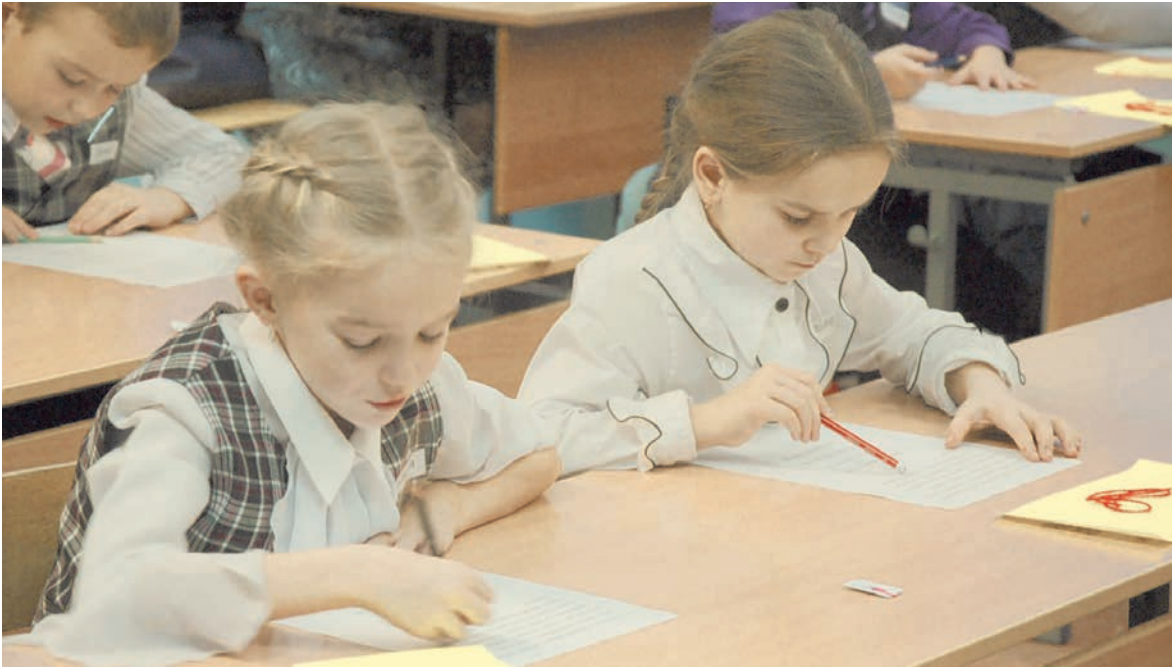
Учеба - дело серьезное и радостное

Пользуясь случаем, хочу от всей души поздравить всех педагогов, родителей и ребят с Днем знаний! Пожелать всем крепкого здоровья! Поздравить с тем, что пусть пока еще очень осторожно, но мы возвращаемся к традиционному формату обучения. Уверена, что вместе, единой командой мы преодолеем все трудности!