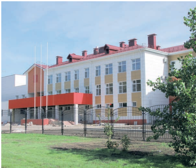
Грибановский центр образования имени Г.Н.Тропольского