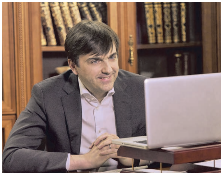
Работа министра в режиме онлайн

- В стенах Министерства просвещения создан департамент цифровой трансформации и больших данных. Среди его основных задач «обеспечение технологической не-