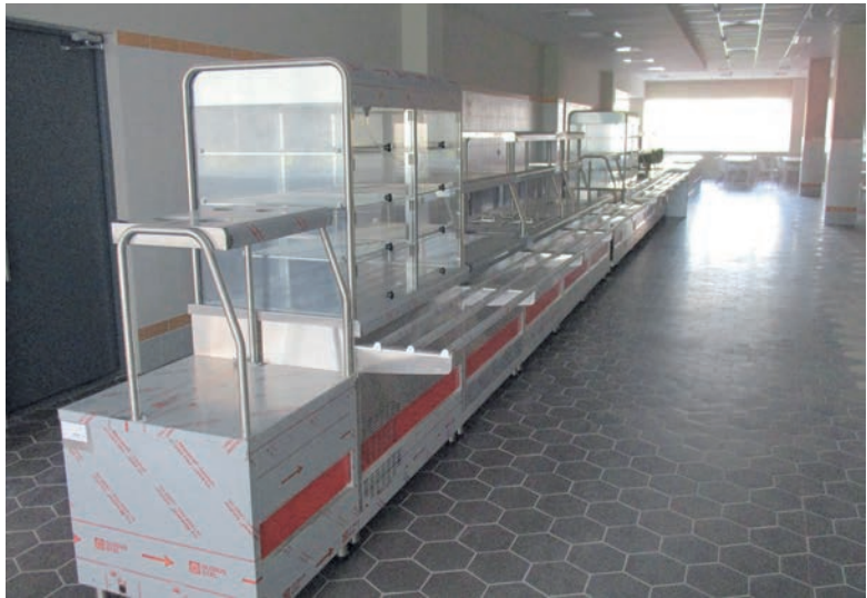
Здесь вкусно покормят