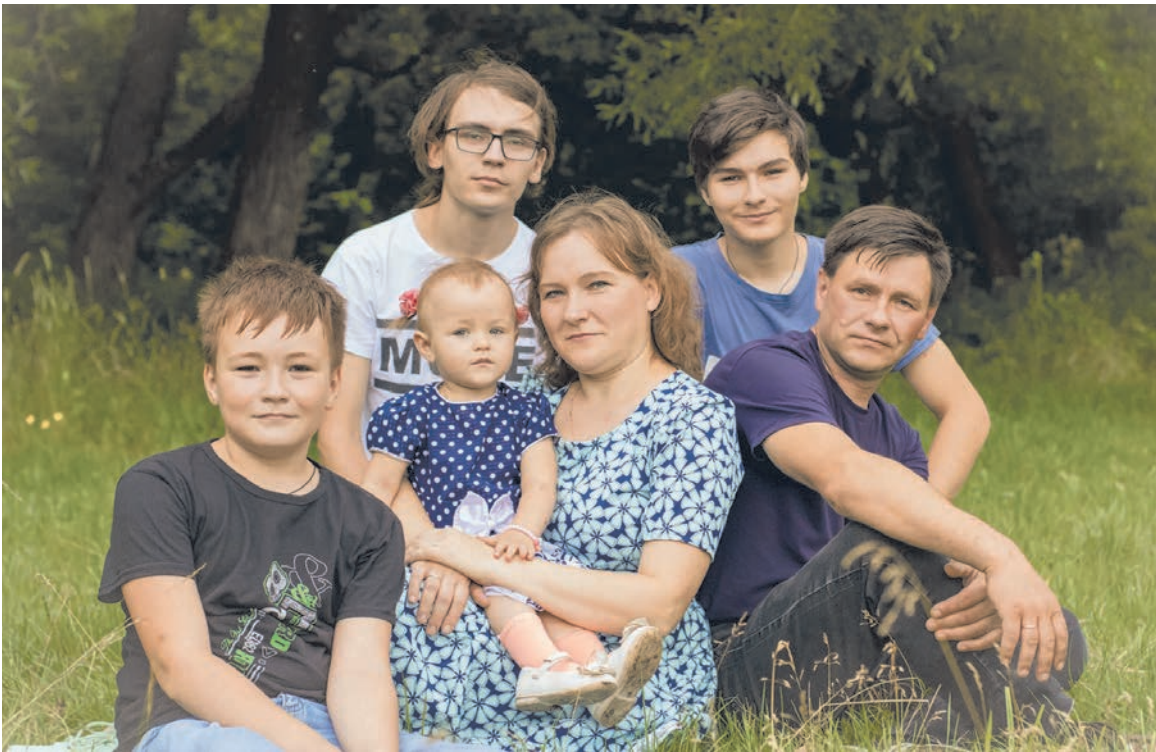
Побольше бы таких дружных, счастливых семей!

Дети у них с Татьяной музыкальные. Любовь к музыке передалась от