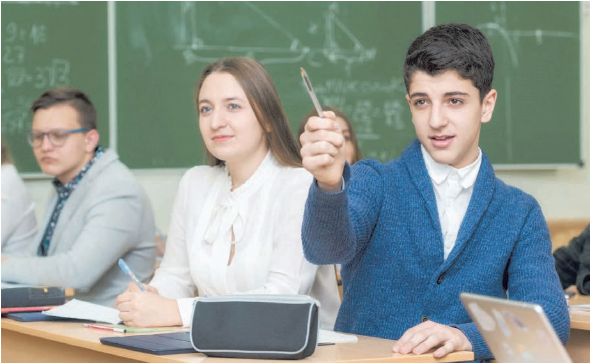
Обсуждаем проблемы, учимся отстаивать свое мнение

На мой взгляд, мы умеем выявлять талантливую молодежь, но наша проблема и недочет в том, что не выработан системный алгоритм их сопровождения. Мне нравится опыт многих субъектов, когда министры, чиновники всех уровней и руководители предприятий закреплены за победителями олимпиад, успешными, талантливыми детьми. То есть мало выявить талант, выставить оценку, важно помочь в реализации проекта и в дальнейшем его сопровождении. Тогда и ребята реже будут уезжать из своих регионов, будучи полезными и востребованными на местах.