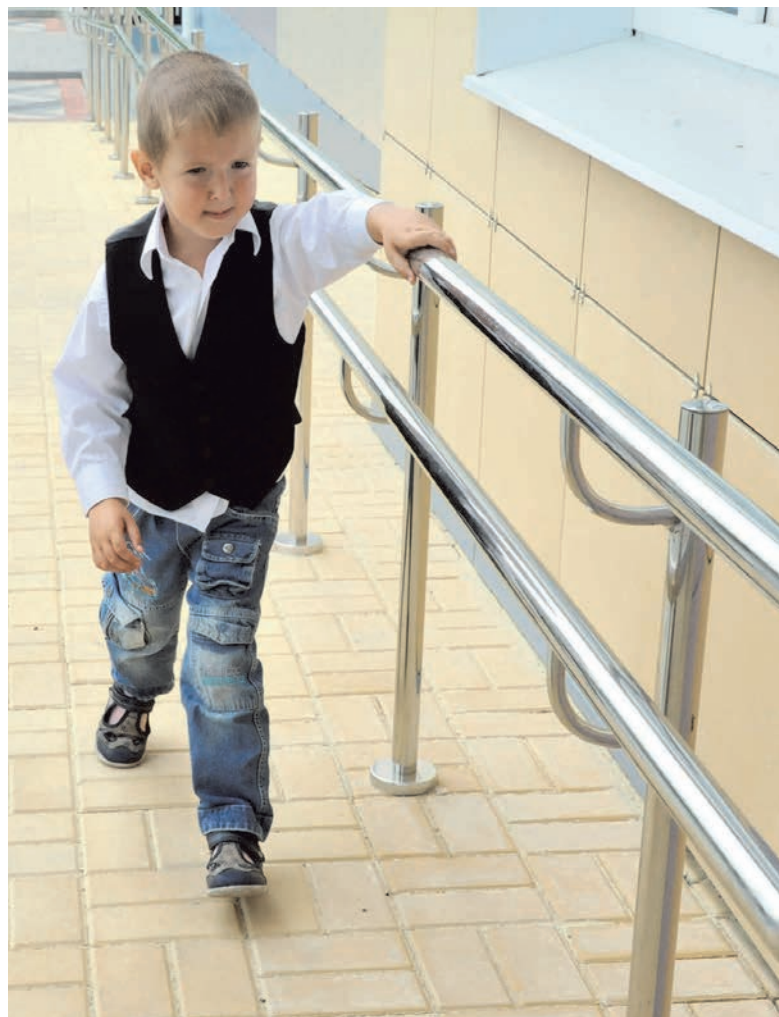
Пандусы, лифты для малоподвижных - все удобно и доступно

это весьма важный навык, и наблюдать, как себя ведет флюгер. Оборудование особенное, редкое, интереснейшее - это невероятный подарок для нас, мы уже пребываем в предвкушении тех проектов, которые с такими приборами нам захочется сделать.