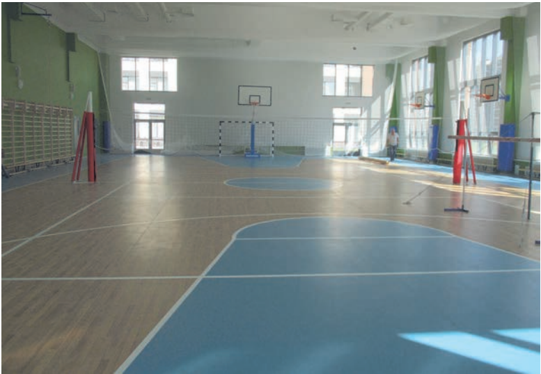
Подружат всех со спортом