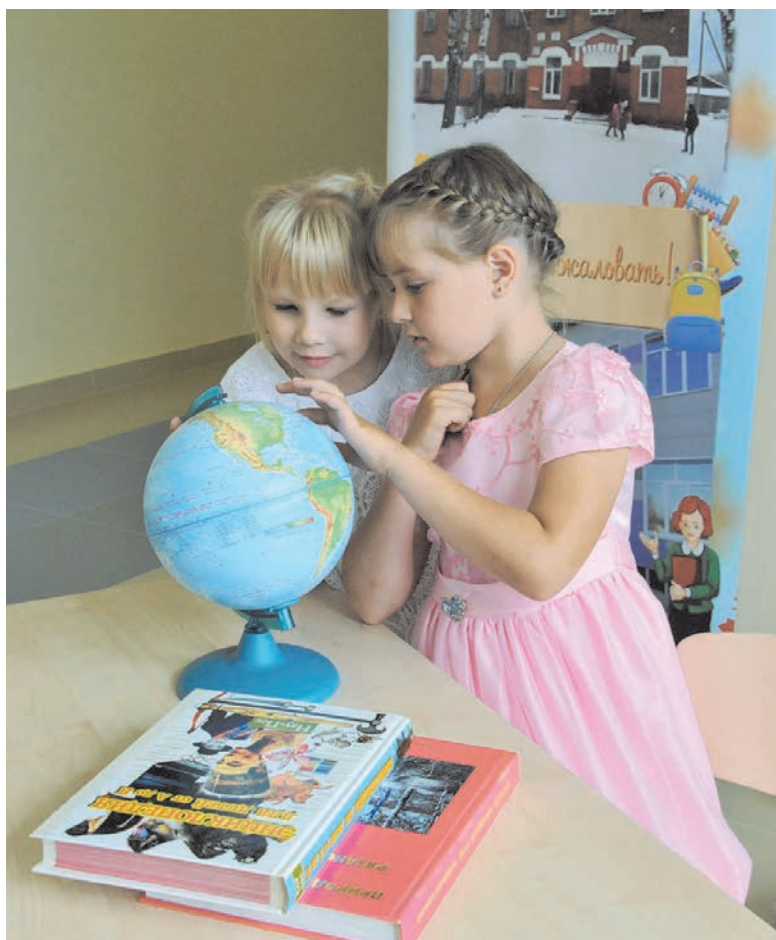
Впереди у них открытия!

В этой школе появилось желание дышать полной грудью. Потому что возможности сегодняшнего дня кажутся вполне близкими и доступными, потому что кроме стен, приятно