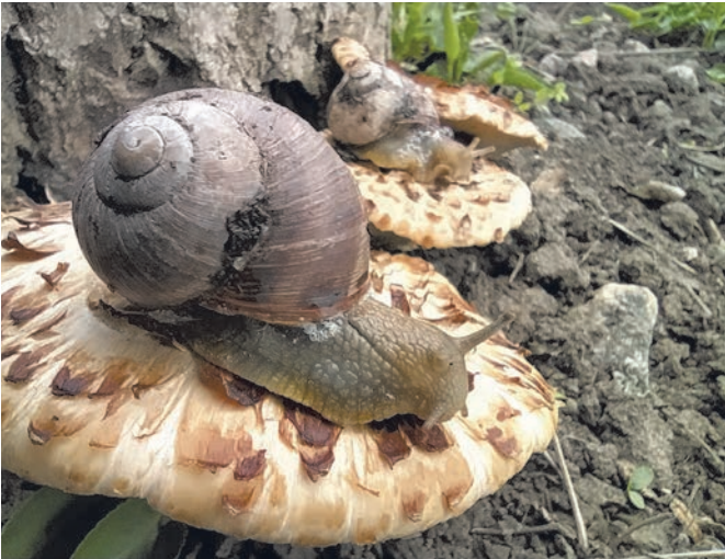
В родных краях можно встретить диво дивное...

вновь оживает, приобретая прежнюю «икряную» привлекательность (это, правда, смотря на чей вкус). Вся поляна, покрытая свежей зеленью и яркими желтыми букетиками чистяка, была утыкана воскового цвета грибными столбиками. Большинство из них были прикрыты сверху маленькими морщинистыми охристыми шляпками с кокетливо загнутыми полями. На некоторых грибах, правда, колокольчатый головной убор отсутствовал - он или съехал вниз по ножке, или валялся рядом в траве. От