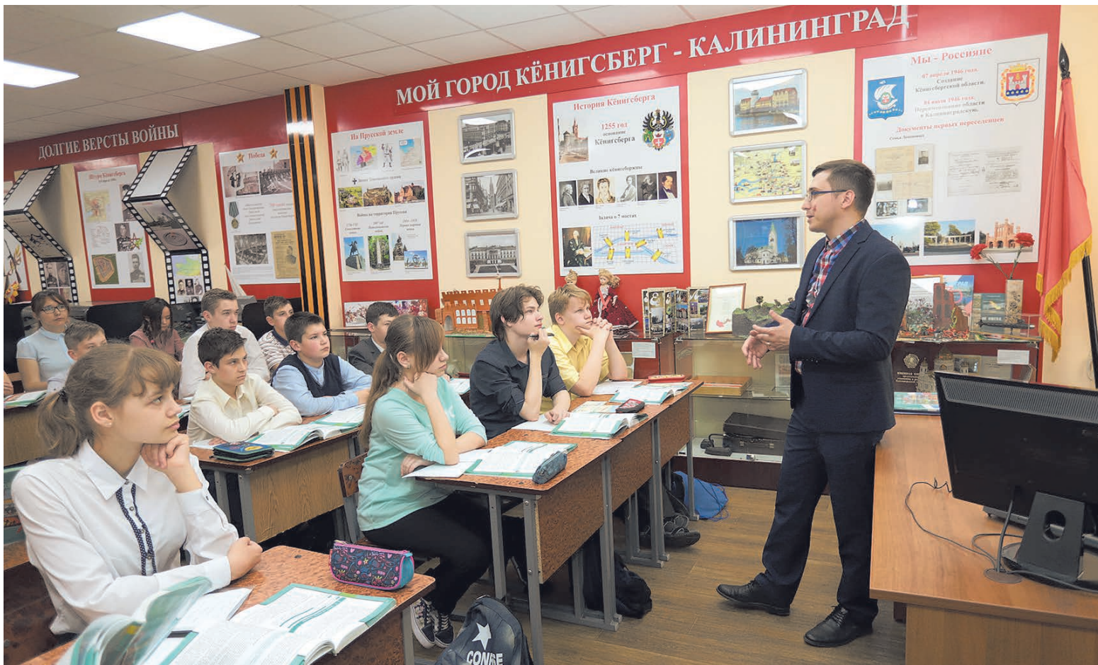
Важно научить детей оценивать исторические события объективно

Кроме всего прочего, на конкурсе я понял, как же огромна наша страна и как много в ней интересного! Я принял решение продолжить карьеру в Москве, и меня тепло приняли в школе №1357 «На Братиславской», где я и продолжаю творить, учить и развиваться как учитель.