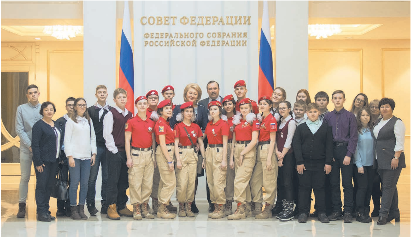
Представители регионов - желанные гости

На родительском собрании я провела опрос. И простые вопросы («Сколько вы общаетесь с ребенком?», «Как часто его хвалите?», «Есть ли у вас общие увлечения и дела?») многих родителей заставляли