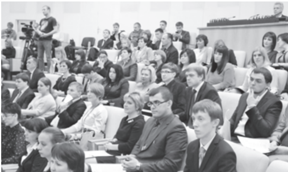
Конкурсанты-2015 болеют за своих лидеров