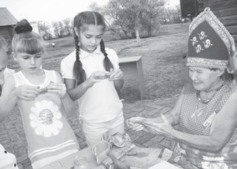
Лепим свистульки из глины

Меня, педагога с большим стажем работы, очень обеспокоили данные социологических опросов. Больше 50 процентов столичных