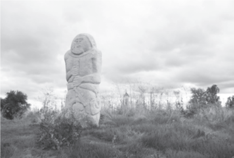
Кто оставил эти следы? Некоторые изваяния удивительным образом напоминают космонавта...