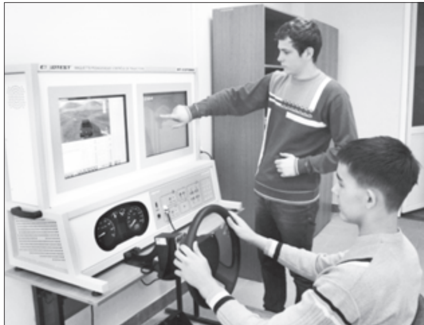
Занятия на тренажере

правило, взрослые люди, которые желают повысить квалификацию или приобрести новую профессию. Мы обучаем их по 45 профессиям автомобильного профиля. В ближайшее время планируются к открытию многопрофильный Центр прикладных квалификаций и Центр серти-