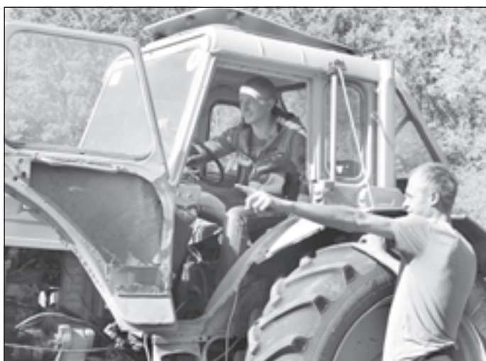
Осенняя посевная в разгаре

обеспечивают учащихся практикой, а впоследствии и трудоустройством. Помимо шести основных специальностей - «технология мяса и мясных продуктов», «механизация сельского хозяйства», «экономика и бухгалтерский учет», «электрификация и автоматизация сельского хозяйства», «техническое обслуживание и ремонт автомобильного транспорта», «техническая эксплуатация и обслуживание электрического и электромеханического оборудования» - тут дают