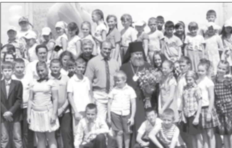
Православная смена «Преображение»