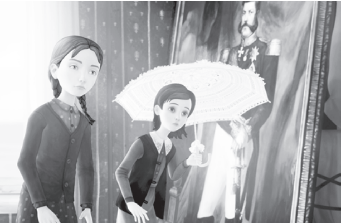
Серафима и ее подруга Рита вскоре раскроют тайну прошлого. Кадр из мультфильма

И все же исключения есть, говорит автор, взять хотя бы другую героиню, простую офисную курьершу Надю. Она «не знала никаких эзотерических секретов. Просто в ней сохранилось какое-то изначальное и забытое людьми спокойствие, веселая и бесстрашная тишина. В ее уме практически отсутствовали программы и инсталляции окружающего мира, из которых на сто процентов состояли души ее коллег по офису. Именно поэтому она не бралась за работу сложнее экспедиторской - все остальное требует эмоционального подключения к матрице». Удивительно ли, что именно Надежда становится в своем будущем Ангелом, творящим и оберегающим целые миры. В одном из которых, по ее милосердию, окажутся практически все персонажи книги, включая Кешу, правда, в обликах, отразивших самое трогательное в них - надежду на исправление и настоящую, всепрощающую любовь. И почему-то думается, что это не просто очередная насмешка писателя, а и его пусть призрачная и слабая, но надежда, что будущее действительно можно изменить.