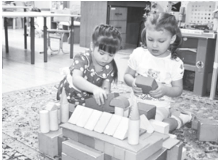
Главное занятие - игра

У заведующей столько хлопот, что некогда северным сиянием полюбоваться. Своих детей двое - сын-старшеклассник и дочка во втором, да еще музыкальная школа и хореография. И в садике всех детей она считает своими.