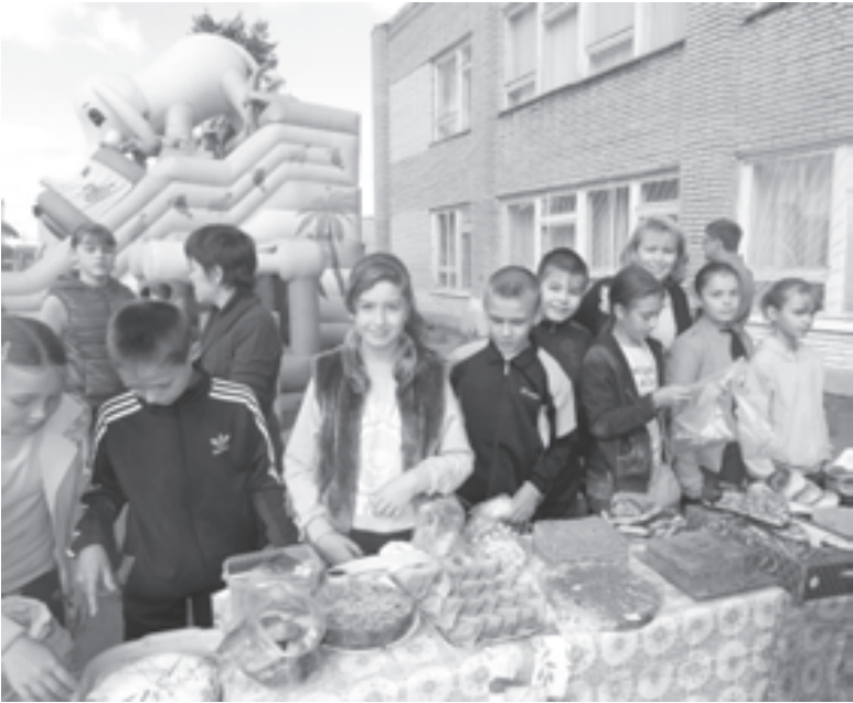
Подходите, гости дорогие, угощайтесь!