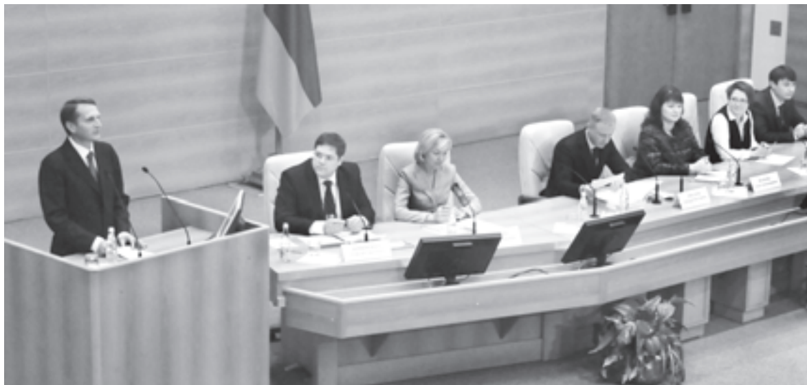
Председатель Госдумы Сергей НАРЫШКИН выступает за свободную дискуссию

Кстати, один из вопросов круглого стола касался именно рабочих программ: «Что проще - разработать