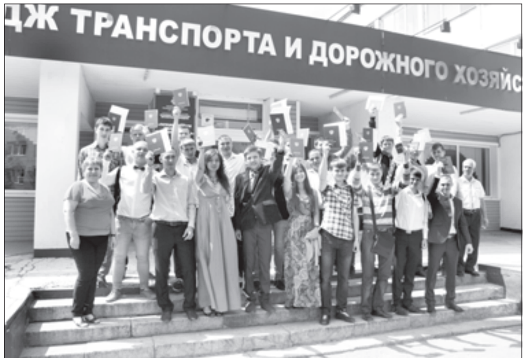
Выпускники Липецкого колледжа транспорта и дорожного хозяйства