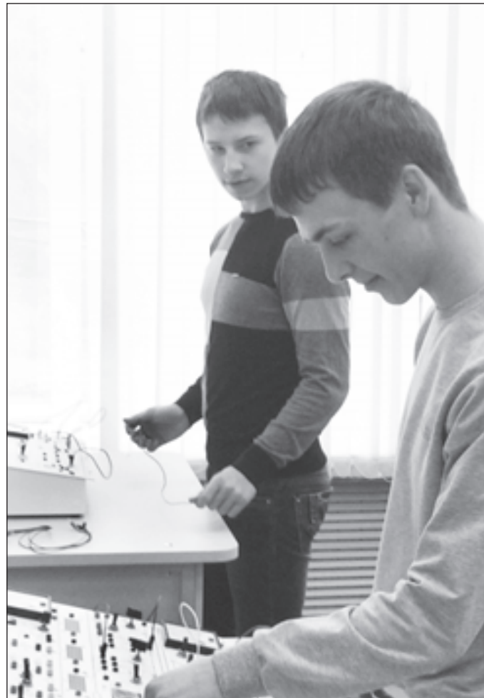
Без знаний по физике в сложных схемах не разобьются

Примечательно, что студенты техникума принимают активное участие в научных, творческих и профессиональных конкурсах разного уровня. Например, в региональном конкурсе «Молодежь и наука 2015», федеральном олимпиадном соревновании молодых