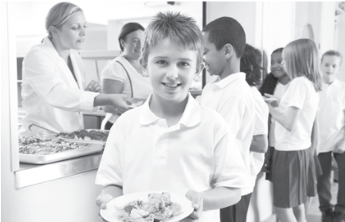
Если ребенок с первого класса ходит в столовую, у него вырабатывается привычка к здоровому питанию

Невольно задаешься вопросом: а почему такая схема организации школьного питания не работает, например, в соседнем Новодвинске, ведь не так уж и сложно было принять участие в конкурсе, профинансировать ремонты в столовых и внедрить новую систему? Несложно? Сложно, ведь до сих пор в большинстве школ региона столовые работают по-старому, а вот в Северодвинске слож-