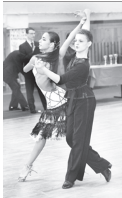
Воспитанники ансамбля «Фламенко» привлекли победителей

Центр развития творчества детей и юношества: вдохновение часов не наблюдает