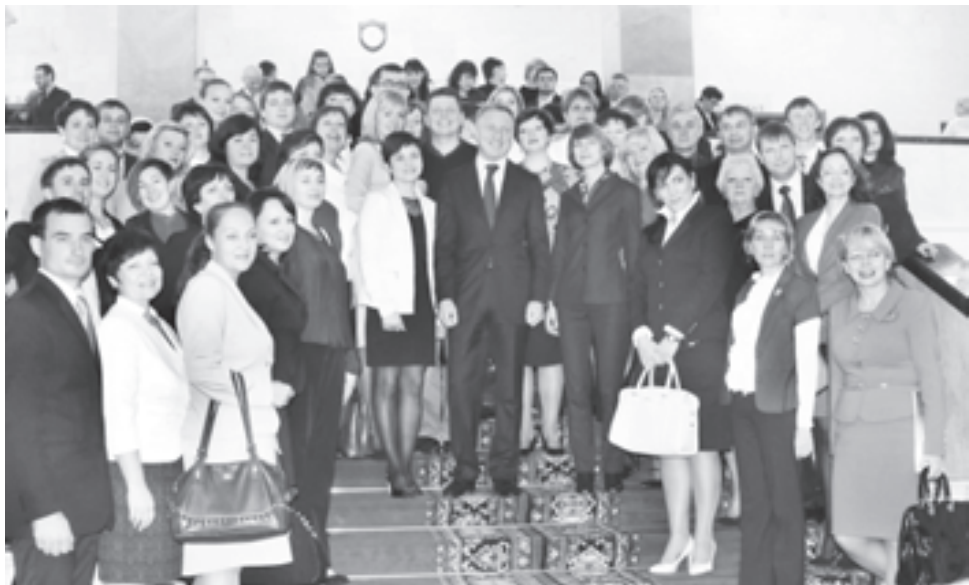
Министр образования и науки РФ Дмитрий ЛИВАНОВ в гуще событий