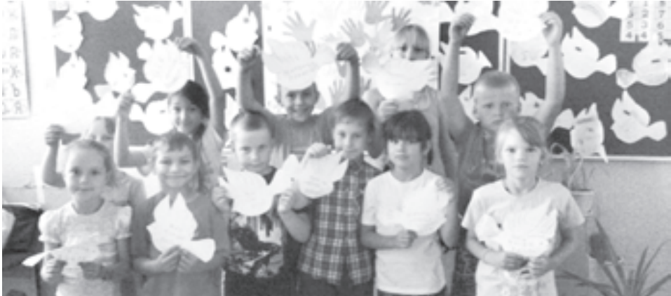
В дружбе - наша сила!

Мы хотим жить под мирным небом, поэтому участие в акциях - это маленькая толика того, что мы можем сделать, чтобы на планете царили мир и дружба. Дети 1-5-х классов с радостью откликнулись на призыв «Учительской газеты». Они изготовили 200 голубей, на которых написали пожелания о мире. Птиц мира разместили в окнах, фойе школы, на автобусных остановках. На школьной линейке ребята вместе с родителями выпустили в небо живых голубей и шары синего и белого цветов. Акция «Мирный пояс Победы» проходила с 8 по 11 июня. В ней приняли участие 50 школьников. Давайте дружить! В дружбе - наша сила!