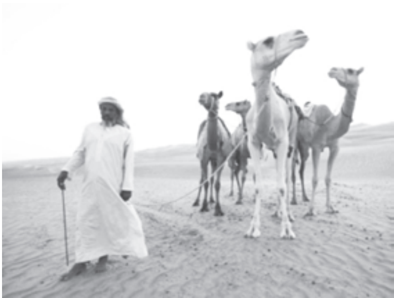
Бедуины научились считать не только верблюдов, но и деньги...

кивающими скудную растительность. Так и поступали обитавшие на пустынных ветреных нагорьях племена. Их и называли - «обитатели пустыни» (от арабского «бадия» - «пустыня»). Этим термином издревле обозначали всех жителей арабского мира, которые вели кочевой образ жизни, независимо от их национальности или религиозной принадлежности. Готовность в любой момент покинуть обжитое место (возможно, навсегда), мгновенно принять другую реальность и в ней себя утвердить - пожалуй, часто не только суровая жизненная необходимость, но и своеобразная философия бесконечно разнообразного в своих вариациях бытия. Для кочевника охота к перемене мест, походная обстановка не просто данность, с которой приходится мириться. Это зов судьбы, жиз-