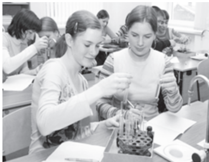
На уроке химии

Кировский район один из старейших районов донской столицы. Он был основан еще в 1936 году. Здесь расположены все главные административные органы управления Южного федерального округа, области и города, крупнейшие финансовые и торговые компании, а также культурные центры. Именно здесь основывался Ростов-на-Дону в 1749 году. Не случайно именно в этом районе находятся самые популярные и востребованные в городе образовательные учреждения.