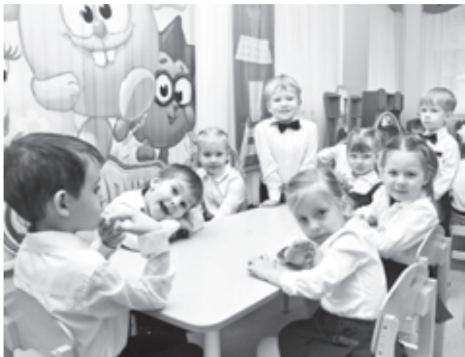
В детский сад - с радостью!