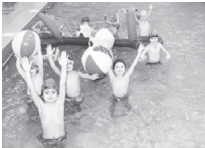
В районе реализуется губернаторская программа «Всеобуч по плаванию»

пользуются в качестве единого, универсального измерителя достижений обучающихся в учебном предмете, позволяющего сравнивать деятельность школ. Кроме того, удовлетворительный уровень сдачи ЕГЭ сегодня является тем уровнем знаний, которым должен обладать выпускник учреждений полного общего образования.