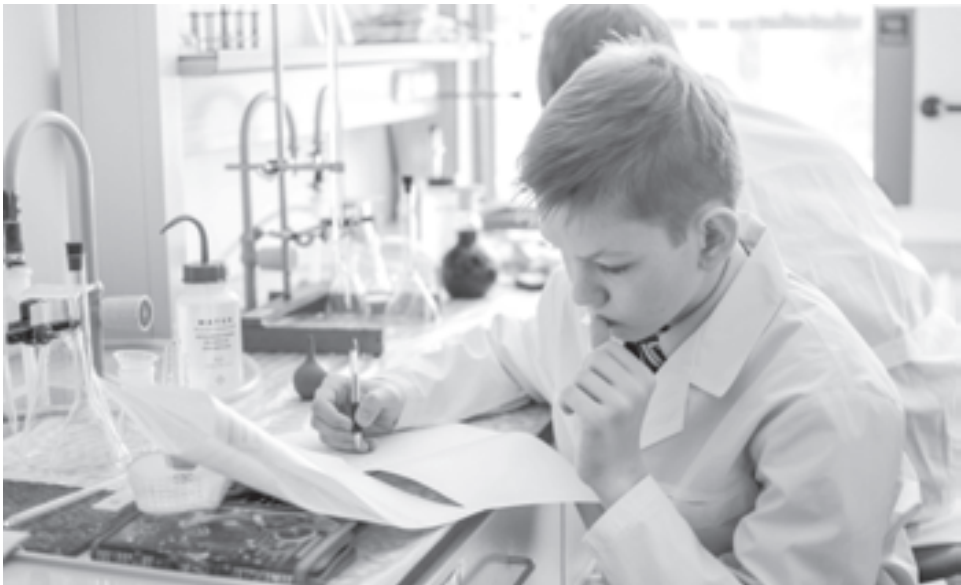
Одаренных школьников приглашают заниматься научной деятельностью в ведущих вузах страны