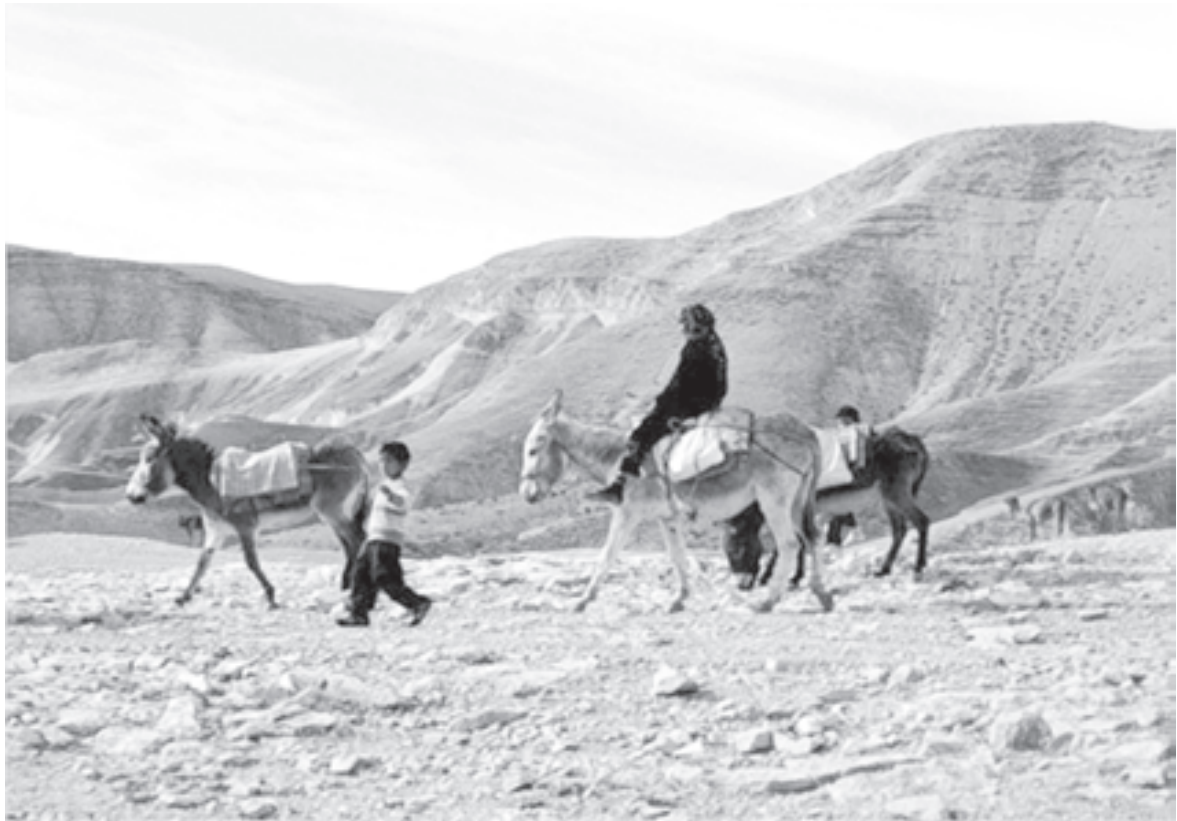
Бедуины живут племенами