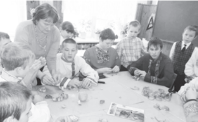
Плетение из бересты - полезное и увлекательное занятие

В Андогскую школу едут за опытом не только педагоги Вологодчины, но и других регионов России. Здесь часто проводятся различные конференции, семинары, форумы. А на праздники в школу приходят жители Никольского и окрестных сел.