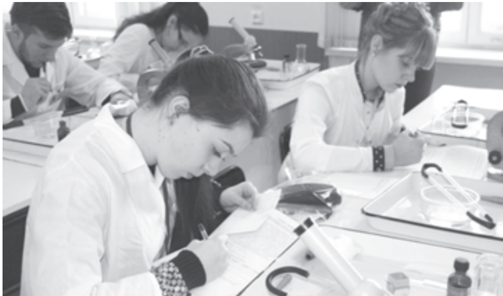
К подготовке сборных привлекаются не только учителя, но и руководители различных кафедр

- Спасибо за беседу, за личную заинтересованность и серьезную системную поддержку интеллектуального будущего нашей страны!