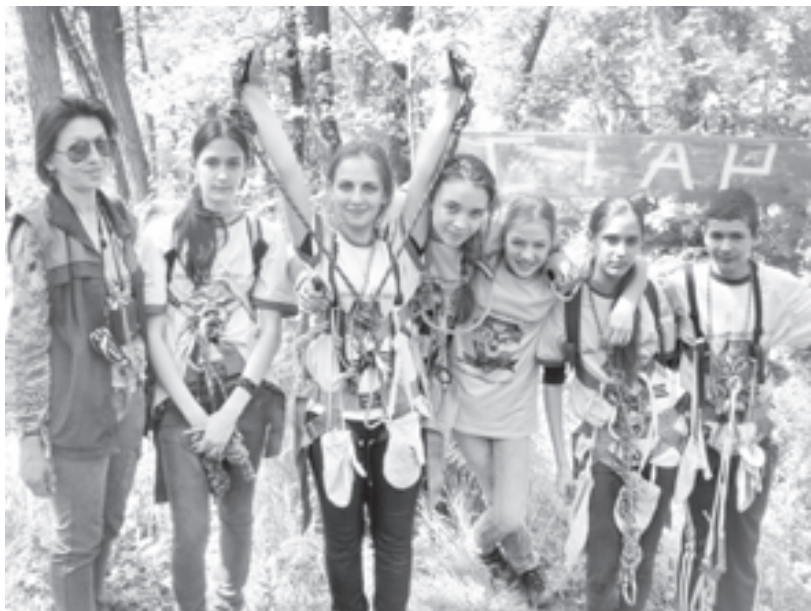
Детское объединение «Юный спасатель»

Популярностью пользуются все детские объединения дворца. Востребована и психологическая служба, которой руководит Лю-