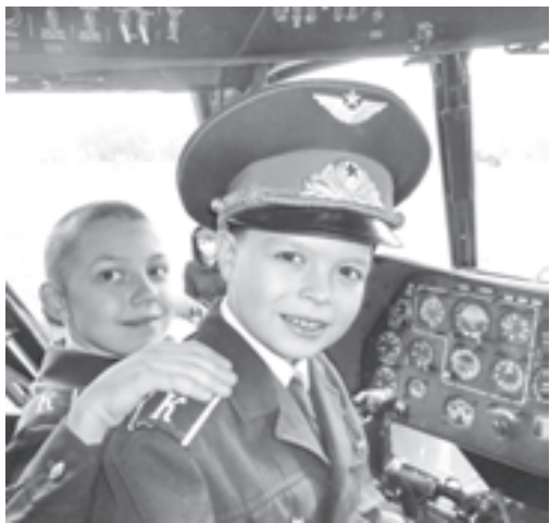
В клубе «Юный летчик»

В 2016 году исполнится 80 лет одному из самых знаковых учреждений города Ростова-на-Дону - Дворцу творчества детей и молодежи, правопреемнику Дворца пионеров, дипломанту Всероссийского конкурса учреждений дополнительного образования Южного федерального округа. Для многих поколений ростовчан он тесно связан с их юностью, кругом друзей, незабываемым счастливым детством. 23 мая 1936 года самое красивое здание города (здание Волжско-Камского банка архитектора Алексея Николаевича Бекетова) было передано детям. Здесь разместился Дворец пионеров и октябрят. Осенью 1936 года были сформированы два первых отдела дворца - научно-технический и художественный, в 1937 году появился натуралистический отел, а в 1938 году - военно-спортивный, в 1939 году - политико-массовый отдел. Таким об-