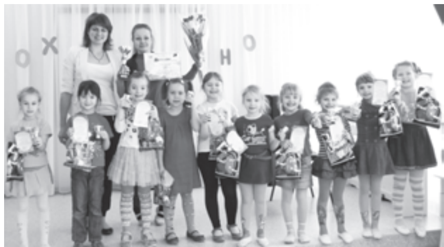
В детский сад №232 малыши ходят с удовольствием

В рейтинге общеобразовательных организаций по русскому языку на первом месте лицей №33, этот лицей лидирует и по математике. Муниципальное автономное общеобразовательное учреждение Ростова-на-Дону ли-