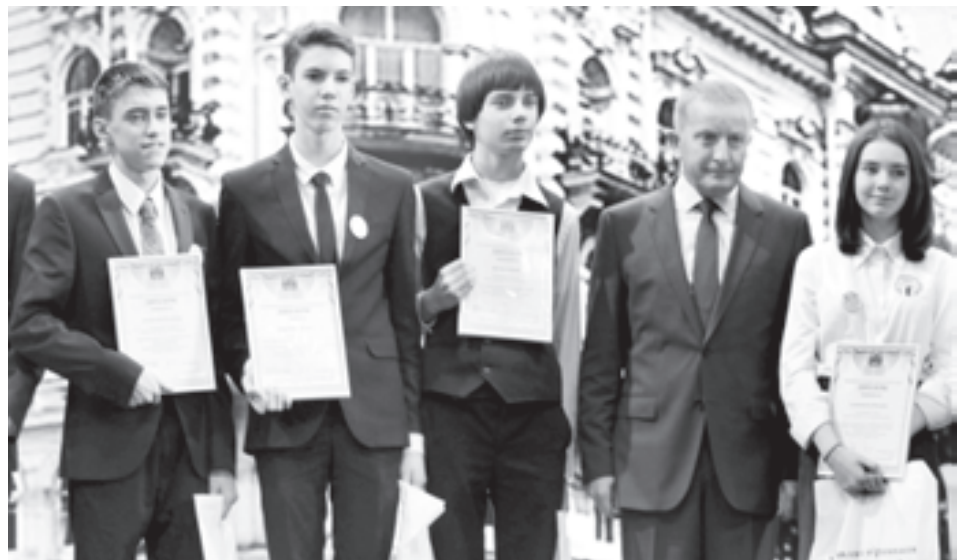
От качества знаний к качеству жизни