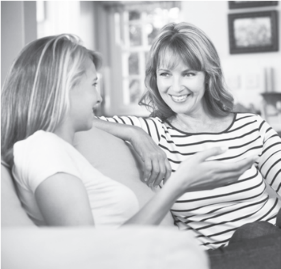
Ваша беседа должна быть откровенной и доверительной

Психологи считают, что первую менструацию можно назвать мини-кризисом подросткового возраста. Такие изменения для девочки непривычны, и молодой организм испытывает самый настоящий стресс. Из-за гормональной перестройки она может испытывать слабость, стать раздражительной и из пай-девочки превратиться в неуправляемого подростка. Поэтому будьте всегда готовы поддержать ее и, самое главное, понять, ведь вы тоже когда-то были подростком.