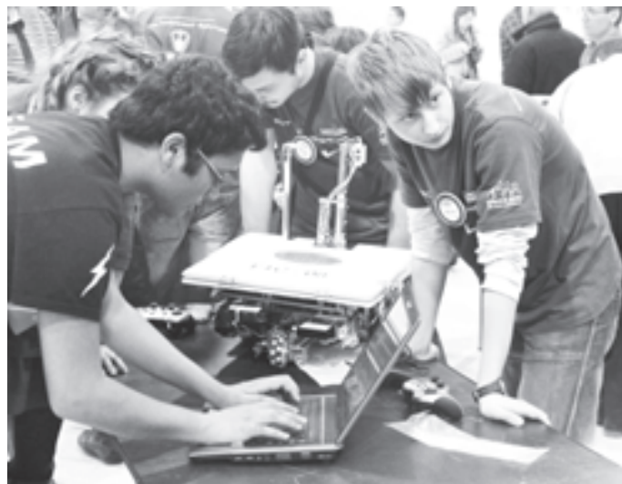
Занятия по робототехнике

Стержнем программы развития лицей является информатизация образовательного процесса. Так, в начальной школе установлена детская творческая мастерская с 15