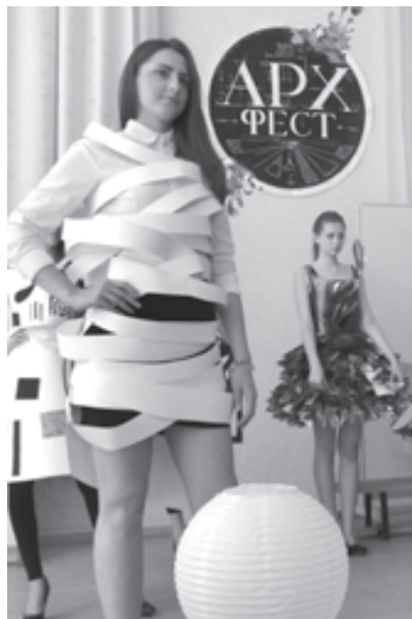
К фестивалю в 76-й гимназии готовятся целый год