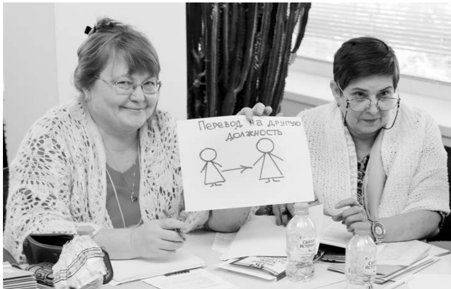
На правовом семинаре

В процессе совместного творчества родилась идея организации фотоществия