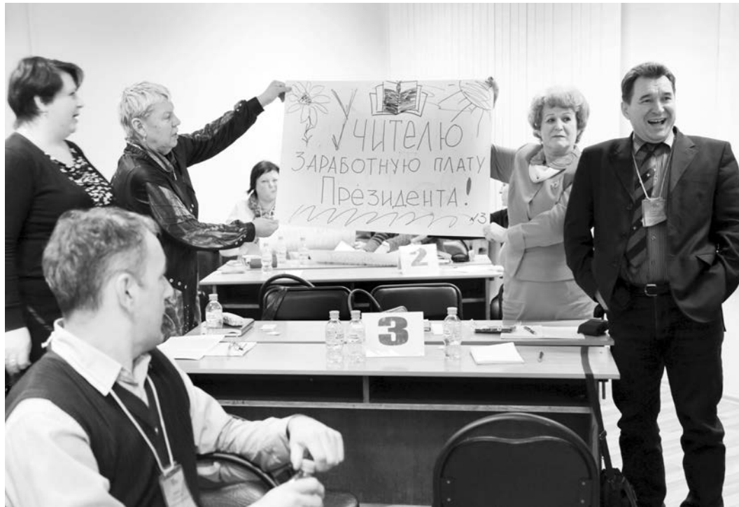
ЕГЭ проходил весело

уже давно и с годами только развиваются. В прошлом году коллеги пришли к выводу о необходимости совместного обучения проактива.