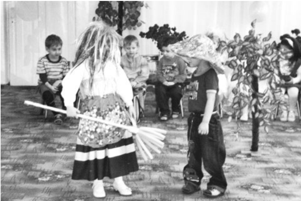
В «Аленушке» все дети талантливы

Летом для воспитанников «Аленушки» устраивается дневной детский ла-