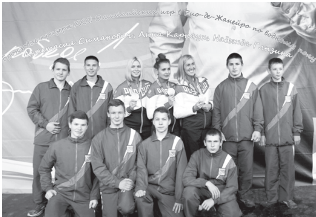
Молодые звезды Сланцев

С момента помещения несовершеннолетнего в учебно-воспитательное учреждение закрытого типа он приобретает статус воспитанника этого учреждения, а следовательно, права и обязанности, предусмотренные в соответствии с этим статусом. Помещение в учреждение закрытого типа не несет в себе существенный карательный потенциал и не лишает несовершеннолетнего самого права на свободу. Оно сконструировано таким образом, чтобы не препятствовать сохранению и развитию позитивных социальных связей несовершеннолетнего (особенно связи с семьей).