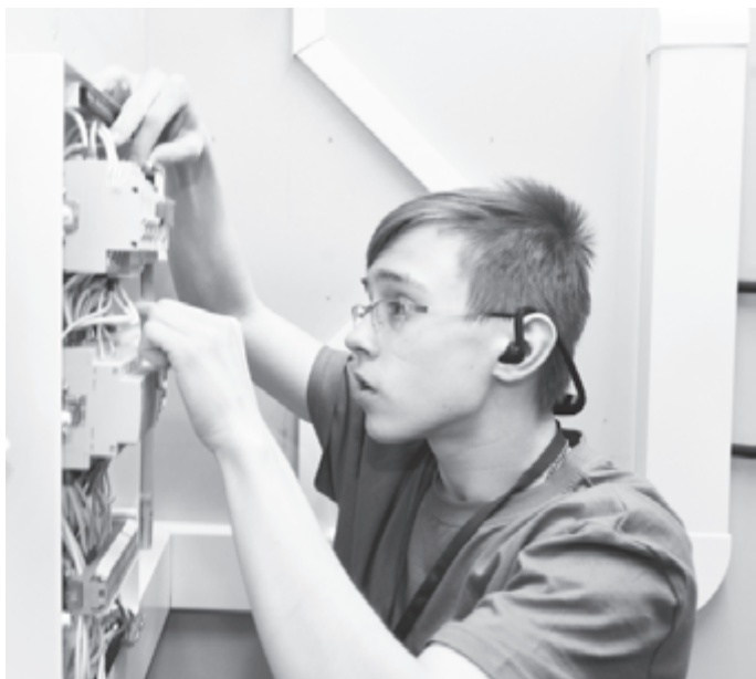
Инженер - профессия сосредоточенных

В чемпионате корпораций от региона участвовали 2 команды, и одна из них принесла в копилку медалей «бронзу».