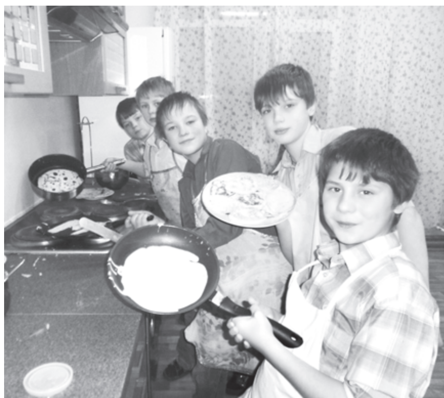
Кто сказал, что кухня не для мужчин?

- У всех ребят очень разные судьбы, поэтому и причины такого поведения у всех разные. Есть дети действительно из асоциальных семей, когда родителям глубоко плевать как на себя, так и на детей. У такой семьи соответствующее окружение. Есть ребята, кто получил какую-то серьезную психологическую травму и не может справиться с этим состоянием. Есть, наоборот, избалованные донельзя дети, которые уверены, что им все дозволено. Есть те, у кого подвижная психика, и они не могут усидеть на месте, их тянет жажда приключений. Каждый наш ребенок - это отдельная история. Они все чем-то по-