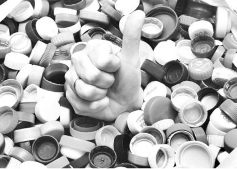
Крышечки собраны! А дальше?

Мораль: прежде чем заниматься очисткой окружающей природы от пластикового мусора самому, и тем более прежде чем привлекать к этому грязному делу детей, очень хоро-