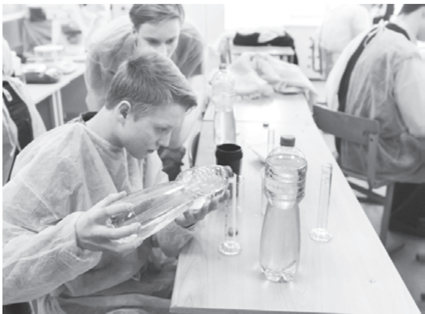
Одаренным детям нужна поддержка