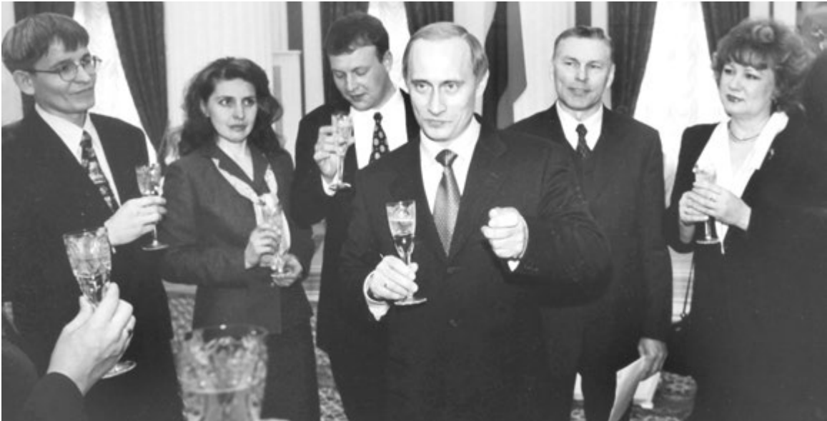
2000 год, Президент России Владимир ПУТИН поздравляет победителей конкурса в Кремле