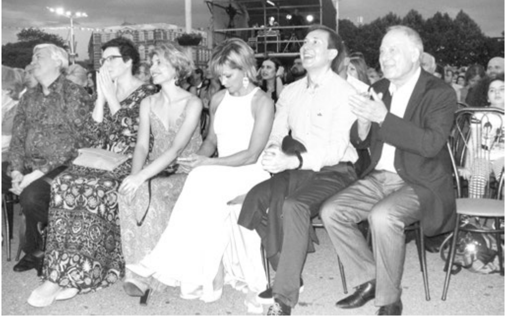
Фестиваль подарил множество радостных эмоций не только зрителям, но и членам жюри

Когда смотрел фильм «Жили-были», возникло ощущение, что это экранизация одного из рассказов В.Шукшина. Внимание к русской природе, деревенскому быту, взаимоотношениям людей, явная любовь автора к этим людям - все будто бы от нашего гениального самородка из алтайских