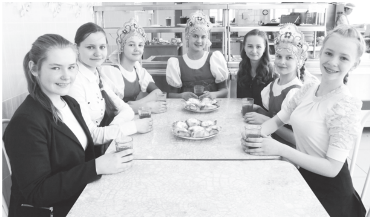
В школьную столовую, как на праздник!

согласились, не раздумывая. Во-первых, мы уже сами шли к тому, чтобы перевести оплату за питание с ручного режима в электронный, чтобы исключить сбор денег классными руководителями, а во-вторых, наша территория достаточно закрытая, всего 9 школ, и было бы удобно посмотреть, как это будет работать в режиме эксперимента.