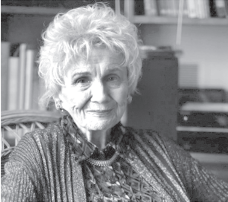
Так выглядит Элис МАНРО

В 1978 году Элис Манро во второй раз становится лауреатом премии генерал-губернатора - ее она получила за сборник рассказов «Ты кем себя воображаешь?» После этого она отправилась в свое первое мировое турне, посетив Китай, Скандинавию и Австралию. Именно в Австралии, в штате Британская Колумбия, ей предложили занять должность профессора в университете Квинсленда, и Элис Манро некоторое время жила там, а после вернулась в родной штат