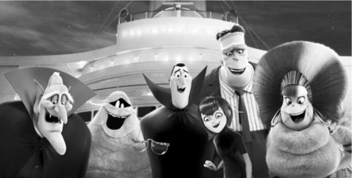
В центре сюжетов серии мультфильмов - тема толерантности

Но зато в третьей части монстры во главе с Дракулой по-настоящему расслабляются и развлекаются, что тоже хорошо. Им необходимо отдыхать, потому что в этом плане они ничем не отличаются от людей - от отдыха становятся лишь счастливее и добрее.