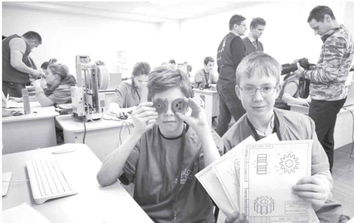
Теория с интересом и юмором

Участие в таком высокотехнологичном движении, как JuniorSkills, требует новых подходов к организации подготовки школьников, поэтому в Ленинградской области формируется система проведения учебно-тренировочных сборов, в ходе которых обучение строится на основе выполнения заданий региональных чемпионатов разных регио-