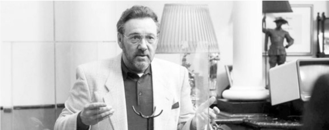
Участие в ленте оскандалившегося Кевина СПЕЙСИ - изюминка на невкусном торте

От этого великолепия (и больше всего от заинтересованного взгляда Сидни) у Джо кругом идет голова. И в