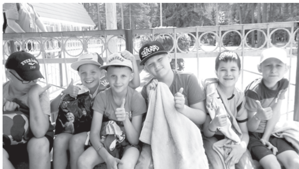
Новые друзья - это классно!