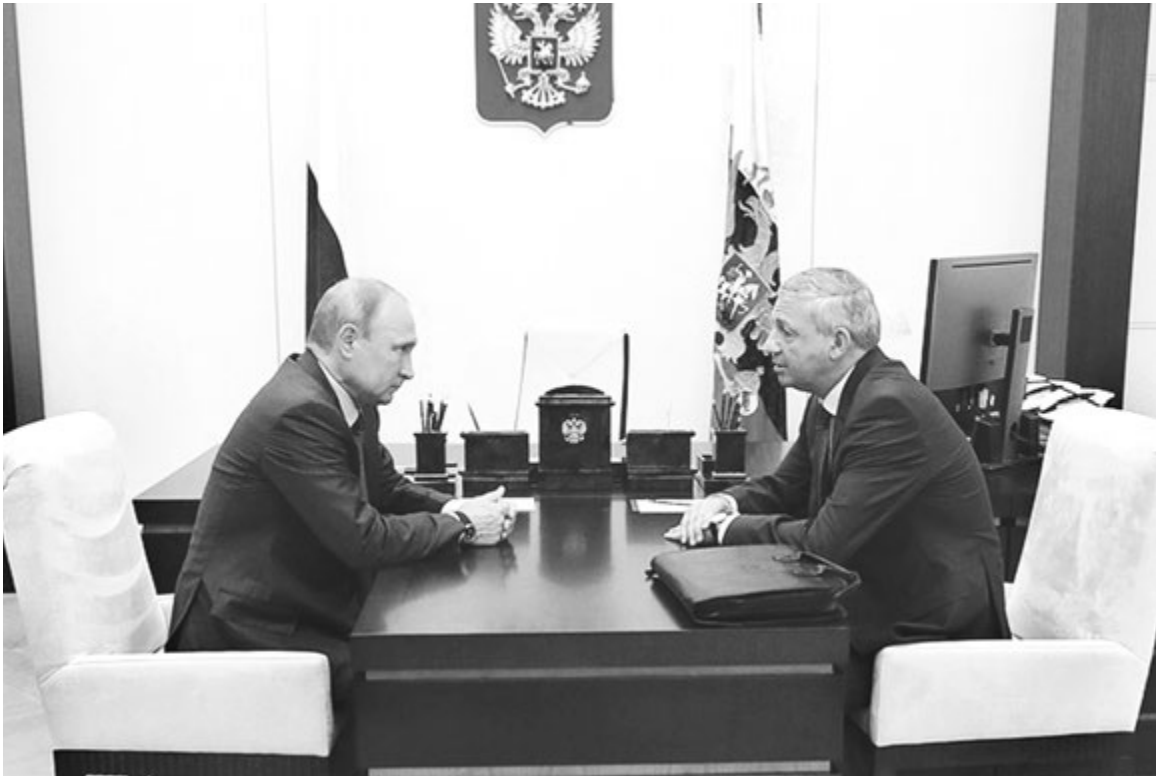
Глава Северной Осетии - Алании Вячеслав БИТАРОВ рассказал президенту о строительстве школ и детских садов

марки из Бангладеш, Беларуси, Китая, Турции и Узбекистана. Исследование проходило по 60 параметрам качества и безопасности, среди основных показателей - наличие токсичных элементов, способность ткани «дышать», впитывать и удерживать влагу. Кроме того, в программу испытаний были включены потребительские показатели - истираемость, прочность, пиллингуемость (появление катышков при эксплуатации), изменение линейных размеров, то есть усадка после стирки. Также тестирование включало показатели качества пошива и травмобезопасность фурнитуры. По результатам лабораторных испытаний брюки шести торговых марок («Лидер Торг», «Наша форма», «Одежда», «Смена», «Старт» и Olmi) не только соответствовали требованиям действующих норм по качеству и безопасности, но и требованиям опережающего стандарта Роскачества. В то же время в более чем 60% исследованных товаров эксперты выявили разного рода нарушения (в 2016 году доля нарушений превышала 80%). В 22 случаях из 62 изде-