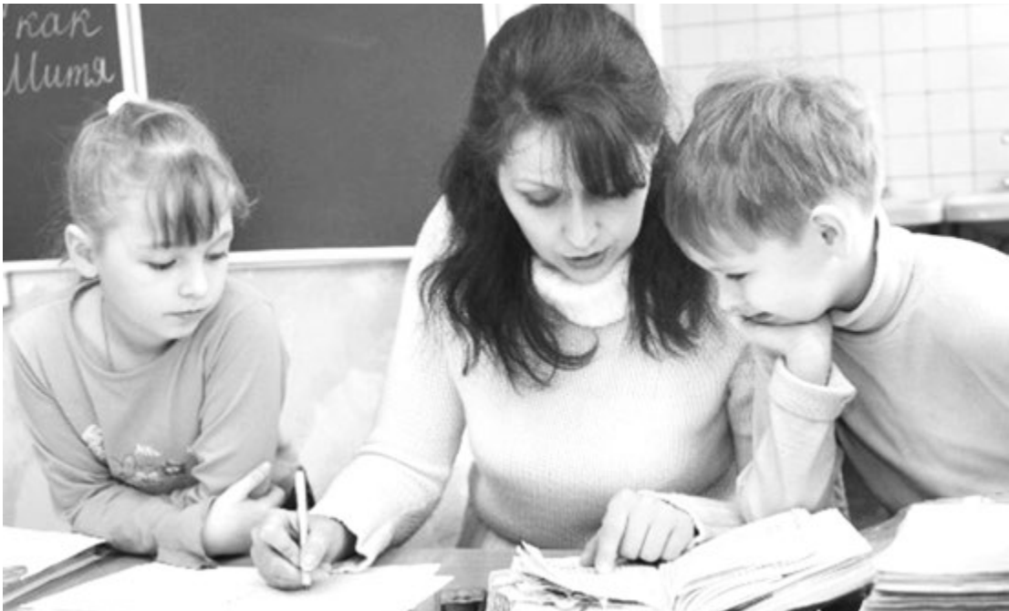
Есть вопросы? Ответы ищем вместе