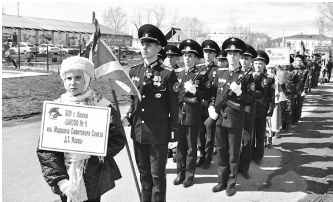
У парадной жизни есть и изнанка...

То есть на входе в «кадетку» мы имеем романтических мальчишек, для которых слова «есть такая профессия - Родину защищать» не пустой звук. А на выходе, по сути, готовых держиморд. Которые тем не менее надеются продолжать образование в военных учебных заведениях. Основа, так сказать, будущей армии. Если, конечно, сумеют поступить... Армию жалко. Или в нынешнем мире государству нужны именно такие офицеры?