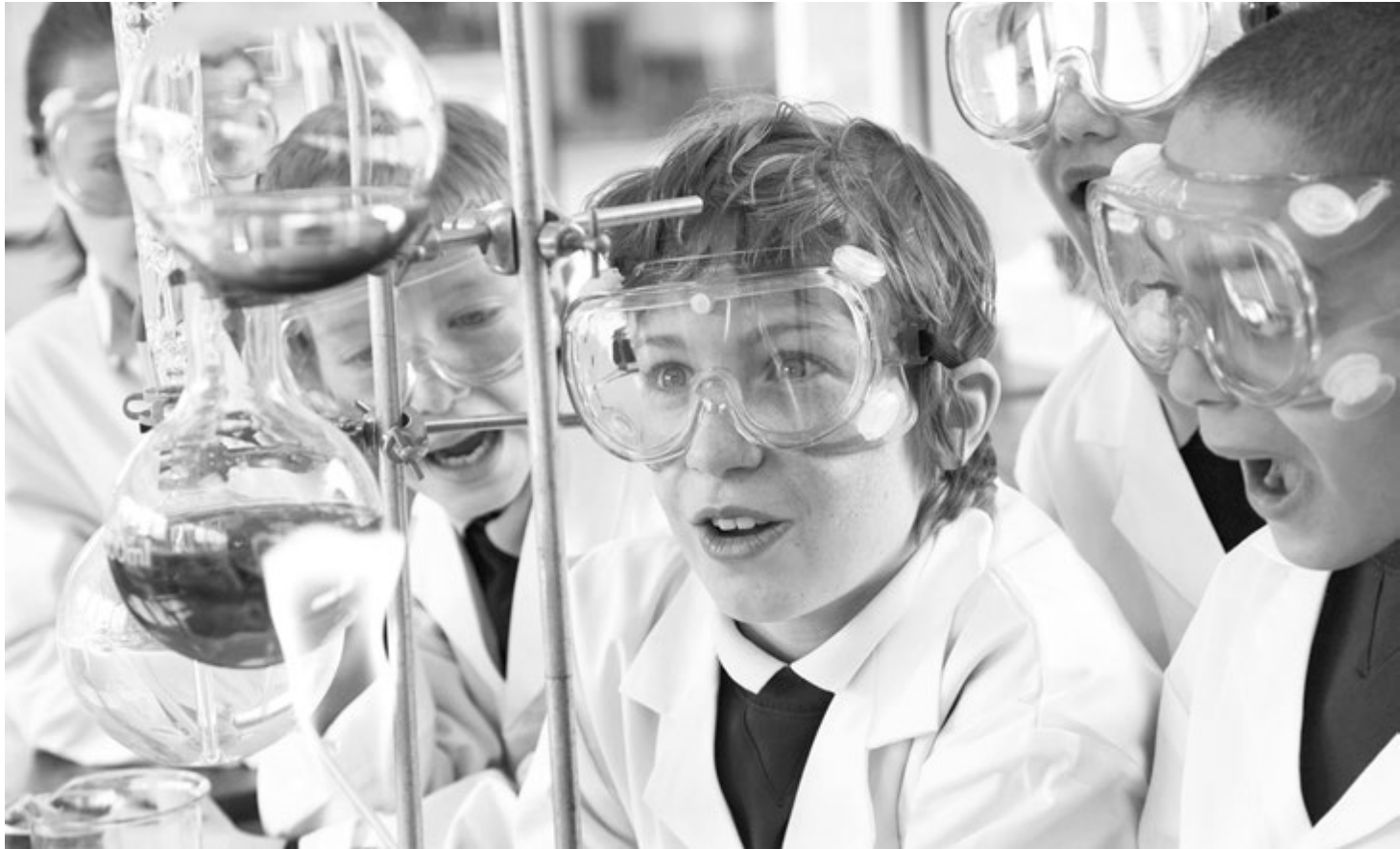
Лабораторные опыты увлекают учеников

Практическая значимость опыта заключается в разработке и применении практических