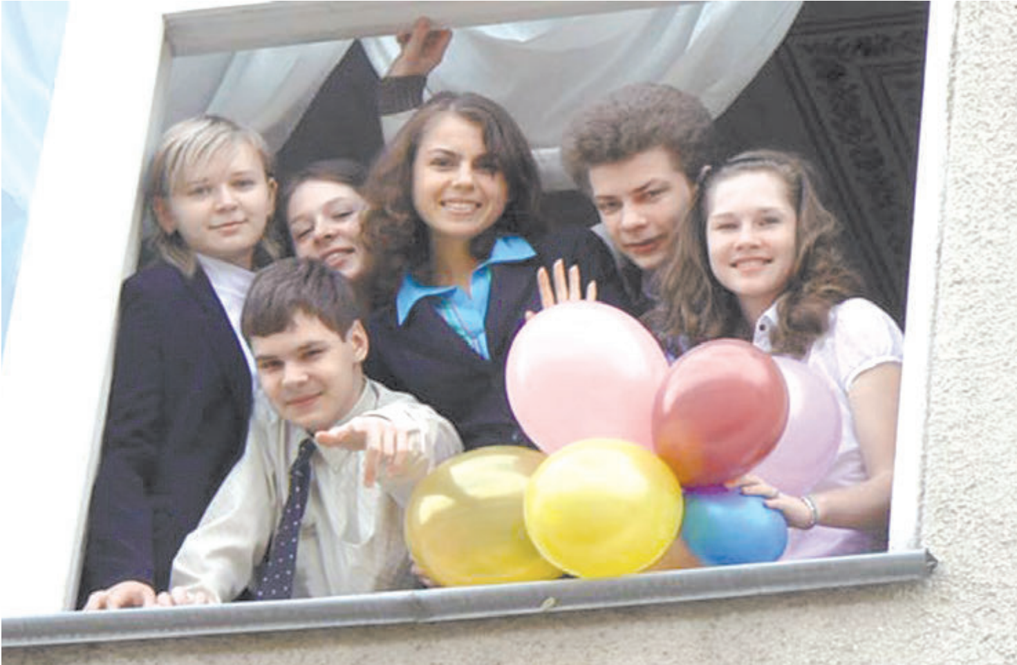
Нестеровский лицей славится своими выпускниками

Если с первого класса привык решать нестандартные задачи, тебе все по плечу