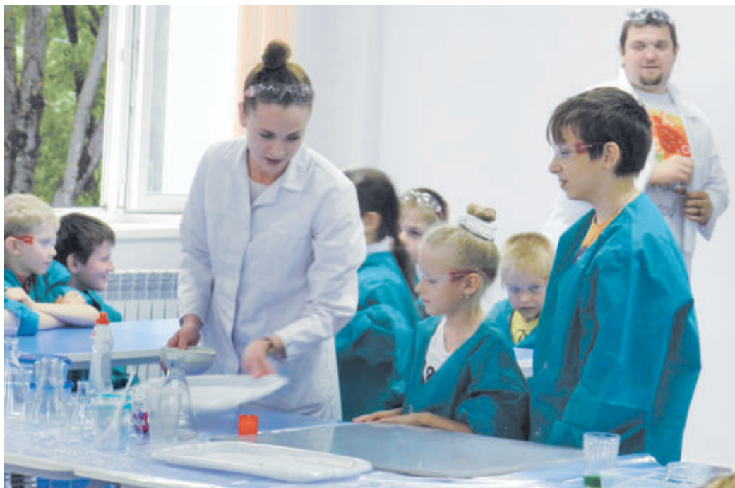
Эксперимент - главный двигатель науки!

С 16 по 22 июля учащиеся липецкого «Кванториума» принимали участие в фестивале фаблонов (небольших мастерских, где любой желающий может самостоятельно изготовить необходимые изделия и детали. - Прим. авт.) FAB 14 во французской Тулузе. Ежегодно в рамках фестиваля встречаются представители более 1200 проектных мастерских со всего мира. Они обмениваются опытом, обсуждают новые наработки и возможности сотрудничества в области цифрового производства, инноваций и технологий. Поездка стала возможной благодаря активному участию липецких кванторианцев во Всероссийском конкурсе естественно-научных и инженерных проектов «Реактор»: они представили наибольшее число проектов, которые получили высокую оценку экспертов. По итогам конкурса липецкий «Кванториум» был признан самой активной площадкой конкурса и удостоен главного приза - поездки на ежегодный фестиваль фаблонов FAB 14.