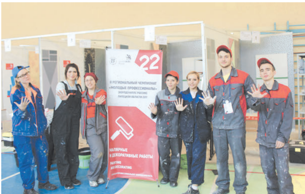
Молодые профессионалы ЛИСКа готовы на пять с плюсом.

избранной профессии. Для них в колледже открыто более 40 программ. Вообще, как утверждает статистика, лишь 15% трудоспособного населения в течение своей жизни не меняют профессию. Ведь нередко бывает так, что в юности мы не всегда осознанно выбираем профессию. С другой стороны, есть те, кто не от желания наверстать упущенное, а понимая исчерпанность пусть даже любимой некогда специальности, решает сменить профессию. Поэтому сегодня ЛИСК - это уже настоящий центр непрерывного образования и для тех, кто пришел сразу после (или вместо) школы, и для тех, кто готов принимать все новое, с чем человеку приходится сталкиваться в течение всей трудовой деятельности. Так что приходится колледжу учиться понимать запросы и тех, кому едва исполнилось 15, и тех, кому уже за 60. Последнее особенно актуально в связи с грядущей пенсионной реформой.