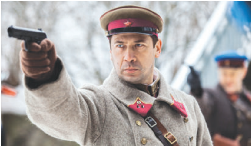
Герой Андрея МЕРЗЛИКИНА оказался виновником семейной драмы

И, конечно, не остаешься равнодушным, когда герои, идущие на смерть, но надеющиеся на лучшее, говорят: «Прощаться не будем». Они правы, расставаться ни к чему. Что бы ни случилось, они будут живы в памяти спасенных ими людей.