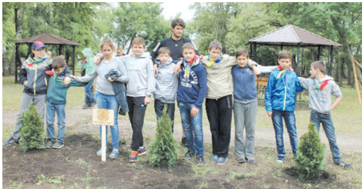
На Аллее успеха растут уже 30 деревьев, посаженных участниками смен