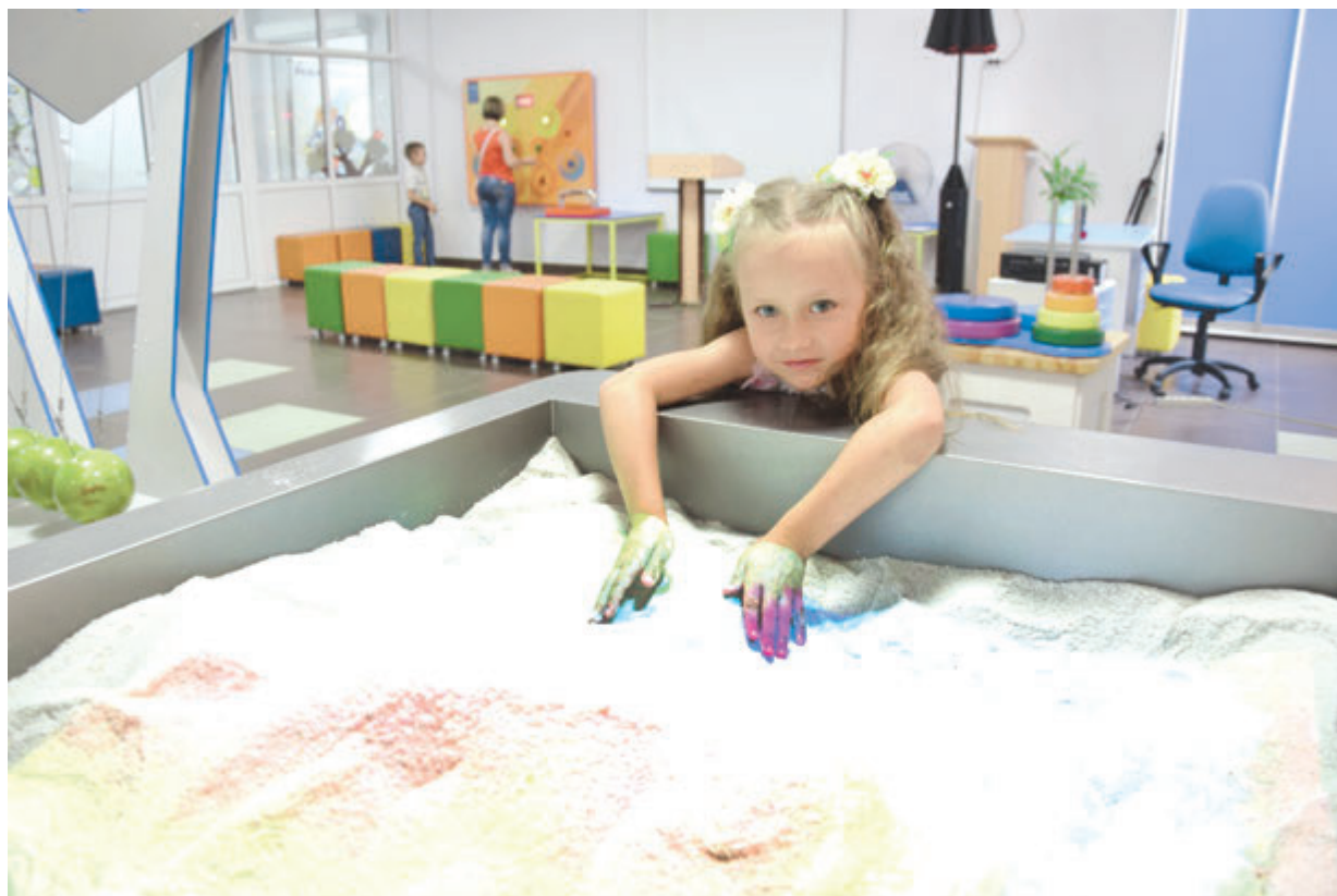
Главная достопримечательность «Музея науки» - кинетическая песочница

Детские технопарки воспитывают креативную, свободную и увлеченную наукой молодежь