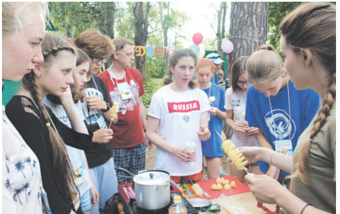
А вы хотите поучаствовать в мастерской по экологии обеда? Приезжайте на экспу!

Вообще двух одинаковых экспедиций не было и никогда не будет. Каждый год энергетика участников и энергетика места дают новый настрой. И так как экспа дело исключительно добровольное, волонтерское и неформальное, каждый раз возникает фонтан новых идей и ощущений. В этом году вдруг провели квест