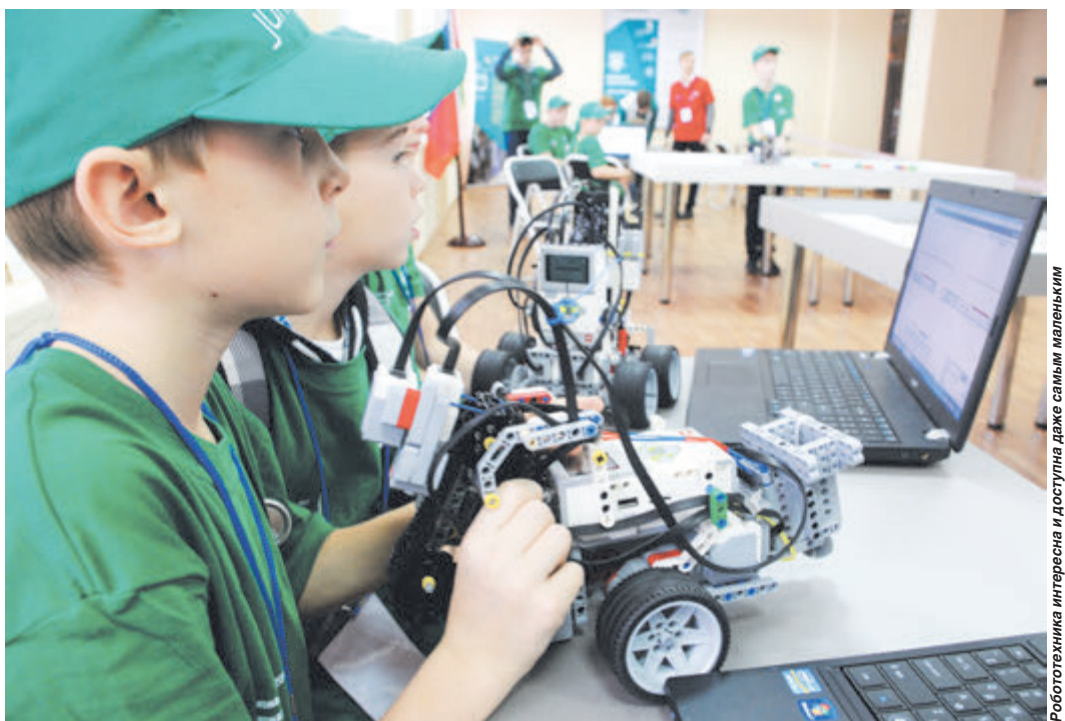
Робототехника интересна и доступна даже самым маленьким

Ученики центра входят в сборную России для участия в международном конкурсе «Таланты 21 века», ежегодно становятся победителями и призерами всероссийских и международных конкурсов, соревнований, конференций и фестивалей технической и художественной направленностей: Всероссийский форум научной молодежи «Шаг в будущее», Всероссийская выставка научно-технического творчества обучающихся «Юные техники - будущее инновационной России», Всероссийский детский фестиваль народной культуры «Наследники традиций», Большой всероссийский фестиваль детского и юношеского творчества и др.