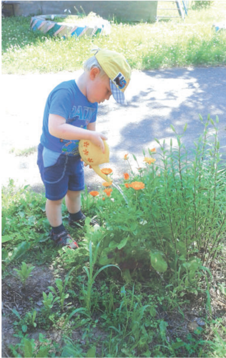
На участке «Малышок» о растениях заботятся дети

- Мы стараемся сделать процесс обучения и соединения его с сельскохозяйственным трудом радостным, эмоционально насыщенным. Для дошкольников и младших школьников разработаны специальные дидактические игры. В дошкольных группах проводятся тематические игровые занятия, содержание которых непосредственно связано с работой в учебном хозяйстве. Например, на занятии «В лесу и на огороде» дети сравнивают известные им дикорастущие и культурные растения. В игровой форме (с использованием рисунков-комиксов) проводится инструктаж по правилам безопасности при уходе за растениями. Младшие школьники ведут наблюдение за ростом растений с помощью красочных настенных дневников. Проводятся тематические игровые мероприятия. Для старших воспитанников, например, игра-соревнование «Клуб знатоков-животноводов», викторина «Агротехнология в русских пословицах и поговорках» и т.д. И конечно, мы регулярно совершаем экскурсии к нашим партнерам на «Красный маяк». У нас с ними весьма плодотворные связи. К примеру, руководством сельхозпредприятия несколько лет назад был объявлен конкурс на лучший проект современного животноводческого ком-