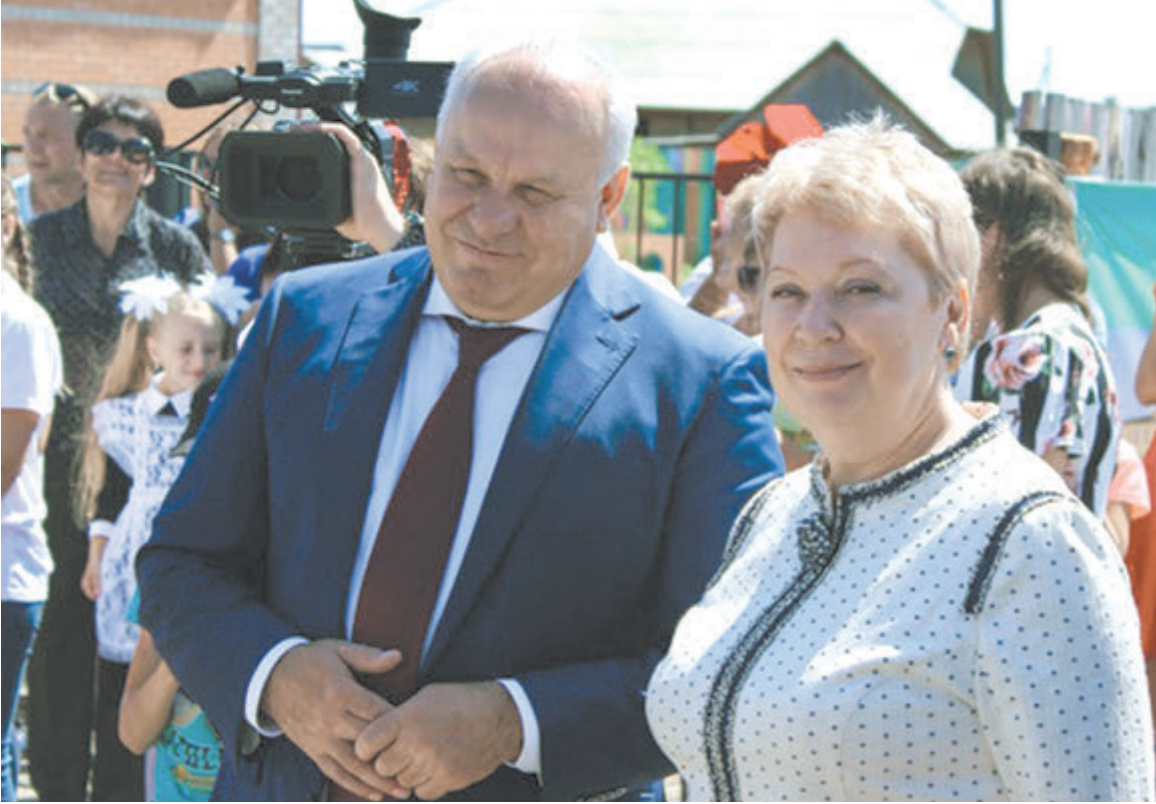
Виктор ЗИМИН и Ольга ВАСИЛЬЕВА приняли участие в закладке новой школы в Хакасии

Рособрнадзор за неисполнение предписаний в установленные сроки запрещен прием в Региональный институт бизнеса и управле-