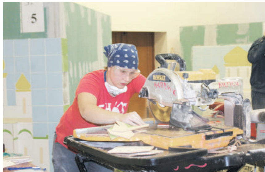
В кафельном деле даже девушки!

Однако и это еще не все, что касается свободы, которую обретает студент колледжа в ЛИСКе. Например, приходит подросток с намерением учиться