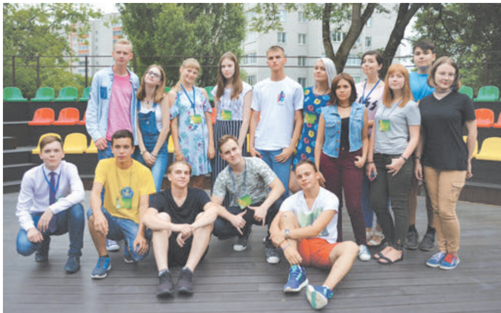
Фестивальная смена «Стратегия» объединила лучших учащихся профильных смен.