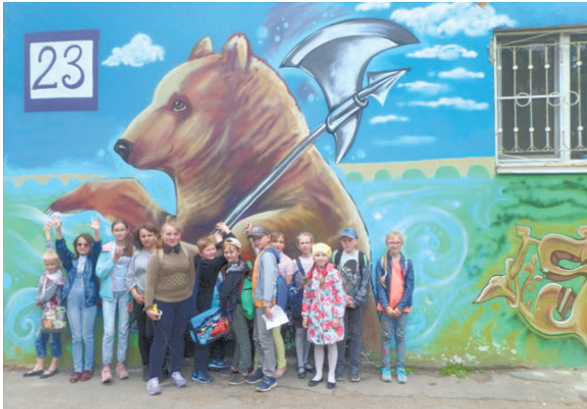
По пути в юношескую библиотеку Некрасова ребята увидели граффити с изображением герба Ярославля

Именно поэтому с 2013 года в школе появились занятия внеурочной деятельности «Проба пера» для самых маленьких - второклассников и третьеклассников - продолжительностью 45 минут один раз в неделю. Ребята в группах исследовали тексты разных жанров, выявляли общие признаки, анализировали работы сверстников и затем создавали свои тексты: сперва короткие - счи-