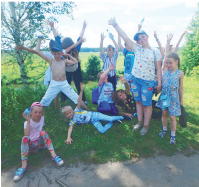
Возвращаемся из похода