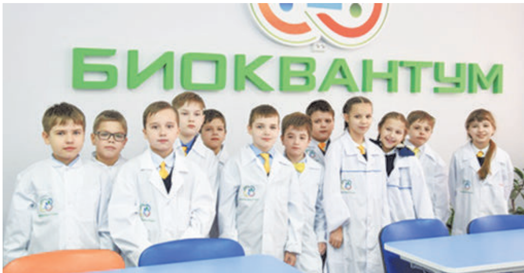
В «Биоквантуме» ждут исследователей всех возрастов.

Сердце любого «Кванториума» - Hi-tech-цех. Здесь и деревообработка, и лазерная резка, и 3D-печать... Сначала его хотели разместить отдельно от учебных лабораторий, но потом поняли, что это правильно, когда цех находится в такой точке, которую нельзя миновать, куда бы ты ни направлялся в технопарке. Возвели прозрачные стены, чтобы каждый мог заглянуть и хотя бы на расстоянии приобщиться не только к высоким задачам проектирования, но и к вполне приземленным - реализации возникшей идеи. Все этапы воплощения проектов нужно знать на зубок!