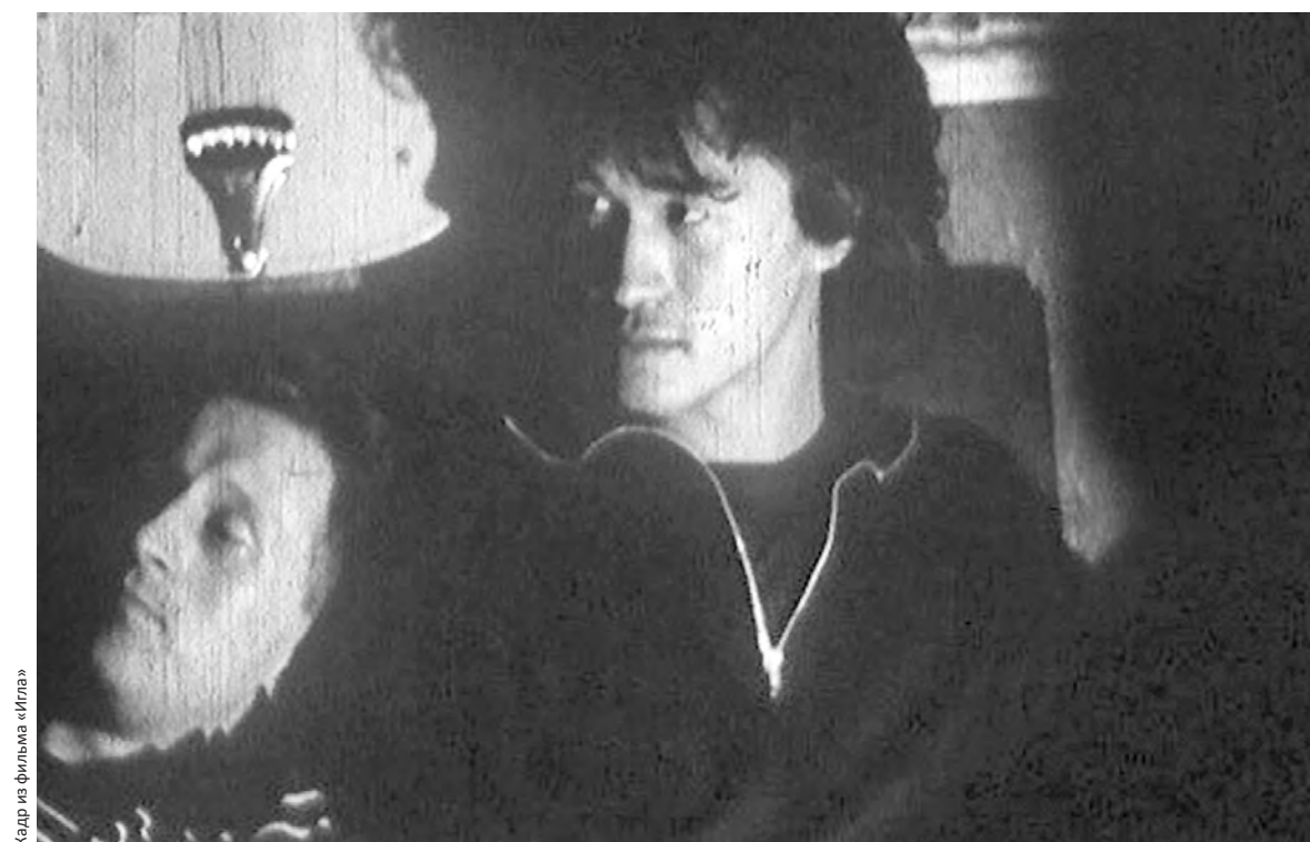
Кадр из фильма «Игла» Перемен, мы ждем перемен...

«Ия-хха» (1986), Рашид Нугманов Дипломная работа Рашида Нугманова, ученика Сергея Соловьева. Замысел родился в 1985 году. До этого Рашид хотел снять «Короля брода» - фильм про стилия в Алма-Ате. Он задумывался как большой проект, на который еще нужно было ждать одобрения. Постепенно сформировались условия для создания импровизированной короткометражки про рок-н-ролл в Ленинграде, тем более что дух времени сам подталкивал снимать здесь и сейчас, а не ждать у моря погоды. Интересно, что Рашида, как и автора «Конец каникул», вдохновил альбом «45». Договорившись с Константином Кинчевым, Борисом Гребенщиковым, Виктором Цоем и Майком Науменко, режиссер отснял за две весенние погожие недели материала на несколько часов.