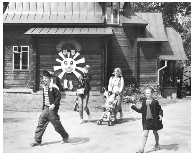
Во дворе чудо-теремка