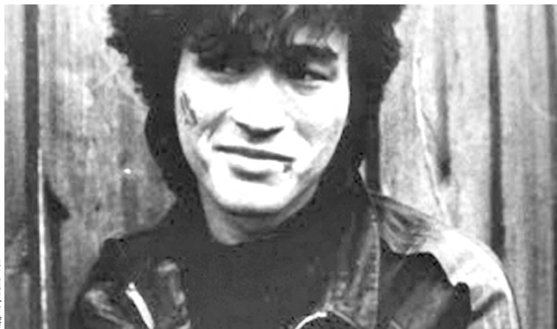
Кадр из фильма «Рок» Я просто чувствую себя свободным...

Документалка, смонтированная из частной видеохроники уже после смерти Цоя. Бытовые подробности, репетиции, концерты, интервью Джоанны Стингрей, взятое у участников группы. Все это пронизано светлым настроением, что полностью оправдывает название. В фильме звучат песни «Следи за собой», «Бездельник», «Попробуй спеть вместе со мной», «Любовь - это не шутка» и другие. Хороший подарок для фанатов.