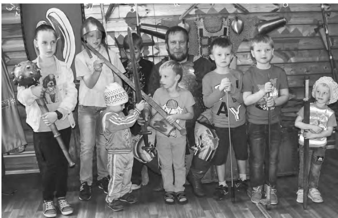
Наставник Алеши Поповича припас для ребят много сюрпризов