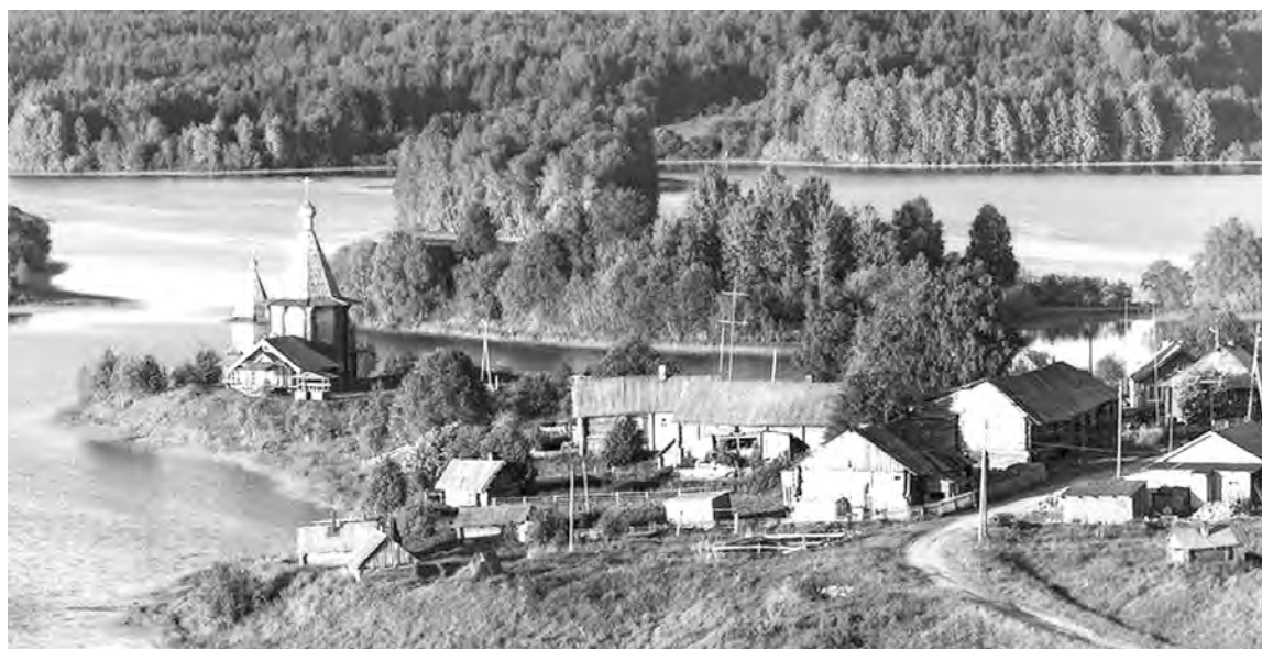
Деревня Усть-Река, где власти попытались закрыть школу