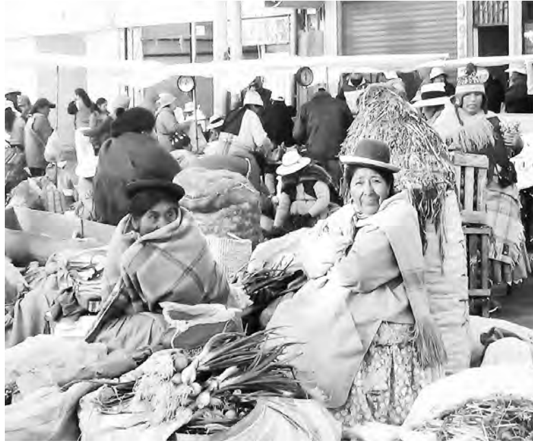
Рынок о стране тебе откроет больше, чем экскурсии

В чужой стороне я стараюсь прежде всего посетить местные базары. Слово древнее, индоиранского происхождения. То же, что и рынок, яр-