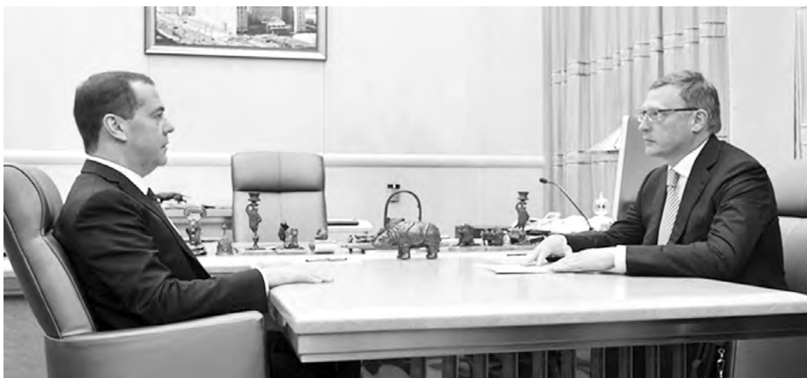
Дмитрий МЕДВЕДЕВ и Александр БУРКОВ обсудили строительство школ в Омской области

Роскачество совместно с Минпромторгом России приступает к исследованию качества одежды для школьников. В 27 регионах России эксперты анонимно закупят школьную форму и исследуют ее в специализированных лабораториях по трем направлениям: показателям безопасности, качества и повышенным потребительским свойствам. В рамках исследования будут проверены 62 бренда брюк для мальчиков, произведенных в России, а также Белоруссии, Китае и Италии. Результаты исследования будут представлены на портале Роскачества в августе. В преддверии этого события эксперты дали рекомендации родителям, как выбрать школьную форму. Для климатических условий средней полосы оптимальным считается состав с содержанием шерсти 40-60% плюс синтетические волокна. Пугаться синтетики в составе ткани вовсе не стоит, в определенном количестве она только улучшает ее свойства: вещь становится прочнее, меньше мнется и лучше сидит по фигуре, а в сочетании с шерстью не меняет ее основных качеств. При выборе брюк родителям следует обращать внимание не только на состав ткани верха, но и подкладки - лучше, если она будет сделана из вискозы или хлопка с добавлением синтетических волокон. Роскачество советует внимательно относиться ко всем деталям брюк: начиная от молний и заканчивая формой пуговиц, фурнитура не должна быть травмоопасной.