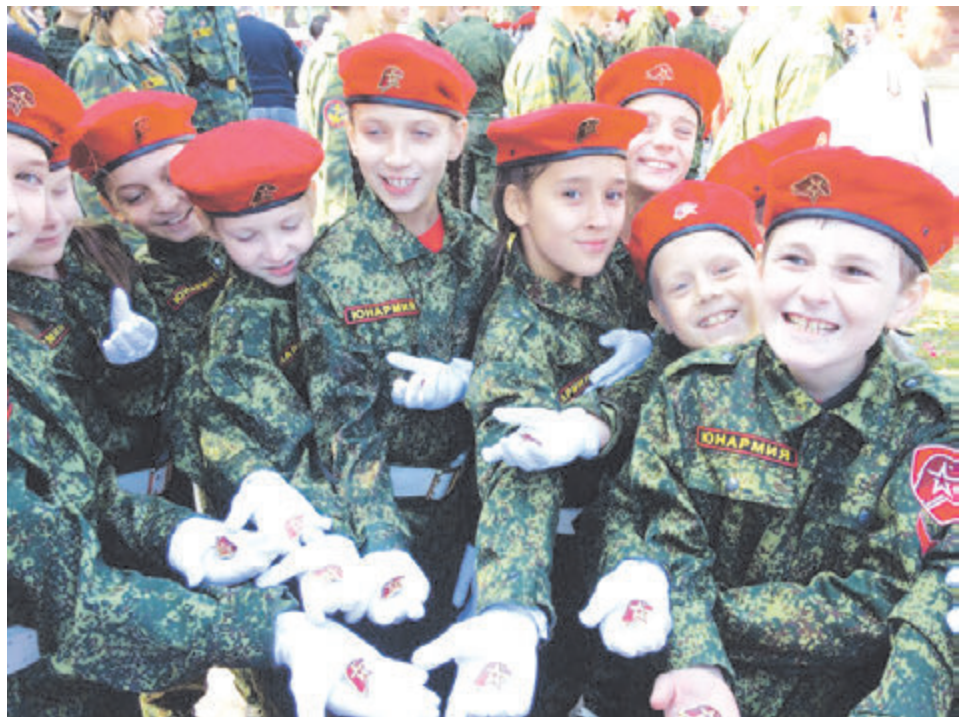
Ребята из 53-й школы активно участвуют в движении «Юнармия»