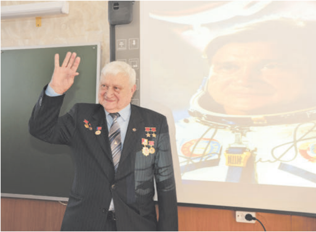
Анатолий Васильевич ФИЛИПЧЕНКО во время посещения родной школы

- Анатолий Васильевич, когда у вас появилась мечта о космосе? - В пятом классе. Я тогда учился в школе №2 города Острогожска Воронежской области и стал заниматься в авиамodelьном кружке. Сначала мы делали чертежи моделей, затем собирали простейшие конструкции. Использовали лучинки бамбука, папиросную бумагу, казеиновый клей. В июне 1937 года самолет АНТ-25, ведомый Чкаловым, Байдуковым и Беляковым, выполнил беспосадочный перелет Москва - Северный полюс - США. Весь мир с волнением следил за этими событиями. Мы, мальчишки, играли в Чкалова, так же как и в Чапаева. Вот тогда появились мысли: «Полетать бы...»