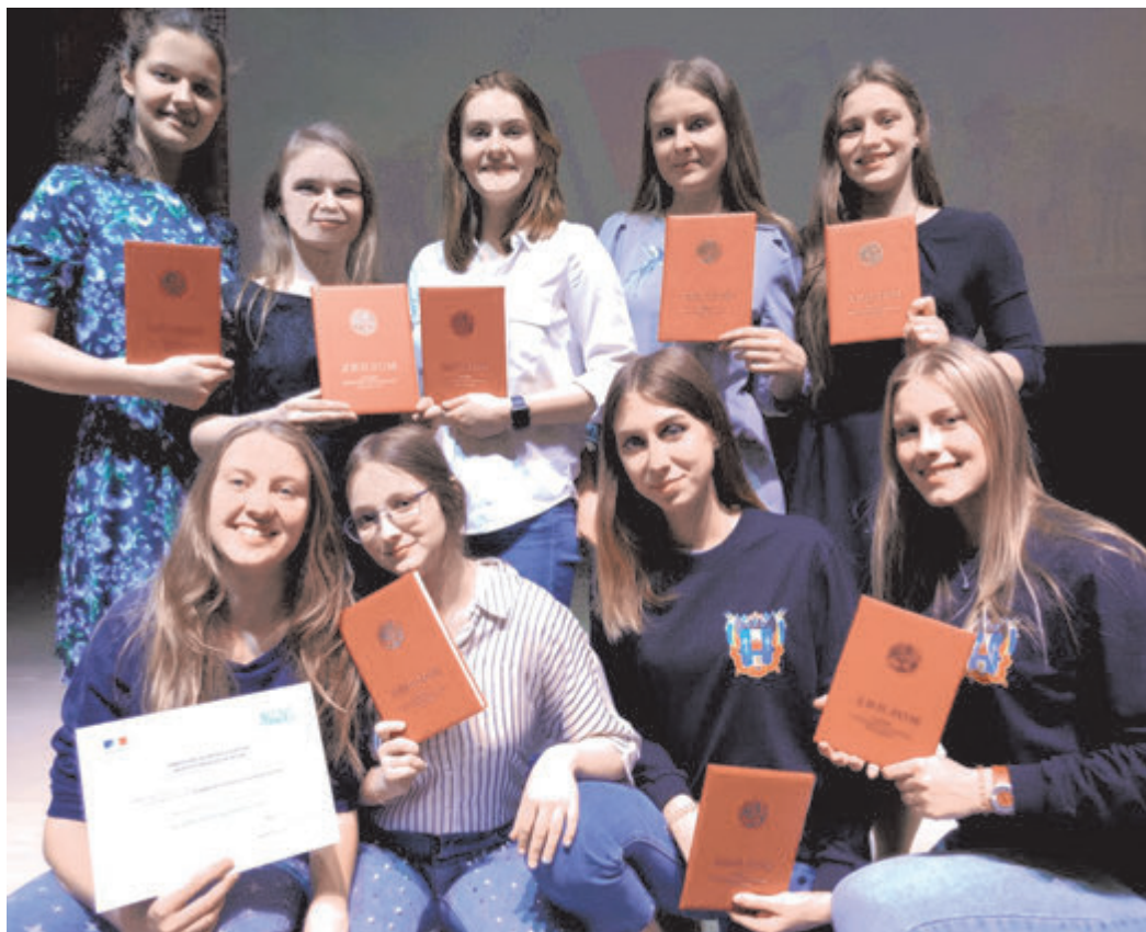
Знают наших! Победители и призеры заключительного этапа Всероссийской олимпиады по французскому языку