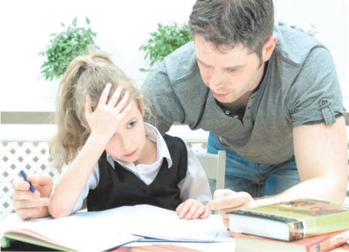
Как учение не превратить в мучение?

но наоткрывать очень много всего замечательного, но кому все это будет нужно, если не будет людей, которые это смогут применить? А они, добавлю я, в основном произрастают в обычных школах, которые не претендуют на насыщение жизни учеников постоянным полетом творче