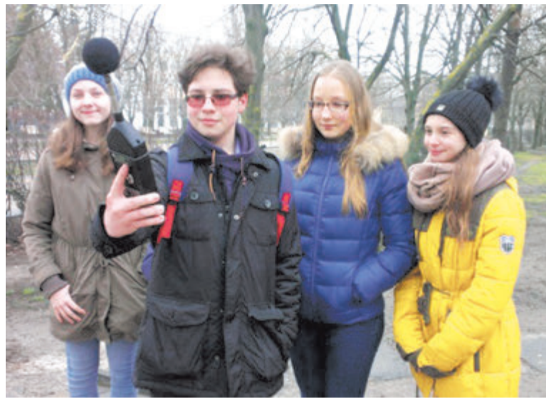
Урок географии в Парке имени Плевако (школа №60)

Активизация мыслительной деятельности обучающихся в школе происходила через включение в процесс обучения задач с нестандартной формулировкой, задач со сказочным, ролевым сюжетом, задач с практическим содержанием, задач «Найди ошибку», логических задач, задач на поиск закономерностей.