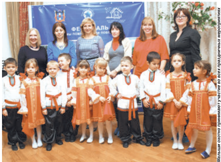
Мальчики охотно принимают участие во всех праздничных мероприятиях

Детство - особая пора, когда формируется личность ребенка. От того, какие условия созданы в детском саду, кто будет заниматься развитием и воспитанием маленького человека, зависит его дальнейшее будущее. В детском саду №118 Ростова-на-Дону за более чем 40 лет накоплен уникальный опыт в области дошкольного образования. Открыт он был еще в 1973 году как подведомственное учреждение завода «Рубин». Сегодня детский сад радушно встречает 434 мальчиков и девочек. Здесь создана особая атмосфера уважения к личности и потребностям каждого ребенка.