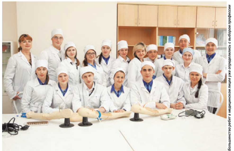
Большинство ребят в медицинском лицее уже определились с выбором профессии

- Управление образования города Ростова-на-Дону заключило меморандум о сотрудниче-