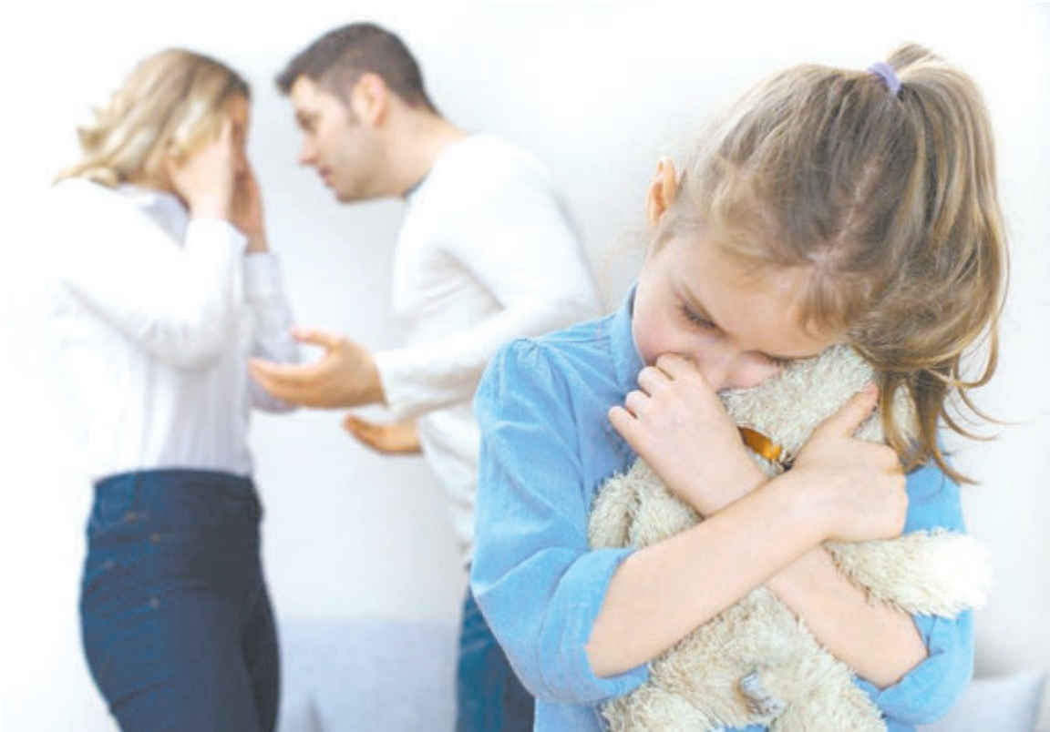
Горькие минуты одиночества