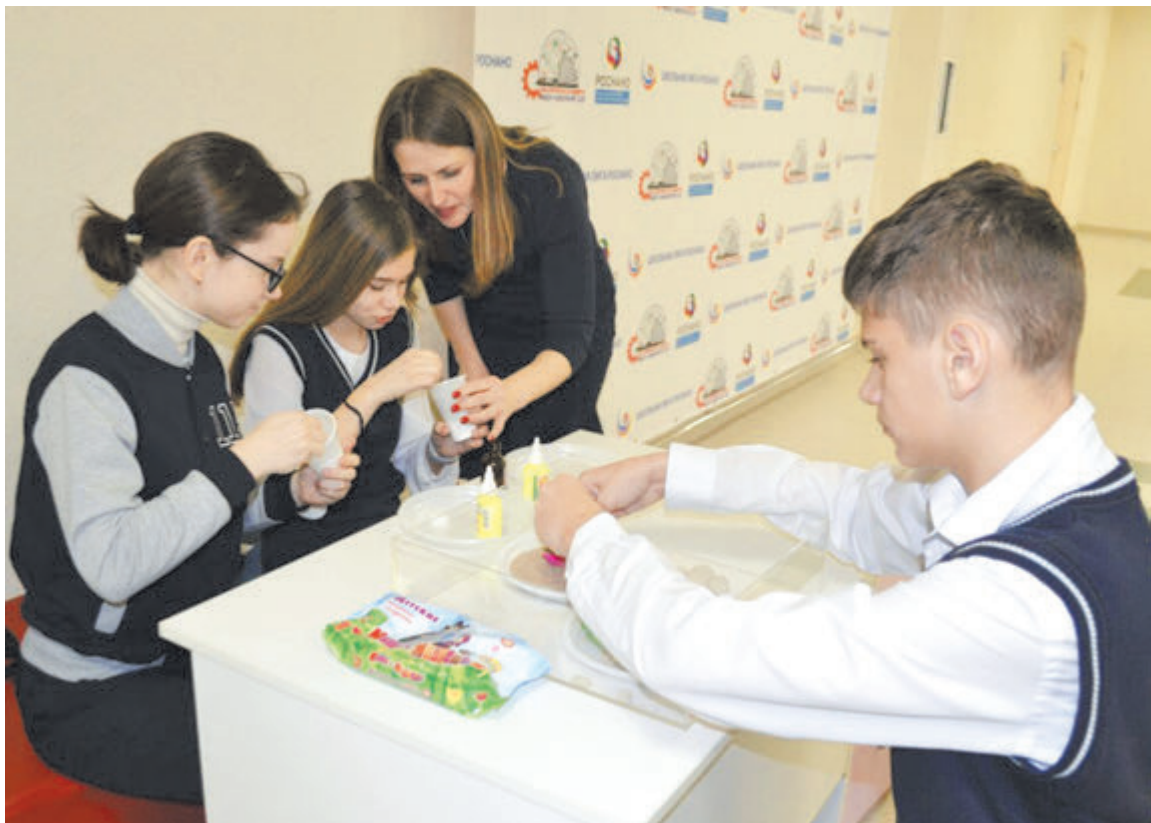
Для научно-исследовательской работы ребят есть все необходимое

Примечательно, что 115-я школа является школой - партнером образовательной программы «Школьная лига РОСНАНО». Совместно с РОСНАНО в школе создана STA-студия - это уникальное пространство для проектной деятельности и творчества детей.