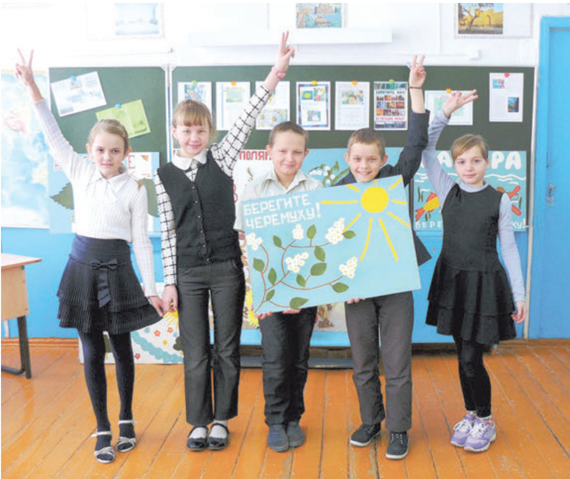
Интерес - вечный двигатель творческих исканий

Неожиданно и родители наших учеников включаются в проект, помогают организовать на защите проекта фитобар. Больше всего нам понравилось пробовать различные настои и отвары из лекарственных растений. Правда, некоторые из них имеют не очень приятный вкус, например полынь. Поэтому первыми были выпиты чаи из плодов и корней шиповника, листьев мяты, душицы, чабреца и зверобоя, смородины и малины. Восстанавливали и иммунную систему соком из одуванчиков, которые сами и собирали, выжимали сок. А еще мы рябинки возле школы посадили, будем теперь за ними ухаживать.