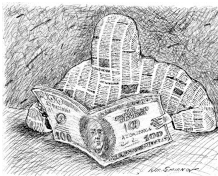
Рис. Игорь Смирнов