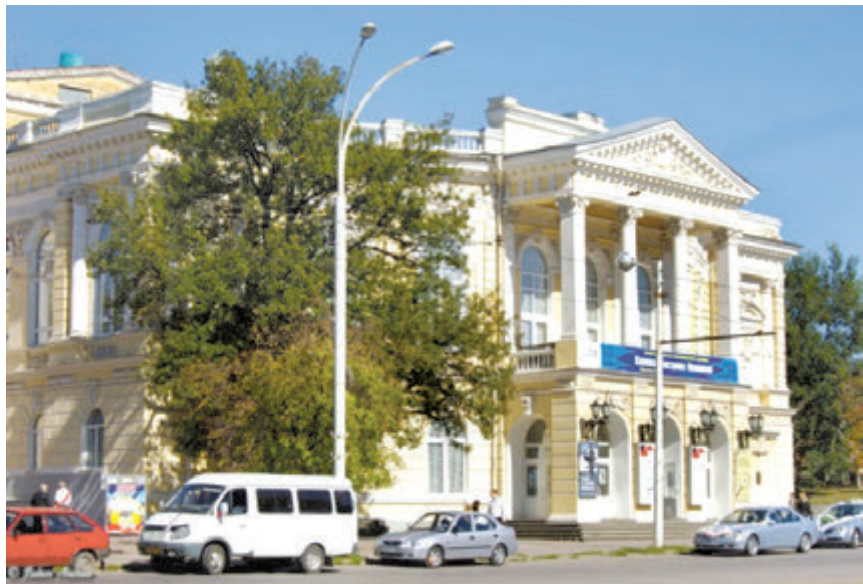
Ростовский-на-Дону академический молодежный театр

«Культурное наследие» - проект Управления образования города Ростова-на-Дону и музея-заповедника М.А.Шолохова. В его рамках реализуется целый цикл образовательных мероприятий, по-