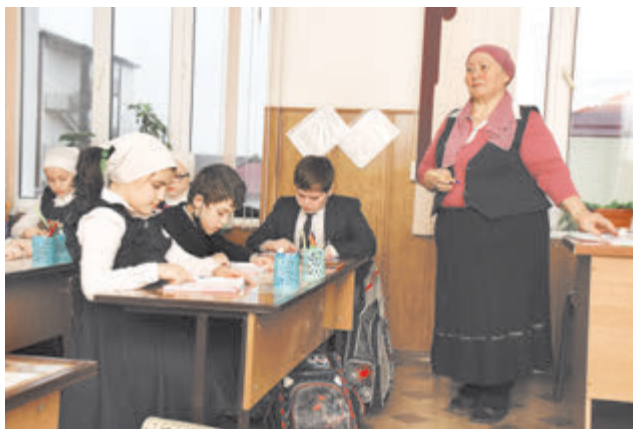
Каждый педагог должен быть заинтересован в профессиональном росте

Любой руководитель любого уровня системы образования заинтересован в повышении уровня профессионализма своих подчиненных. Вот только не все и не всегда знают, как это сделать максимально эффективно и с наименьшими затратами. А если речь идет о массовом обучении педагогов, то проблема усложняется многократно. Между тем в Чеченской Республике нашли выход из этой весьма непростой ситуации.