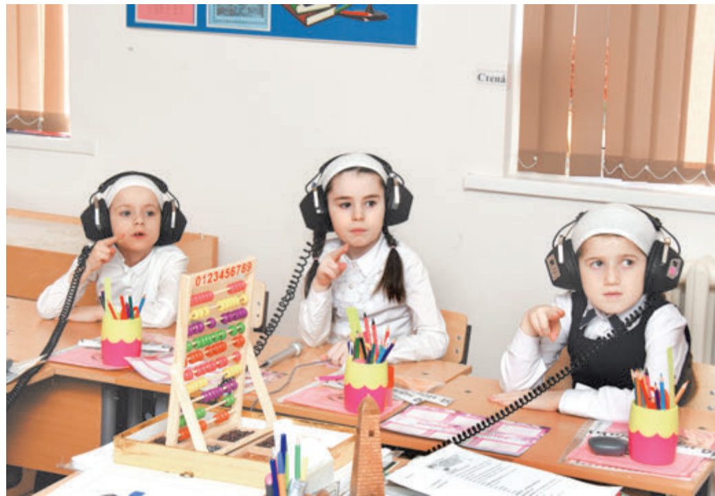
Учимся слышать, слушать, говорить

же гораздо большее внимание уделяют общему развитию, а сдают только ОГЭ.