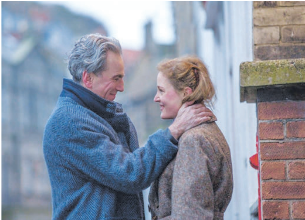
Невидимая нить влечения связывает главных героев ленты

Еще из плюсов: мало какая картина может сравниться с «Призрачной нитью» по подаче материального мира. Бархат платья, кружево белья, фарфоровые завитки посуды, поджаренные бока булочек - все это хочется потро-