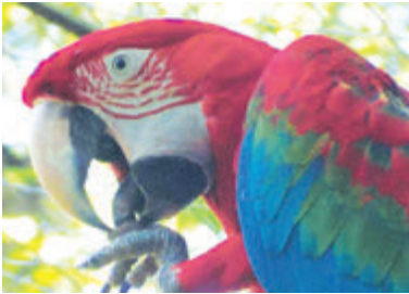
Брат наш меньший

вид напоминает горчицу. Однако ни к ней, ни вообще к продуктам эта солоновато-горьковатая приправа не имеет никакого отношения, поскольку делается из... глины. Перуанцы считают, что она весьма полезна для желудка. Тут же на базаре в отдельном ряду можно увидеть (и приобрести, и попробовать!) перуанскую картофельную изюминку - чуньо. Это древний способ сохранения урожая, который применялся еще древними индейцами горных районов Южной Америки. Клубни раскладывали на открытом месте и подвергали воздействию солнца и ночных заморозков. Для более быстрого удаления влаги днем после оттаивания клубни осторожно перетапывали ногами. Затем корнеплоды промывали и либо досушивали окончательно, получая так называемое черное чуньо, либо предварительно вымачивали несколько