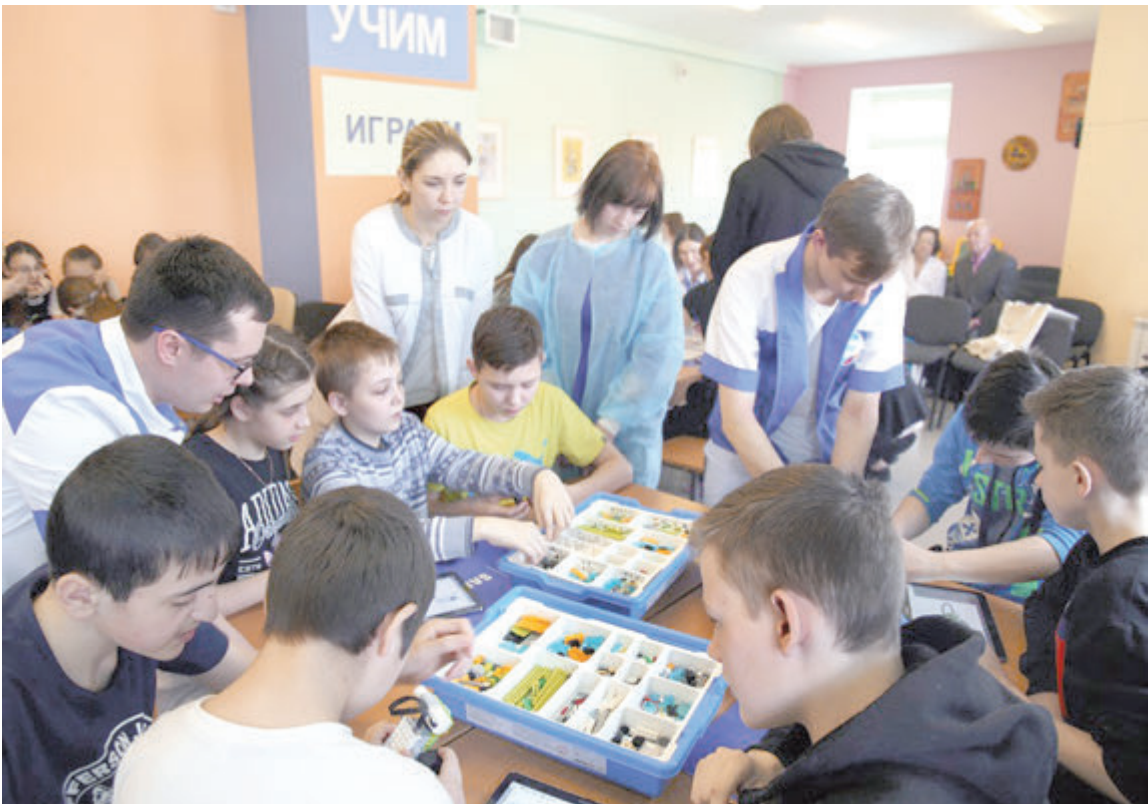
Дети получают новые возможности и приобретают хороших друзей

Работа школы, находящейся в условиях медицинского центра, требует особой среды. Классы оснащены современным учебным оборудованием и мебелью, работа в классах ведется в том числе с использованием современных информационных тех-