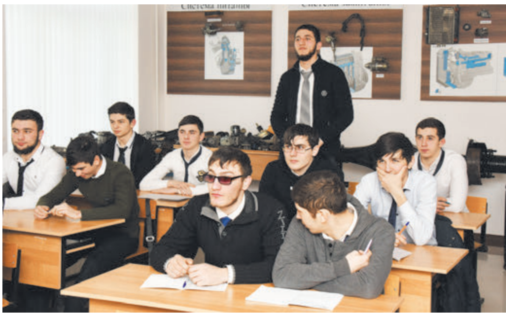
Каждый второй выпускник техникума поступает в вуз

В первую очередь мы нацелены на то, чтобы предугадать потребности рынка, - поясняет она. - Ориентируемся на наши условия, идем в ногу со временем. Обязательно нужно уметь думать на перспективу. Например, республика интенсивно развивается, становится все более благоприятной обстановкой для развития туризма. Значит, нужно заниматься подготовкой кадров для этой отрасли. У нас ведь очень красивая природа, богатый национальный колорит. Активно развиваются информационные системы, и