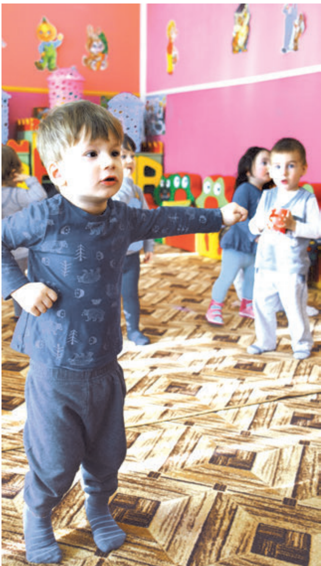
Лезгинку здесь танцуют уже в самом раннем возрасте