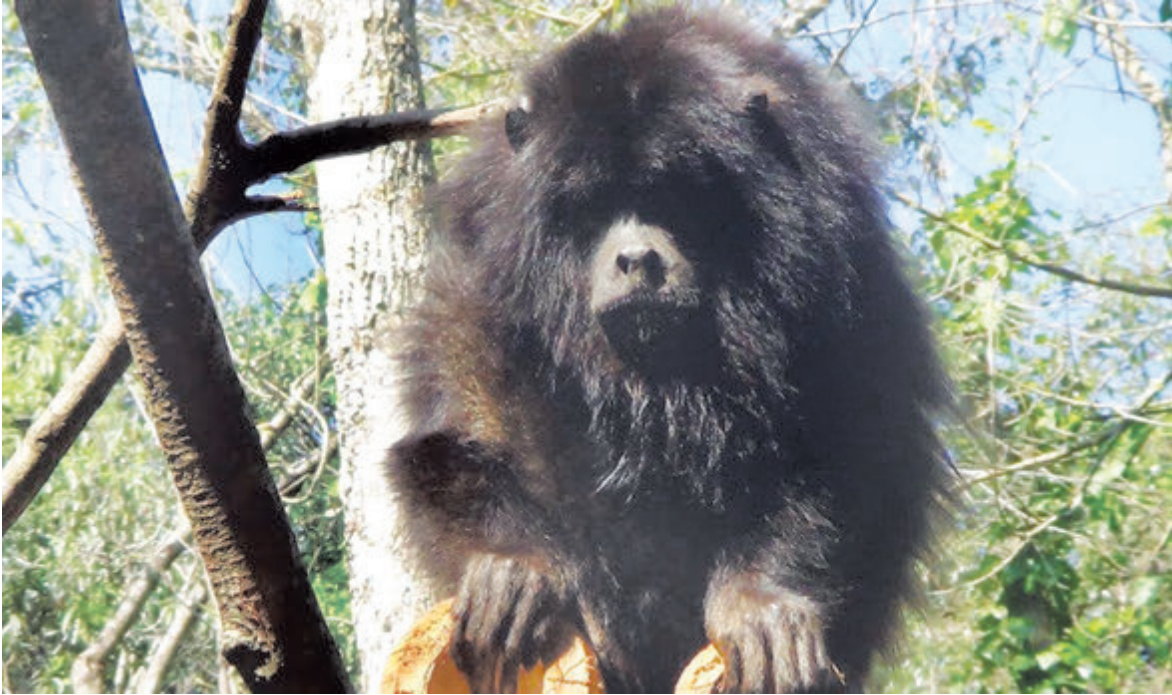
Чужеземье для нас - это тайна

ли миру этот корнеплод, называют его папой всех овощей. На базаре в Пуно (а это перуанское высокогорье - около четырех тысяч метров!) из-за картофельных сопок, мешков, наполненных этим овощем, не видно самих торговцев. Поражают и форма, и разноцветье клубней, в котором присутствует вся радужная палитра. По вкусу сорта естественно тоже заметно различаются, самые сладкие даже могут потребляться сырыми. Я нередко в походе, когда заливаю кипятком овсянку, мелко крошу туда и картошку. Понятно, что она на вкус несколько сыровата, но ничего, в желудке вполне успешно переваривается. Подобного картофельного изобилия и разносортности я нигде не встречал. По всей стране, кстати, насчитывается не менее трех тысяч