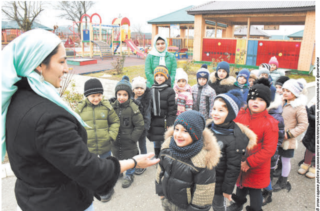
В этом садике ребята развиваются интеллектуально, эмоционально и физически