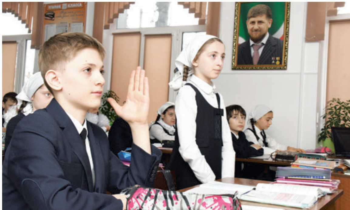
Знания школьников должны быть оценены максимально объективно!

ведь к нам нередко приходили молодые люди из сельской местности, а они были нацелены на то, чтобы вернуться в родное село. Тем не менее сейчас у нас работает довольно много представителей молодого поколения, некоторые даже нашли здесь свою половинку.