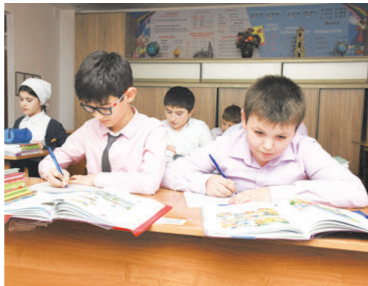
Рекорды учеников - заслуга школы и учителей

- У нас налажены связи практически со всеми школами республики. Учитывая тот факт, что в лицее отмечаются очень высокие показатели, к нам часто обращаются коллеги, и мы помогаем им чем можем. Также мы стали одной из 44 стажерских площадок республики. В каждом из этих учреждений регулярно проводятся се-