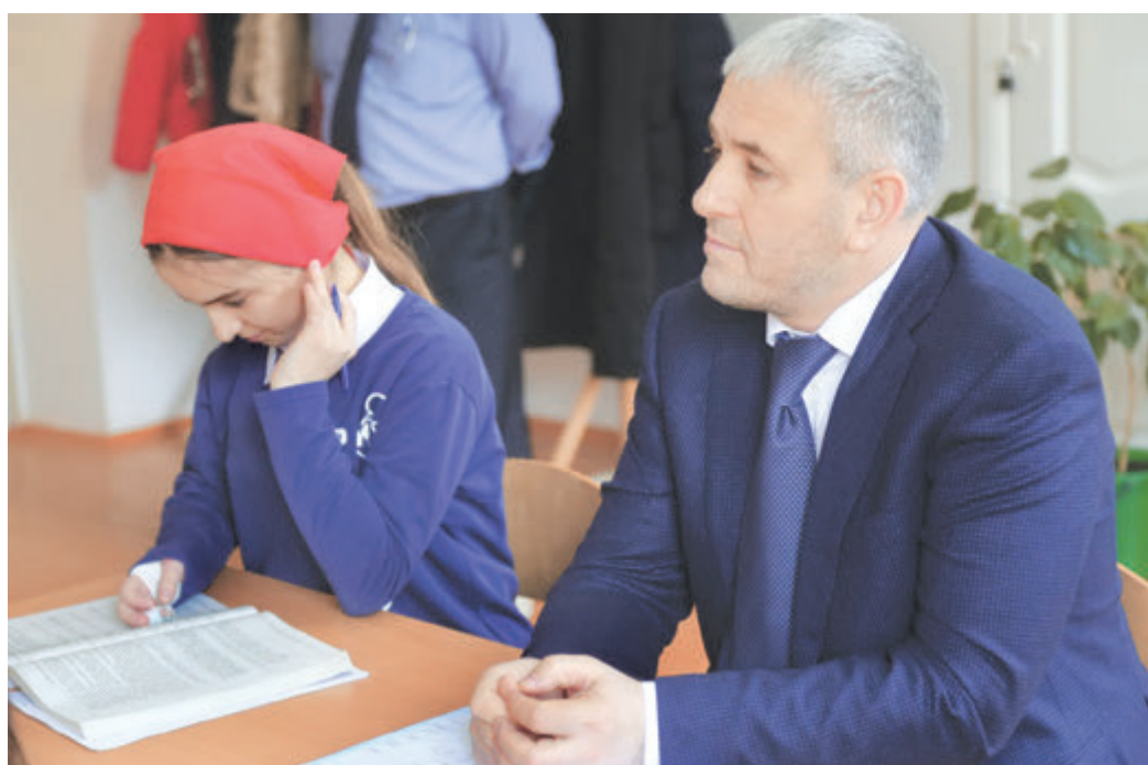
Чтобы руководить, нужно быть в курсе всего.

В течение прошлого года нашими гостями становились чле-