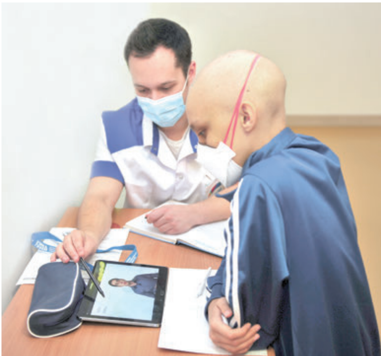
Программа обучения разрабатывается для каждого ребенка индивидуально

рале 2018 года московские педагоги организовали региональные стажировочные сессии в Воронеже и Орле для учителей, работающих с детьми, находящимися на длительном лечении. В рамках региональных сессий