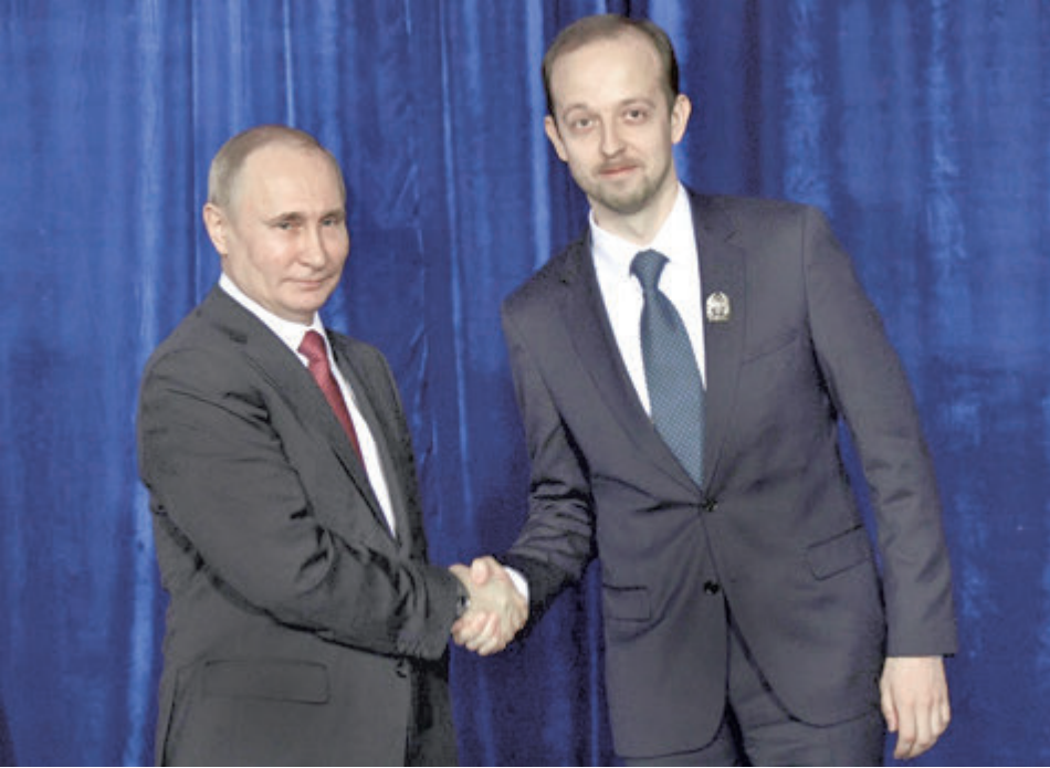
Максим НИКИТИН с Президентом РФ Владимиром ПУТИНЫМ

Кроме этого, исследования и публикация документов дают материалы для работы археологам, искусствоведам, филологам, музейным сотрудникам. Новые данные используются при проведении археологических раскопок, при изучении иконописания, для исследования бытования лексики в различных регионах, для под-