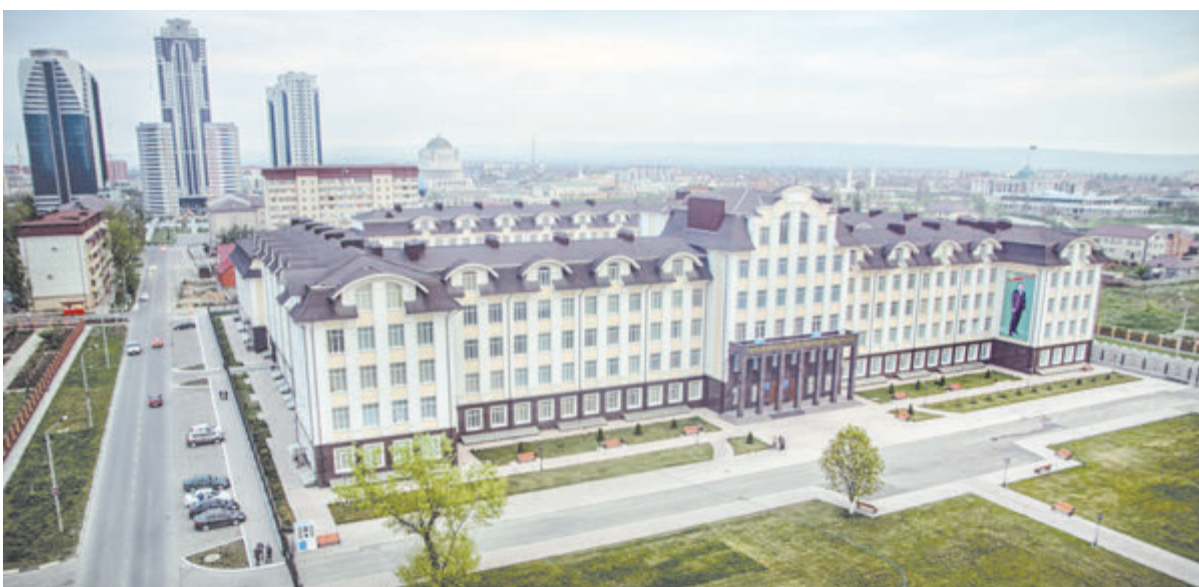
Новый светлый и просторный коридор ЧГУ.

В вузе учатся ребята не только из разных регионов России (Республики Дагестан, Ставропольского края, Липецкой области и т. д.), но и из других стран - Индии, Зимбабве, Таджикистана. Свою роль сегодня играет и тот