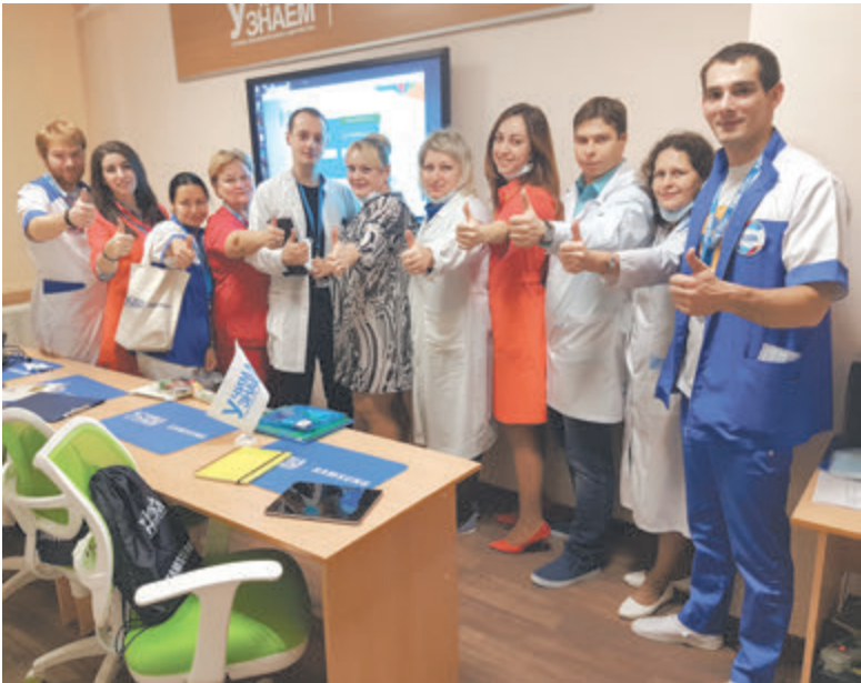
Проект объединил медиков и педагогов

Опыт городского проекта «УчимЗнаем» востребован в регионах. Московский опыт сегодня не только помог создать аналогичные школы в Калининграде и Хабаровске, Воронеже и Орле, Московской и Ленинградской области, Перми и Ростове-на-