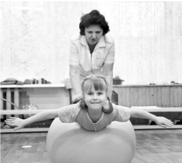
ЛФК - это весело

- К нам приезжают все дети Петрозаводска, часть из них после выпуска поступают в специализированные школы. Наших ребят узнают в школах по успехам. Хорошая подготовка достигается за счет работы специалистов - логопеда, воспитателей, психолога. Семь логопедов, физкультурные и музыкальные работники - это дает результат. Дети уходят подготовленными в школу, каждый, конечно, в силу своих возможностей. А еще с 1995 года совместно с