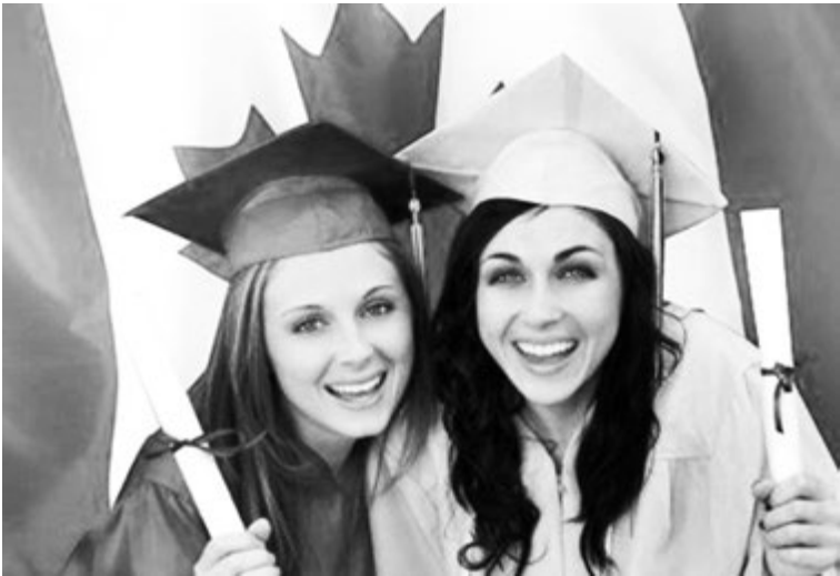
Традиции студенчества уходят корнями в Средневековье

У каждого португальского вуза свой пакет экзаменов. Он может меняться с каждым годом. Нет и общего конкурса абитуриентов. Это, в частности, связано с тем, что Азорские острова и Мадейра, принадлежаше Португалии, отрезаны от материка. Абитуриенты материковой и островной Португалии не в равных условиях. Вступительные экзамены учитывают две составляющие - социальные условия абитуриента и его знания.