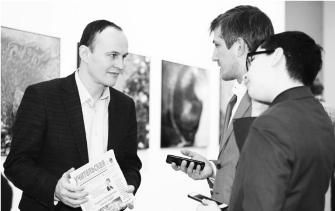
Не каждый день удается вот так запросто пообщаться с настоящим космонавтом

Кстати говоря, даже если какая-то школа пока не вошла в этот проект, любой ребенок может без проблем зайти на наш сайт РДШ.РФ и принять участие в любом проекте, победить в конкурсах, поехать на бесплатные смены в лагерь, пообщаться с другими ребятами.