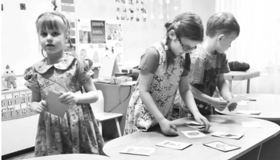
В кабинете логопеда

- Историй много за столько лет работы... Вот, например, на занятиях ЛФК ребенок делает первый, второй шаг. Специалисты тут же бегут ко мне, зовут воспитателей и повторяют: «Он пошел!» Это праздник, конечно! Была история и в нашей избе. Ребенок настолько впечатлился эмоционально, что первое свое слово сказал! Ради такого и работаем. Радости и открытия у нас каждый день, с детьми иначе не бывает! Мечтаю, чтобы меньше было проблем, которые отвлекают меня от интересной работы с родителями, коллективом. Хотелось бы очень, чтобы дети меньше болели, чтобы все на работе шло с удовольствием.