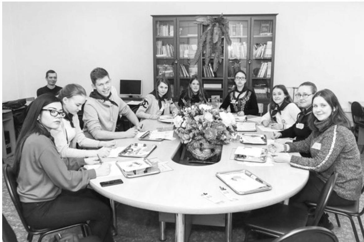
Работа в команде - ключевой фактор успеха