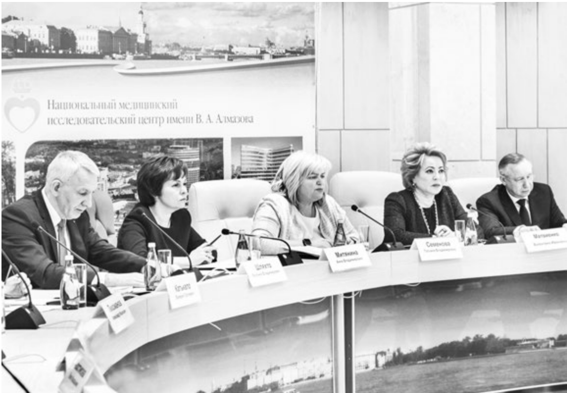
Попечительский совет НМИЦ имени В.А.Алмазова под председательством Валентины МАТВИЕНКО обсудил подготовку медицинских кадров нового поколения

Общественный совет при Рособрнадзоре обсудил возможность привлечения студентов к аккредитации вузов. Речь, в частности, шла о введении практики участия студентов в работе экспертных групп, осуществляющих внешнюю оценку качества образования. Такая практика уже реализуется в ряде стран посредством организаций - участниц Европейского студенческого союза (ESU). На пространстве СНГ наиболее активна в этом направлении Армения. С января 2017 года Росаккредагентством при участии Российского союза молодежи (РСМ) реализуется проект «Формы общественного содействия обучающихся процедурам государственной аккредитации». «В эксперименте приняли участие 9 организаций высшего об-