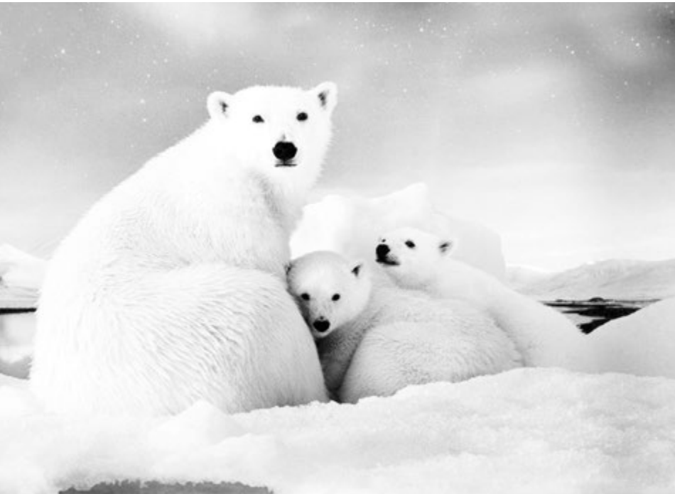
Белые медведи рискуют стать черными из-за аварий на нефтепроводах

До недавнего времени хозяйственная деятельность человека в Арктике строилась по очаговому принципу. То есть поселки и города развивались вокруг промышленного пред-