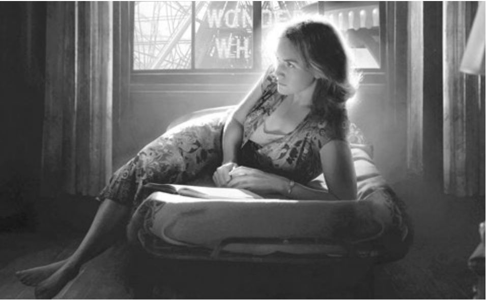
Кейт УИНСЛЕТ в роли официантки, не расставшейся со своей мечтой

Расставшись с иллюзиями и простив своих обидчиков, чета поддерживает умеренный темп существования. Все как у людей.