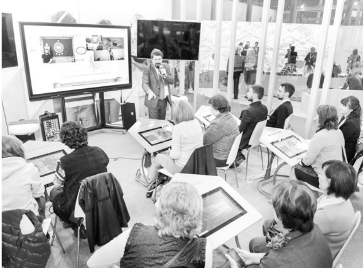
Профессиональный разговор с коллегами