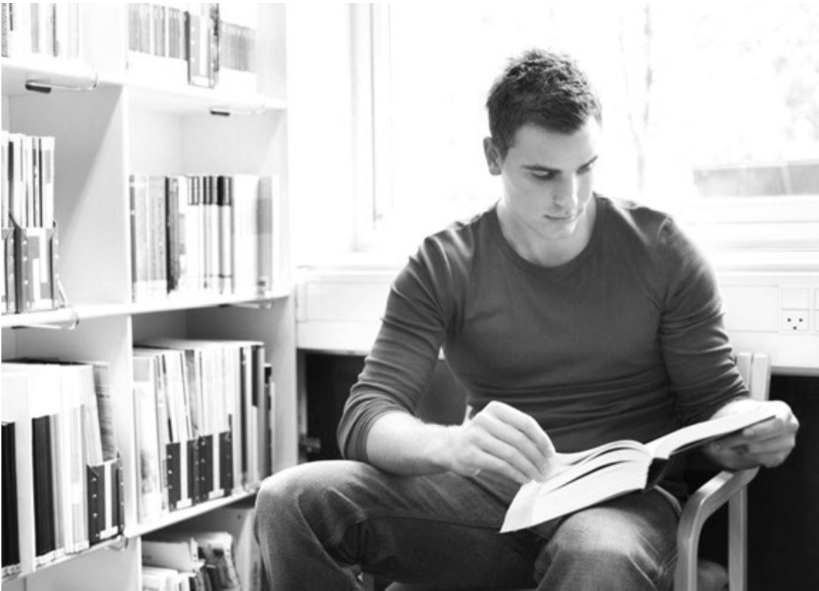
Книгу читаешь, как на крыльях летаешь

с самого рождения мне читали книги, причем самые разные. Со временем я начала интересоваться содержанием всех книг семейной библиотеки, поэтому рано научилась читать и начала изучать содержимое библиотеки. И именно библиотека, как школьная, так и городская, является моим излюбленным местом, где можно спокойно читать.