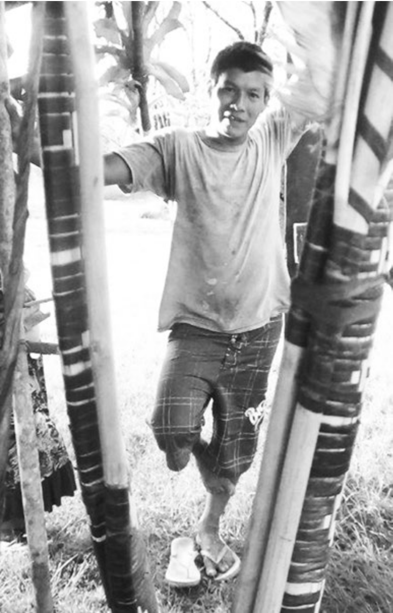
Хозяин небольшого ранчо для туристов