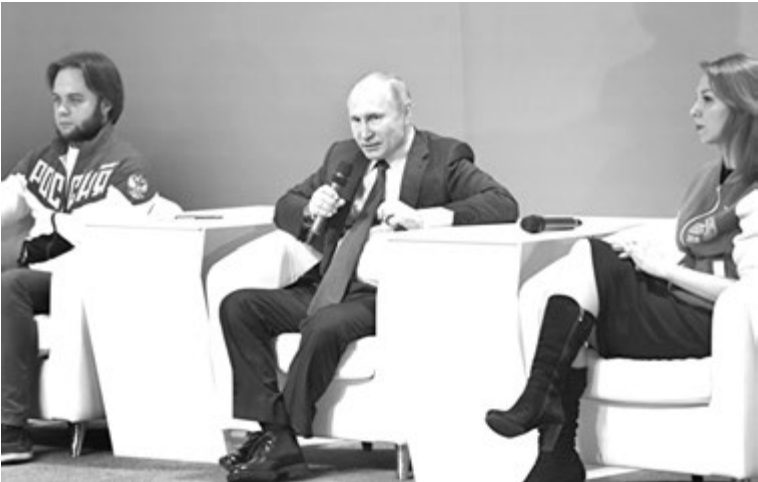
Владимир ПУТИН на Всероссийском форуме рабочей молодежи

Отметим, что в тот же день глава государства побывал на Всероссийском форуме рабочей молодежи в Нижнем Тагиле и в ходе общения с его участниками обещал подумать о принятии федерального закона о наставничестве. «Нужен ли закон? Это