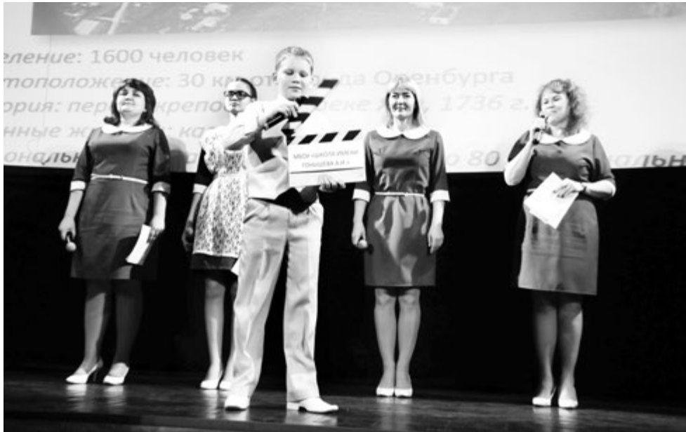
Дважды участники конкурса из Чернореченской школы Оренбургской области в 2017 году стали победителями

Основным принципом формирования Жюри является включение в их составы известных и авторитетных экспертов в области образования. Среди них могут быть лауреаты, призеры и победители всероссийских конкурсов «Учитель года России», «Успешная школа», «Директор школы», «Воспитатель года России» и др., лица, удостоенные почетных званий в сфере образования, руководители образовательных и научных организаций, представители исполнительных и законодательных органов власти, общественных организаций, профессиональных средств массовой информации,