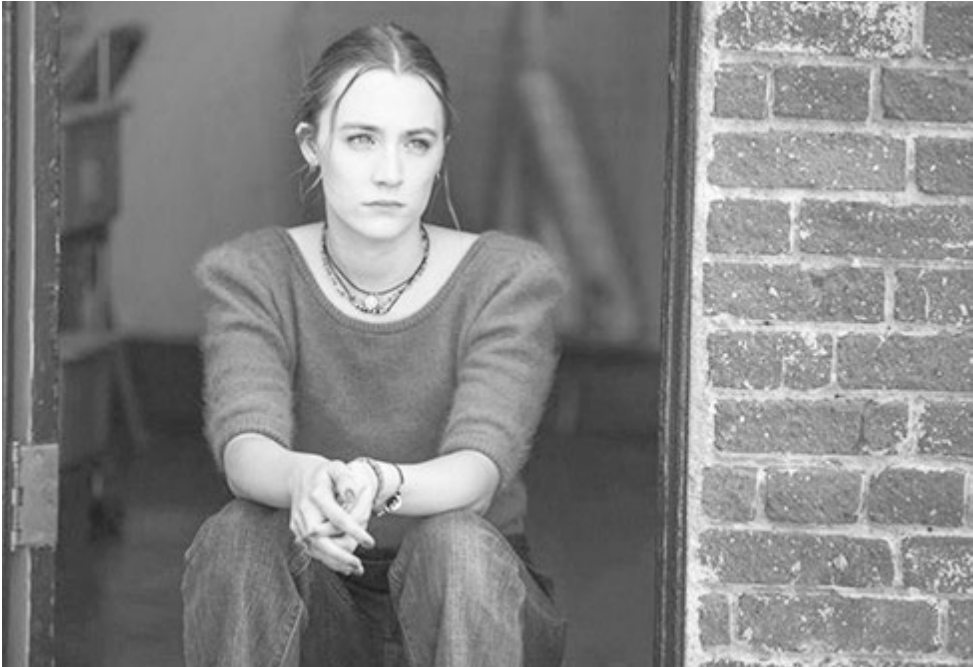
Леди Бёрд - неформал, не сливающийся с пестрой толпой однотипно бунтующих подростков