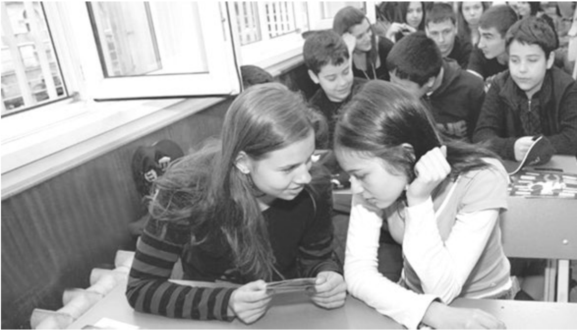
Болгарские ученики и родители довольны начальным и средним образованием

А самым престижным вузом самой Болгарии считается частный