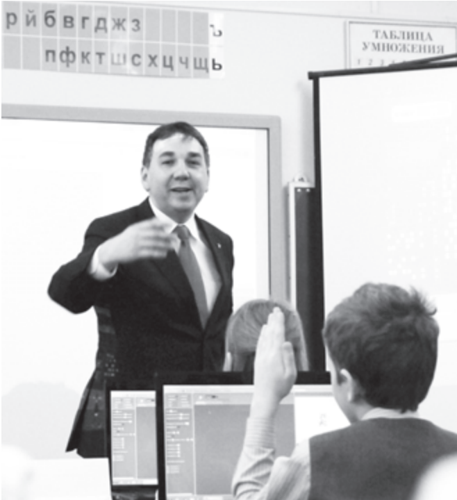
На уроках информатики не обойтись без вдохновения

В школе, где я сейчас работаю, информатика преподается со второго класса, и уроки проводятся в компьютерном классе, и лучший материал для практических занятий находится в Студии Кода 1 . Планы уроков для большинства коллег, конечно, еще нуждаются в переводах, как и уроки без компьютеров, однако, думаю, это то, что ждет наших общих усилий: можно оттачивать свой английский, можно прибегнуть