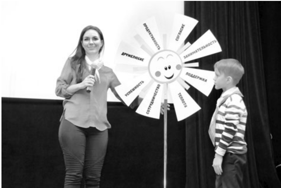
Учитель и ученик школы №2 г. Чебоксары о главном в образовании