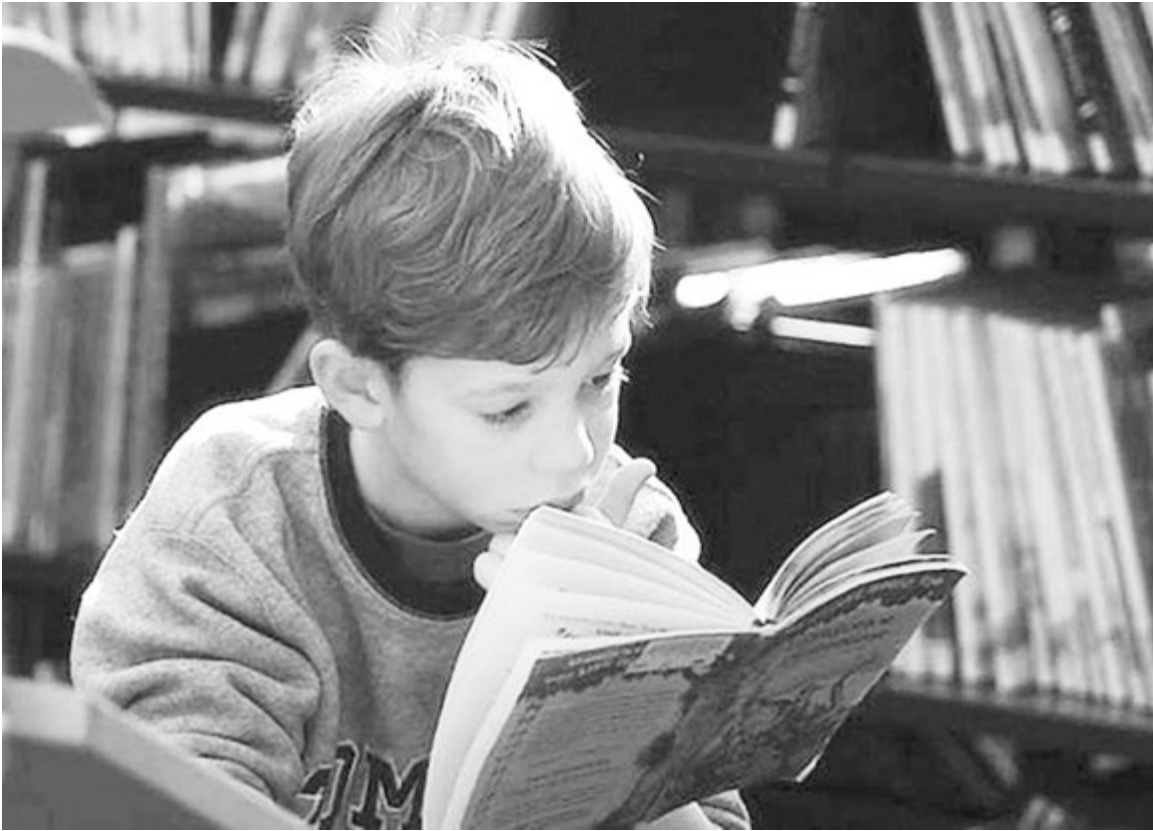
В книге ищи не буквы, а мысли