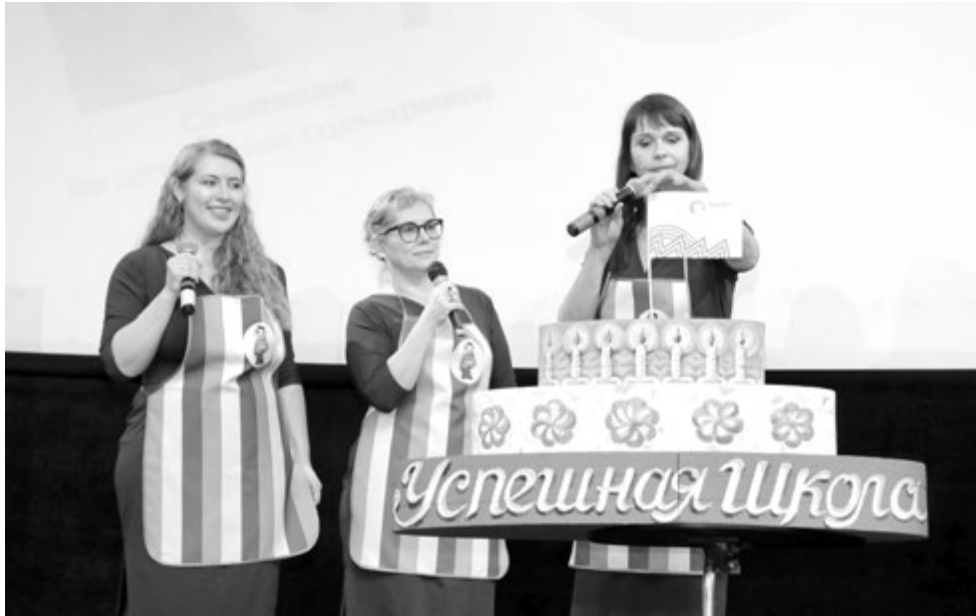
Торт от гимназии №210 «Корифей» из Екатеринбурга

5.4. Решение Оргкомитета Конкурса считается принятым, если за него проголосовало более половины его списочного состава. Решения Оргкомитета Конкурса оформляются протоколом, который подписывается председателем.