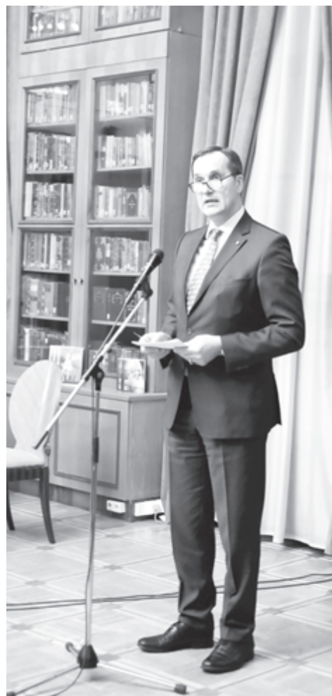
Посол Латвии Марис РИЕКСТИНЬШ

Марис Риекстиньш, чрезвычайный и полномочный посол Латвийской Республики в РФ, подчеркнул, что культурная инициатива происходит в годовщину столетия Латвийской Республики. Он передал библиотеке подборку новых латвийских изданий и вручил символический дар - уникальный альбом «Terra Mariana. 1186-1888», который является ретроспективным повествованием истории Ливонии (нынешняя территория Латвии и Эстонии) на протяжении семи веков, содержащим богатый материал о ливонских дворцах и аристократических родах, - факсимиль-