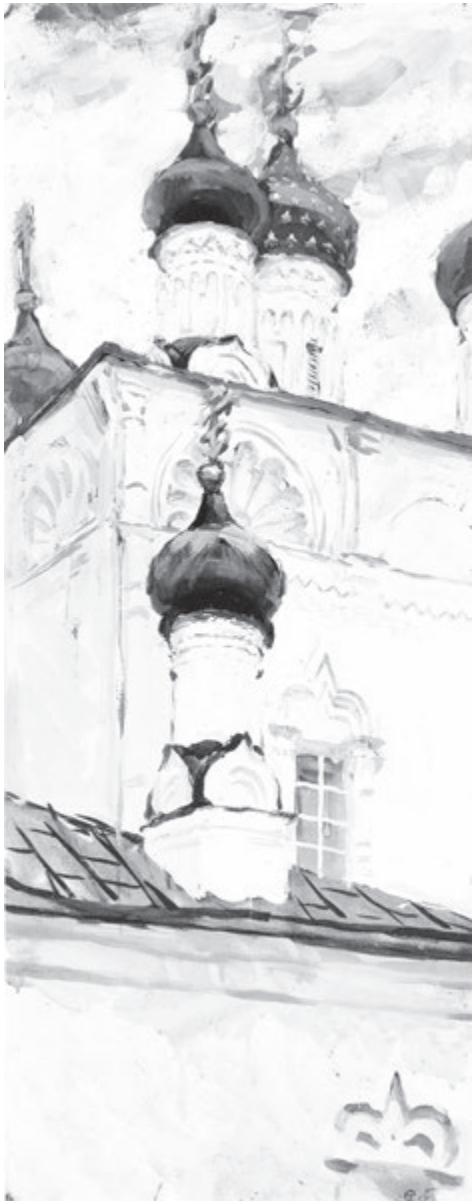
Храм. 1967 г. Акварель

С восторгом и горечью листаю фотоальбом Сергея, выпущенный издательством ВГИКА посмертно. С восторгом - от мастерства, которым дышат его работы, а с горечью - потому