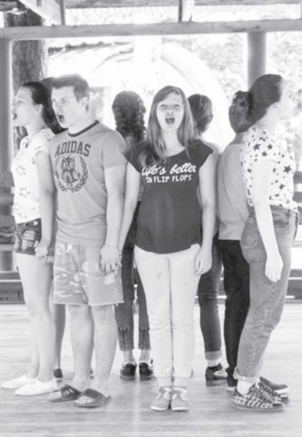
Юные актеры спектакля «Дети детей» на репетиции. Они играют самих себя, и это производит сильное впечатление

Спектакль затронул важные темы: одиночество ребенка в мире взрослых, изоляция инкомыслящего от большинства, непонимание и предательство, в противовес которым выступают дружба, сплоченность, чувство товарищества, вера в собственные силы. Выбор такого материала Юрием Алесиным, конечно, оказался близок и понятен его молодой команде.