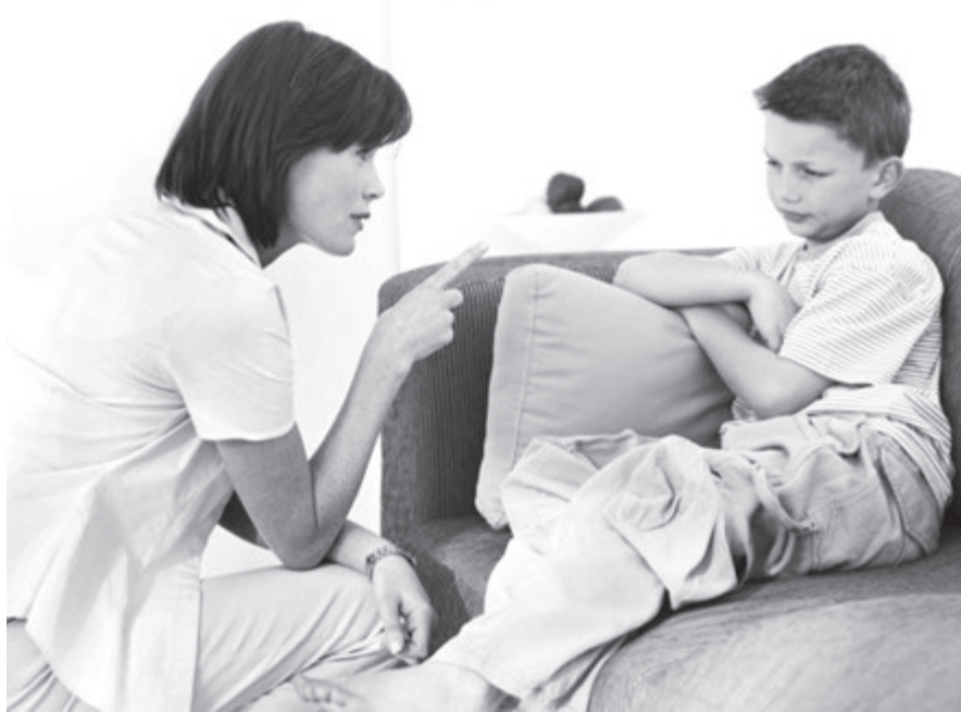
Не читайте ребенку нотации, а договоритесь об ответственности

4. Научите детей проявлять инициативу, это будет способствовать развитию их самостоятельности.