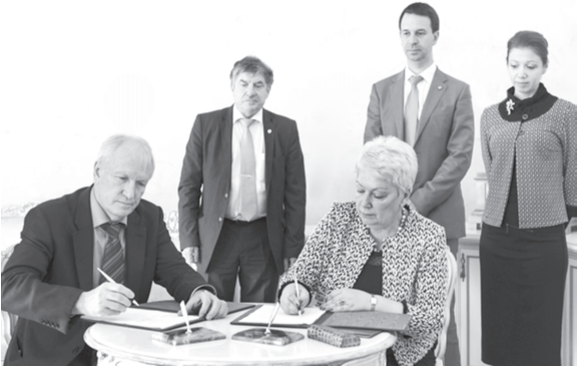
Глава Минобрнауки Ольга ВАСИЛЬЕВА и исполняющий обязанности президента РАН Валерий КОЗЛОВ подписали соглашение о сотрудничестве

На Всероссийском совещании, организованном Рособрнадзором , обсудили итоги кампании ЕГЭ 2017 года и задачи на новый