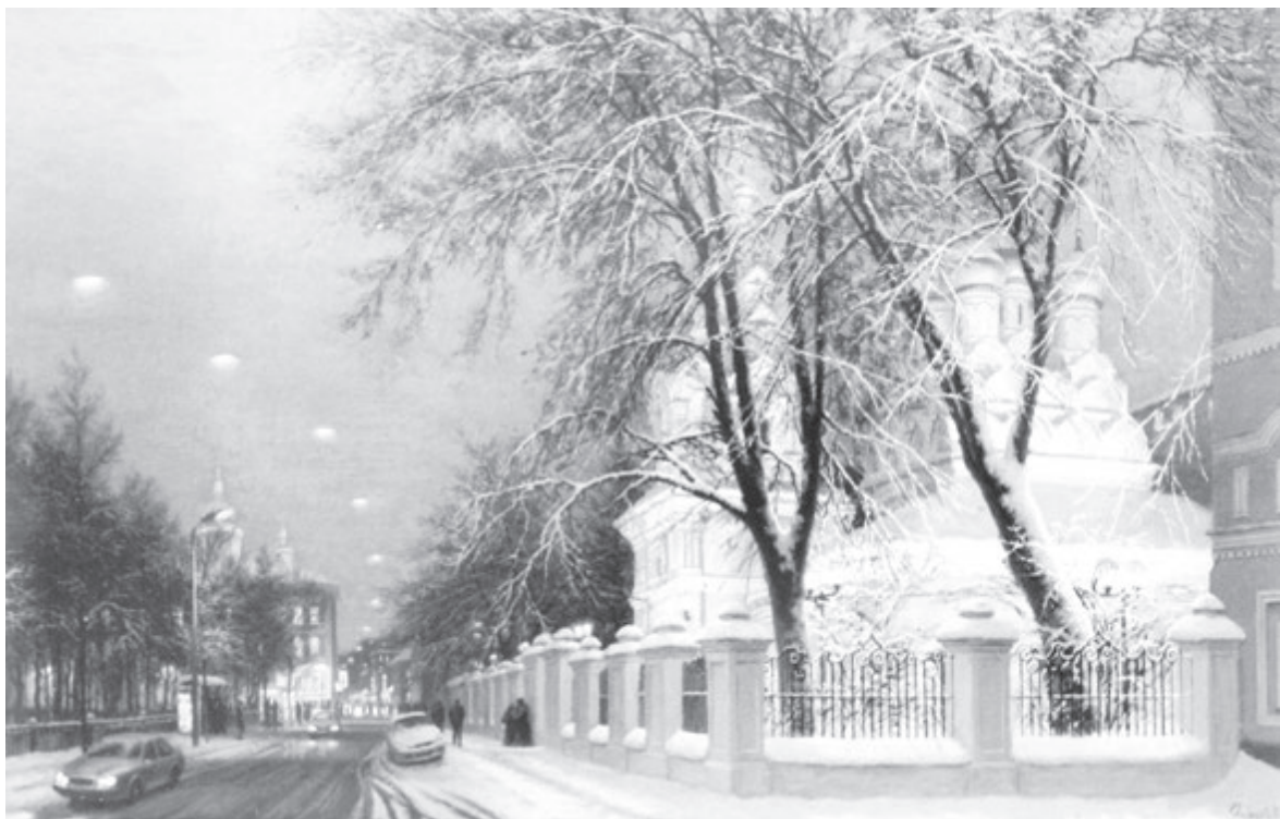
Храм Святого Николая в Пыжах. Холст, масло

...Он погиб в автокатастрофе в 57 лет, в расцвете жизненных сил и творческих планов. Его последняя работа называется «Храм Святого Николая в Пыжах». Четко прорисованный орнамент зимних деревьев, слева мягкий свет ночной московской улицы, а по центру, чуть вправо, торжественно сияет волшебным светом, будто парит, белокаменный храм. Эта работа стала визитной карточкой мастера.