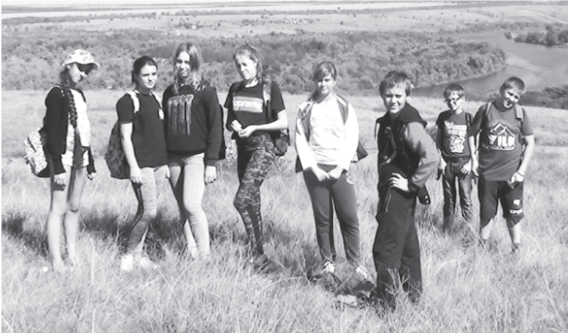
Слеты юных геологов обязательно должны проводиться на природе

Но не везде все так плохо. Есть несколько регионов, где к движению юных геологов относятся со всей серьезностью. Приведем лишь один пример. После того как три тюменские команды не самым блестящим образом выступили у себя на родине в 2015 году, в регионе было создано совещание рабочей группы по развитию детско-юношеского геологического движения в Тюменской области. Вместе собрались представители областного Департамента недропользования и экологии, Департамента образования и науки, Департамента по спорту и