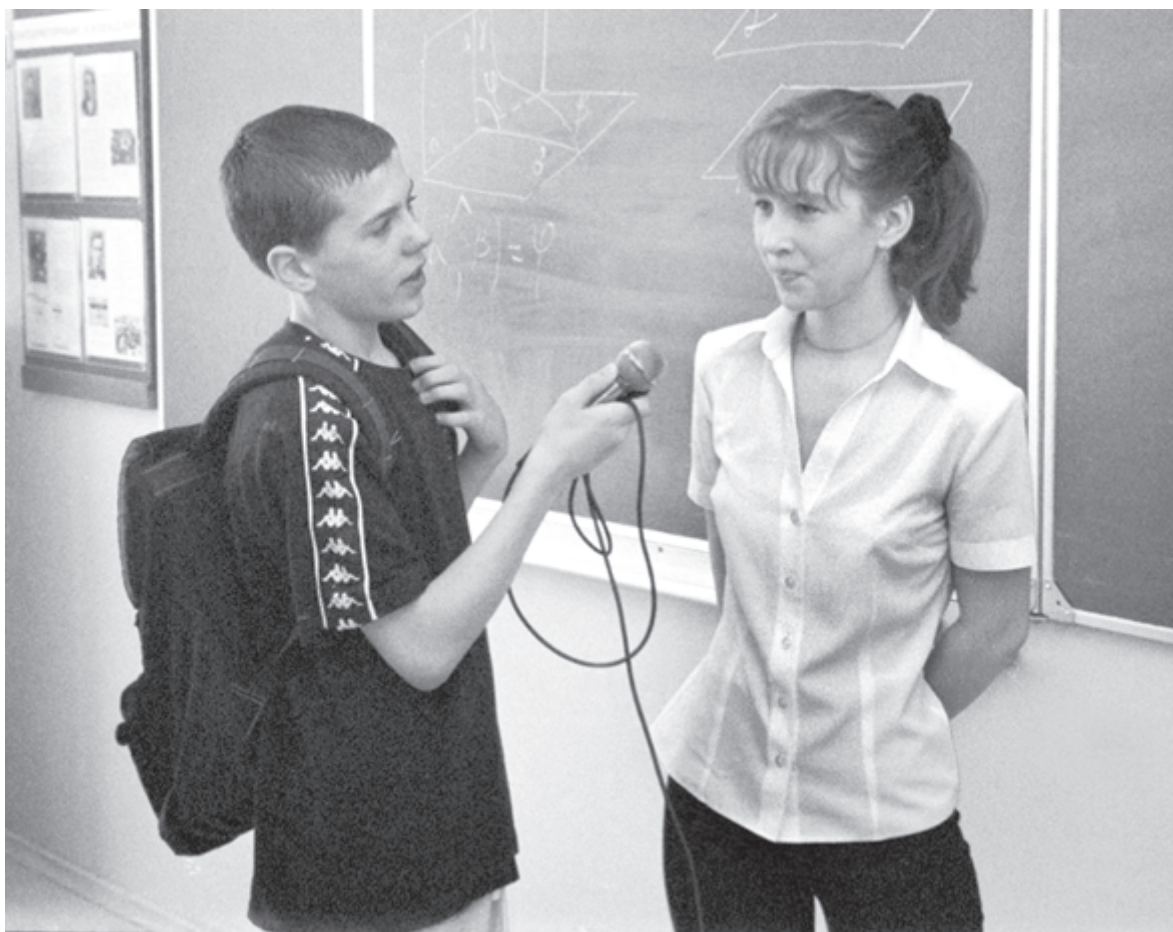
Школьное телевидение - шанс попробовать свои силы во многих профессиональных ролях

По словам директора, в его школе телевидение было организовано по инициативе местных энтузиастов, а аппаратура закуплена на