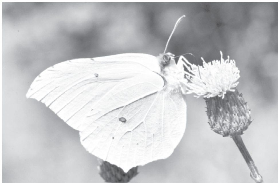
Заставить «позировать» насекомое очень непросто