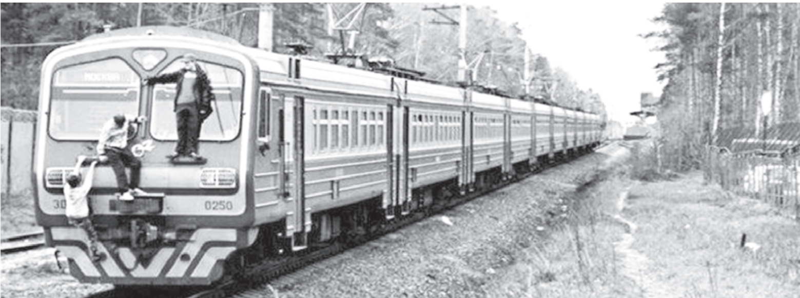
Зацеперство - модное и смертельно опасное развлечение