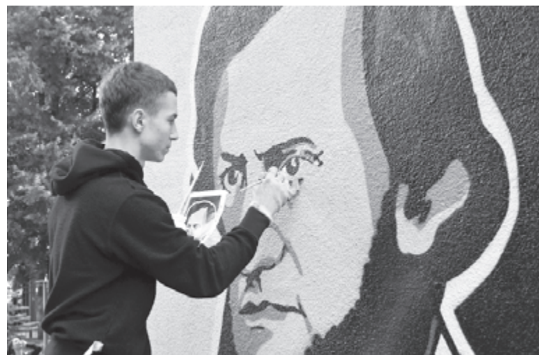
Ушинский смотрит на тебя с укоризной