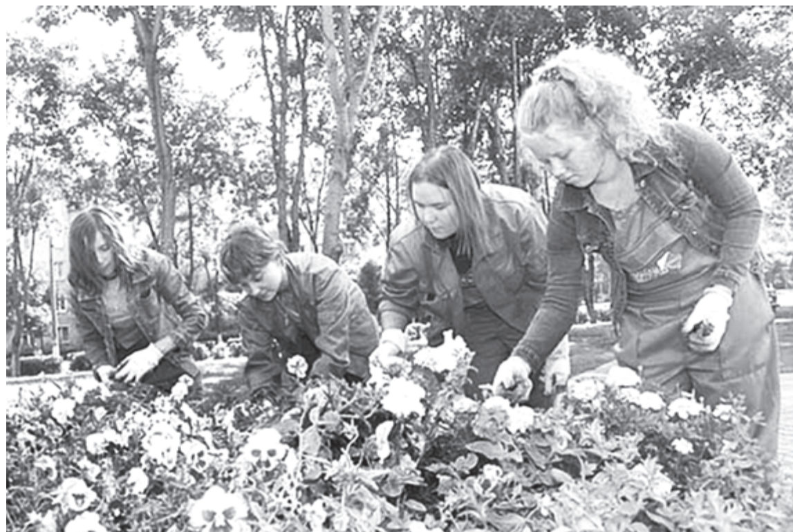
Один из вариантов студенческой подработки - благоустройство территории

Моя семья небогатая, и я стараюсь не садиться на шею родителям и летом всегда нахожу подработку уже с 14 лет. Так как в этом году мне исполнилось 18, вариантов работы стало больше, и я этому рад. Квалификации у меня никакой нет, поэтому этим летом тружусь грузчиком в продуктовом магазине. Заработал уже 25 тысяч рублей. Откладываю понемногу, чтобы в дальнейшем купить дешевую машину и зарабатывать на ней частным извозом.