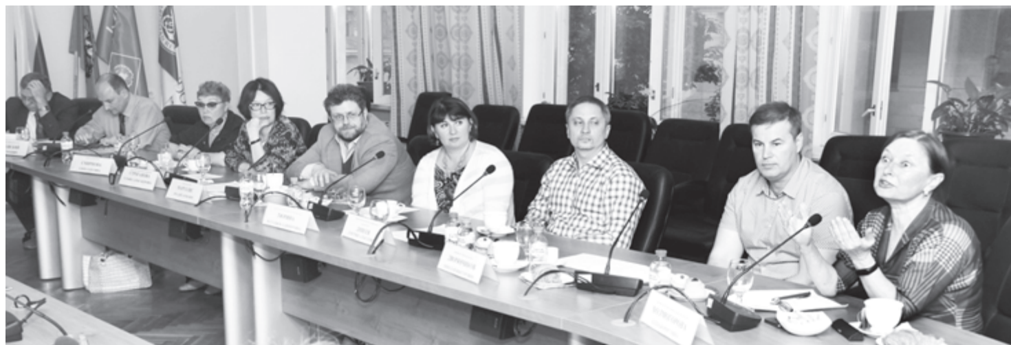
Исследования ученых должны стать достоянием педагогов-практиков