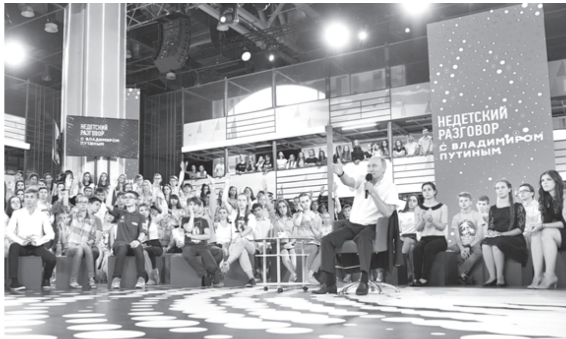
Владимир ПУТИН в «Сириусе»

■ 19 июля Председатель Правительства РФ Дмитрий Медведев провел совещание о расходах федерального бюджета на 2018 год и на плановый период 2019 и 2020 годов в части здравоохранения, образования, культуры и социального обеспечения. Как отметил премьер-министр, средства будут вы-