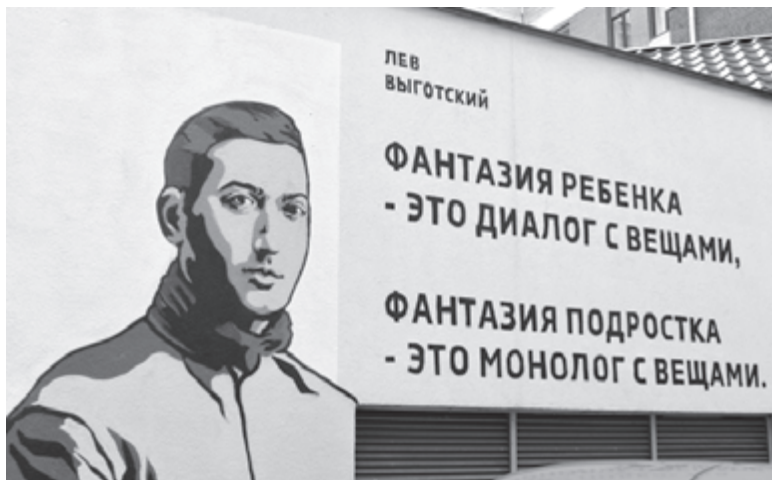
Устами Выготского глаголит истина

они занимались, не знаю. Наверное, внесли большой вклад в развитие нашей страны.