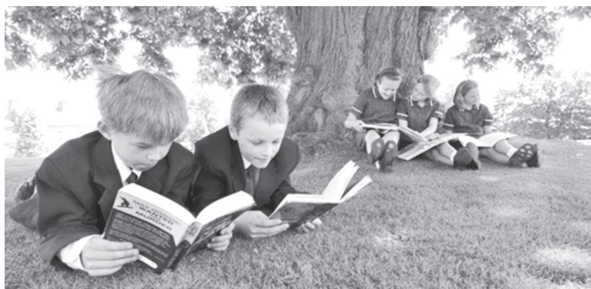
Обучение в португальской школе спокойное и размеренное

Первая ступень, primario , - это с 1-го по 4-й класс. Дальше идет базовый уровень, basica , - с 5-го по 9-й класс. 10-й класс - выпускной, после его окончания выдается сертифи-