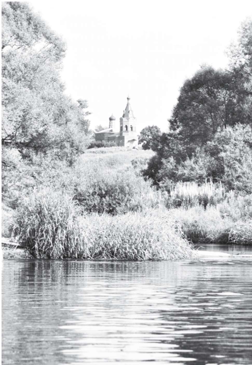
Прелесть статичных объектов в их неподвижности

Лучшие фотографии будут опубликованы в нашей газете и на сайте www.ug.ru . Победителей ждут ценные призы.