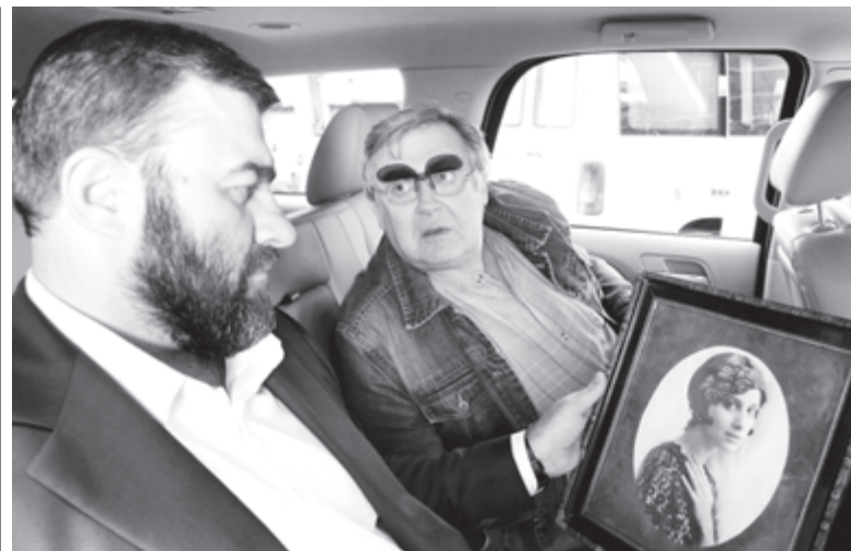
По сюжету Гордин видит фотографию звезды немого кино и... влюбляется

Кстати, что в «Блокбастере» бесспорно хорошо, так это Чиповская в роли Наташи. Актриса виртуозно сыграла эту провинциалочку с хитринкой и характерным говорком, вроде бы такую милую и даже вызывающую жалость и в то же время из тех, кому не стоит протягивать палец - руку по локоть откусит. А с другой стороны, вот парадоксы подобных характеров, иной раз в трудную минуту именно такие люди первыми и протянут руку помощи.