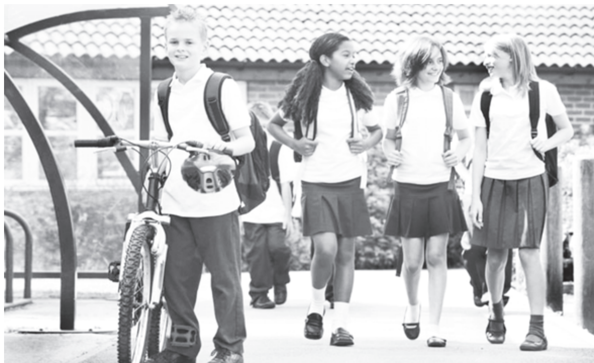
Физкультура здесь больше похожа на отдых и игру

Поэтому вначале в Лиссабоне, а затем и в других крупных городах Португалии - Порту и Коимбре - и возник такой проект, как «Славянская школа», где прожившие от 10 до 15 лет в этой стране преподаватели из России, Украины или Белоруссии обучают русскоязычных детей по учебному плану, состав-