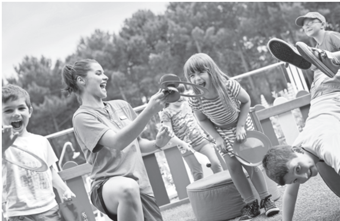
Быть вожатым на летней смене - работа и отдых одновременно!

Для меня каникулы прежде всего отдых, поэтому я сейчас у бабушки в Лисках, это недалеко от Воронежа, хотя учусь и живу в Курске. Сейчас в основном бездельничаю, здорово, что наконец установилась хорошая погода. Ездим с друзьями в лес, на речку с палатками, там рыбалка, шашлык - летние и самые доступные удовольствия. Я стараюсь летом хотя бы месяц оставить только для отдыха, потому что во время учебного года совмещаю учебу и работу. У нас небольшая фирма по ремонту и все вечера с выходными заняты работой. Иногда учебу приходится пропускать, потом наверстываю. Лето, конечно, самая жаркая пора для строительных и ремонтных работ, поэтому в августе я уже буду занят целыми днями, а пока ленюсь!