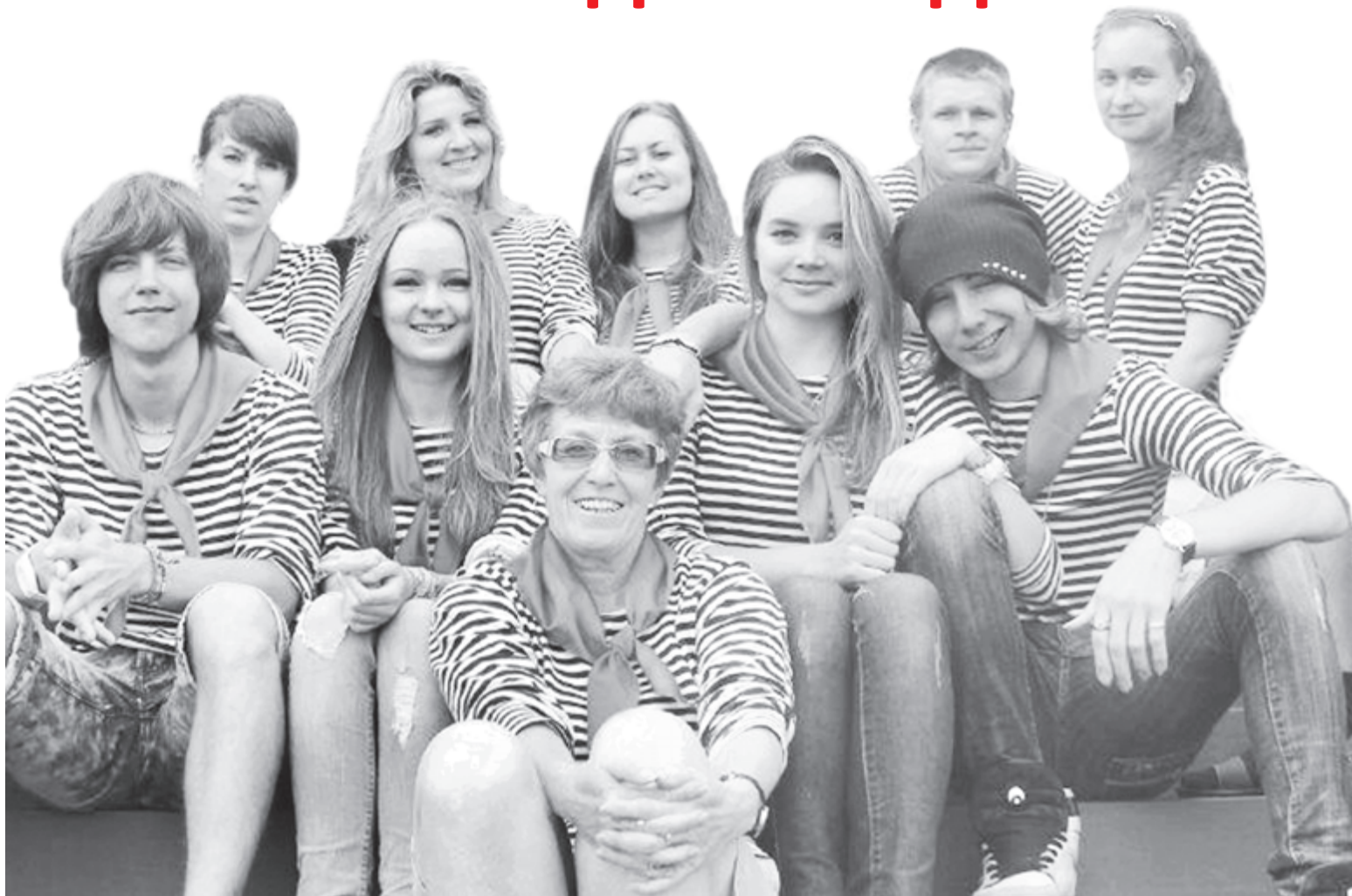
Студенческий педагогический отряд «Территория инициативы» ВГУЭС

Этот вопрос каждый студент решает сам: кто-то может позволить себе отдохнуть, причем не только на дачном участке, а кому-то приходится (или хочется) всерьез поработать - ради денег или профессионального опыта. О том, как рационально и интересно организовать свой досуг в оставшиеся летние дни, - в нашем сегодняшнем «Студсовете»