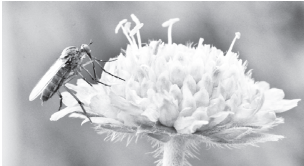
А в это время ветер колышет травы...