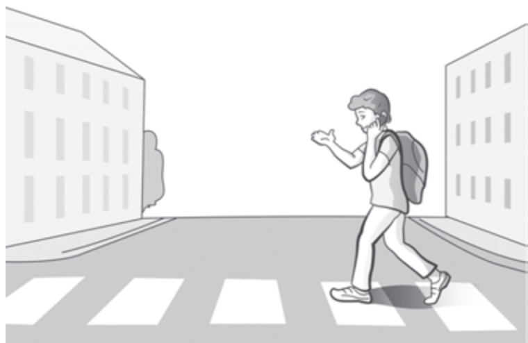
Какие правила безопасности нарушает мальчик?