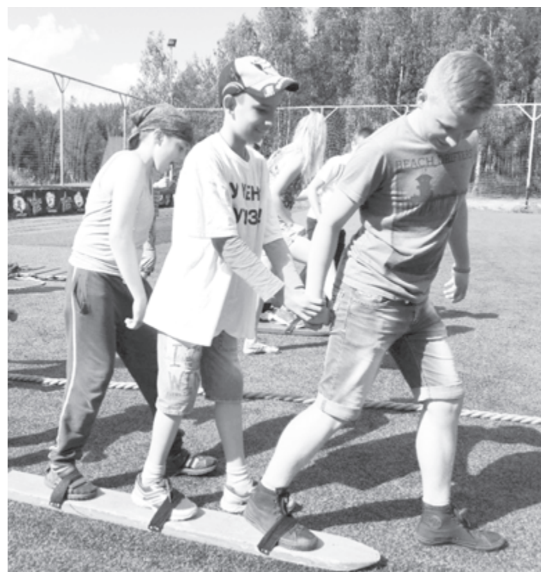
Командная работа - это общение, позитив и развитие

Для родителей была организована своя программа. Ее с полным правом можно назвать образова-