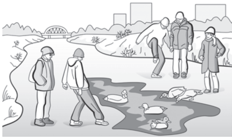
Ради уток дети готовы рисковать жизнью

дителей, называет их имена и предлагает подвезти его до дома. С вариантом «поехать с незнакомцем» согласились всего 0,2%, что хорошо. Однакостораживается то, что вариант «тихо отказывается и пойти своим путем» понравился каждому четвертому из опрошенных, а ведь это потенциально рискованный ответ. Вариант же «вер-