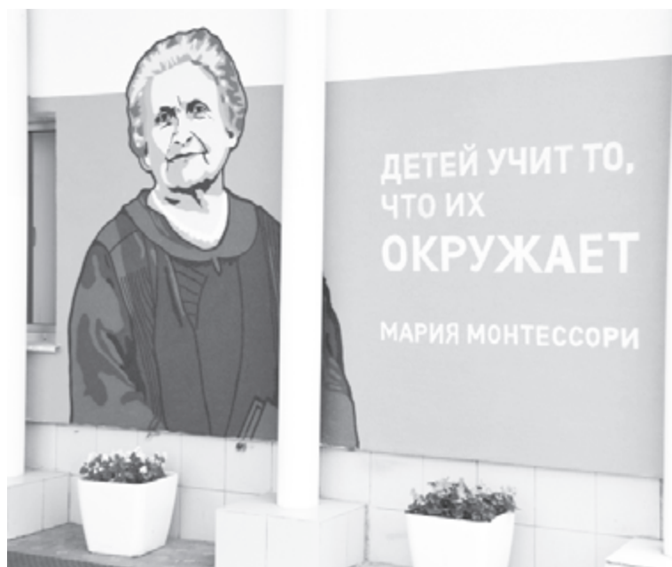
Студентов учат те, кто их окружает

И вот тут еще раз уместно вспомнить о том, кого и для чего должна готовить наша российская система образования. То, что именно умные люди способны сделать государство экономически сильным и богатым, понятно любому дураку. Но эти умные должны не просто владеть знаниями, но и уметь их применять на практике, а главное - хотеть сделать свою страну мощной и процветающей.