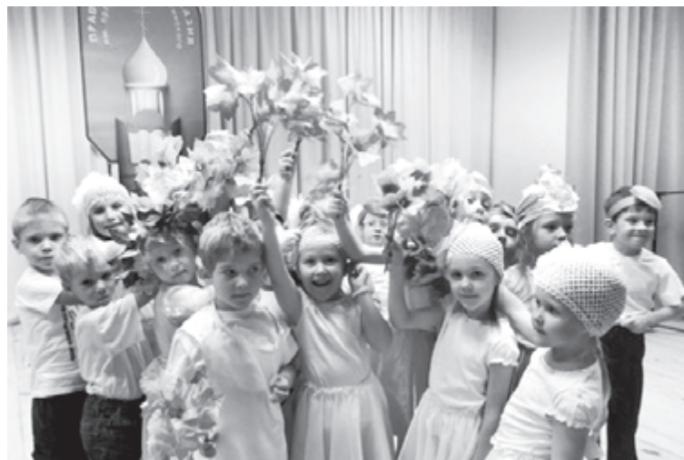
Все воспитанники гимназии - потенциальные артисты

Гимназисты увлекаются спортом, здесь действует школа олимпийского резерва. Гимназия со-