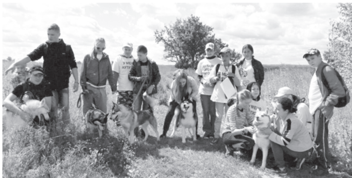
В «Экстримленд» многие ребята приезжают уже третий раз