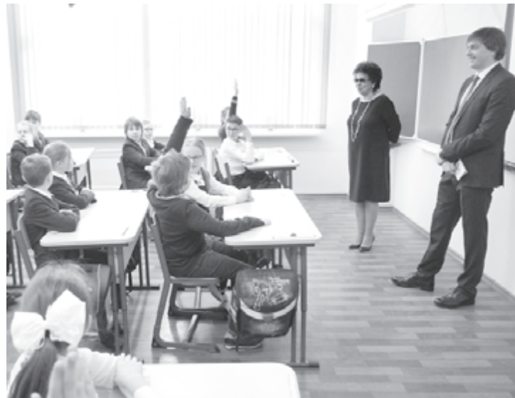
Всероссийские проверочные работы - это совсем не страшно!

т должен быть поддержан и в плане содержания учебных программ и качества преподавания. В рамках проектной работы мы создаем национальную платформу электронного образования с широким интернет-доступом к библиотекам, музеям, выставкам».