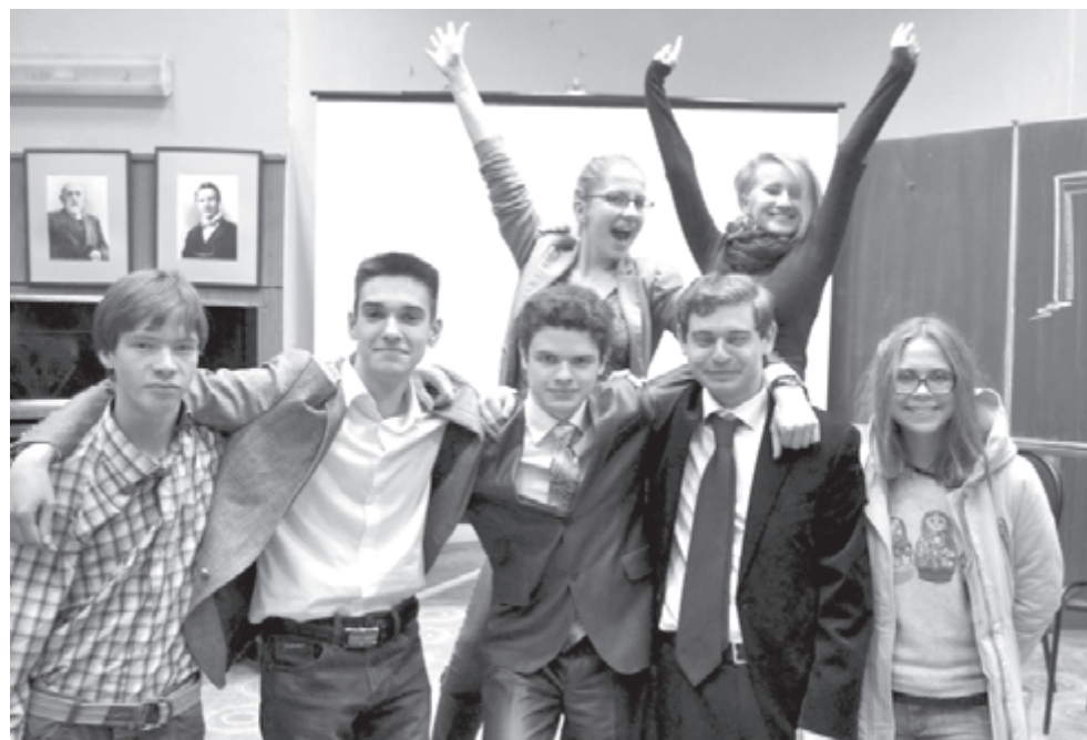
Без оптимизма в педвузе не обойтись!

Всей специфики профессии я еще не уловила, наверное, потому, что у нас еще не было специальных дисциплин, но одно я поняла точно, что учитель - это творец судеб. От его увлеченности работой зависит увлеченность ребенком учебой.