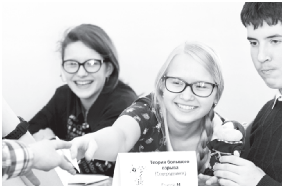
В Поморье юным талантам раздолье

Самые красноречивые подростки съехались на областной конкурс экскурсоводов музеев образовательных организаций. По мнению жюри, достойно проявили себя абсолютно все конкурсанты, но более всего в младшей группе отличились ученицы Лешуконской и Сольвычегодской школ, а в старшей - все призовые места заняли северодвинцы. Если экскурсоводы боролись в «одиночном» состязании, то на областном фестивале интеллектуальных игр «Фестиваль в квадрате» был важен именно командный дух (после эрудированности и сообразительности, разумеется). Его основой являлся турнир по игре «Что? Где? Когда?», в котором одна из архангельских команд сразу вырвалась вперед, а вот состав ближайших конкурентов менялся в каждом туре. В итоге по общему количеству баллов