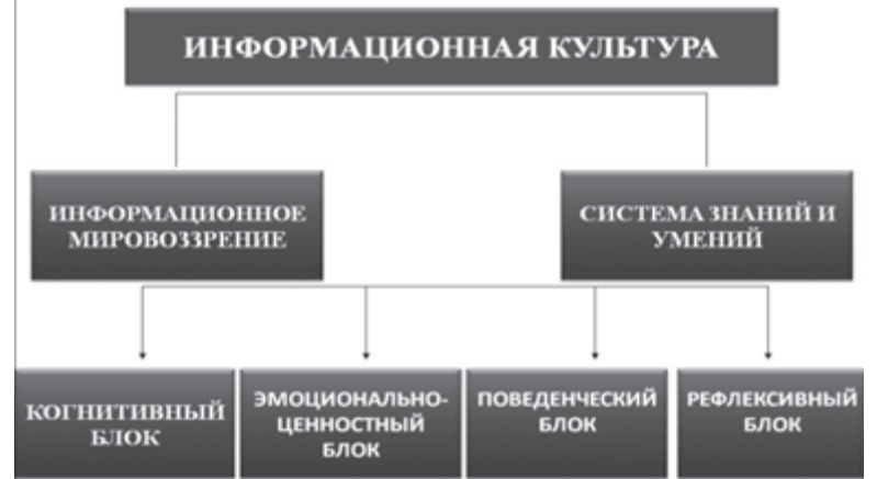
Рис 1. Структура информационной культуры личности

И все же главным в формировании информационной культуры обучающегося я считаю то, что она дает ему возможность стать успешным в современном информационном обществе. Таким образом, такая целенаправленная и системная работа по формированию информационной культуры учащихся на уроках истории и обществознания средствами смешанного обучения позволит воспитать людей, способных быстро адаптироваться и быть готовыми к жизни в современном обществе. Ведь как говорят стартаперы проекта Национальной технологической инициативы: «Если хочешь попасть в завтра, надо целиться в послезавтра, а если целишься в сегодня, попадешь во вчера». Я надеюсь, мои ученики нацелены на преодоление вызовов будущего дня нашей страны.