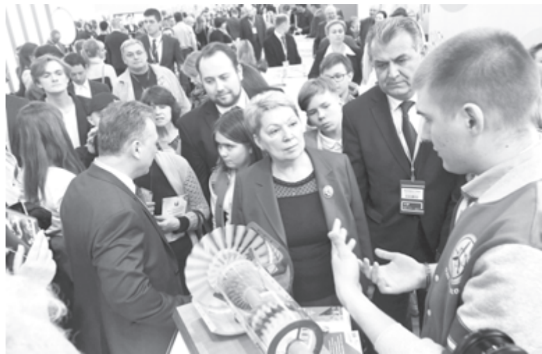
Министр образования и науки Ольга ВАСИЛЬЕВА в гуще событий

Московский международный салон образования как руководство к действию