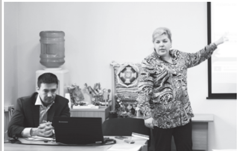
Сетевое взаимодействие всегда основано на принципах демократии

«Потом мы сидели рядом на скамье в коридоре суда, дожидаясь, когда начнется слушание нашего дела. Я тогда спросил у него,