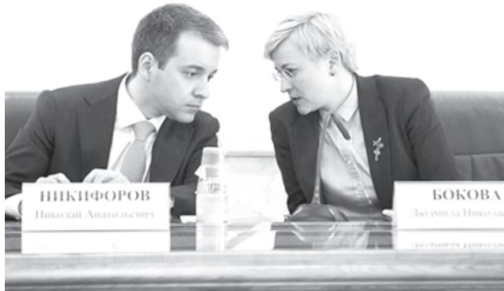
Безопасность в Интернете начинается с реального общения

■ Рособрнадзор дал старт всероссийским проверочным работам, которые в апреле-мае 2017 года напишут более 2,5 миллиона школьников. В 4-х классах ВПР проходят уже в штатном режиме, а в 5-х, 11-х и 10-х классах в рамках апробации - по решению школы. 18 апреля ученики 4-х классов почти 40 тысяч российских школ написали диктант - первую часть ВПР по русскому языку, а 20 апреля выполнили вторую часть работы, состоящую из 12 заданий. В 5-х классах 18 апреля прошла проверочная работа по русскому языку, 20 апреля - по математике. 19 апреля проведена ВПР по географии для учеников 10-х и 11-х классов. Как отмечают в Рособрнадзоре, результаты ВПР могут использоваться для формирования программ развития образования на уровне муниципалитетов, регионов и в целом по стране, для совершенствования методики преподавания предметов в конкретных школах, а также для индивидуальной работы с учащимися. Выставляться отметки за выполнение ВПР не рекомендуется.