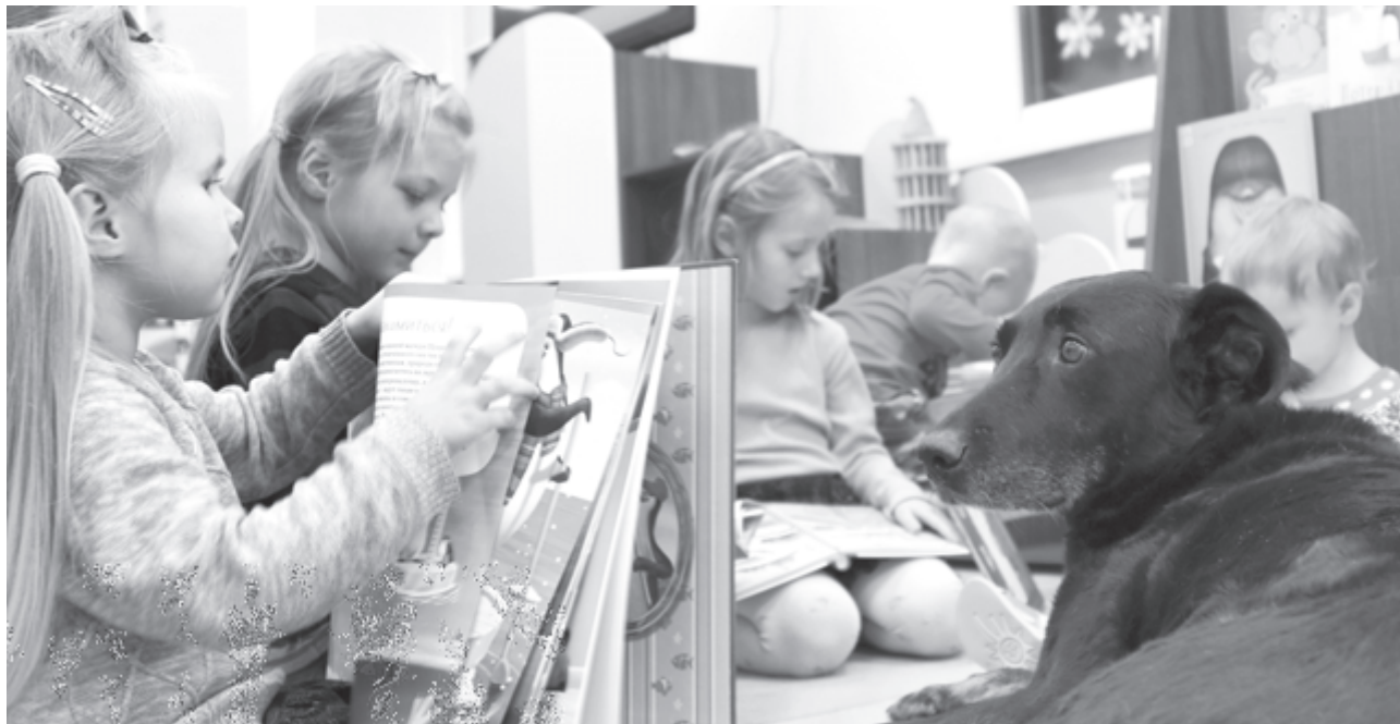
С Найти мечтают читать все, даже малыши