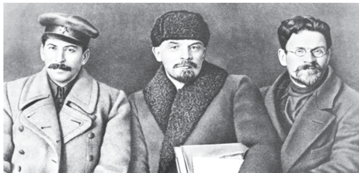
И.В.СТАЛИН, В.И.ЛЕНИН, М.И.КАЛИНИН на VIII съезде РКП(б)

Письма читала Надежда ТУМОВА Пишите, звоните, мы всегда готовы вам помочь! tumova@ug.ru (495) 623-02-85