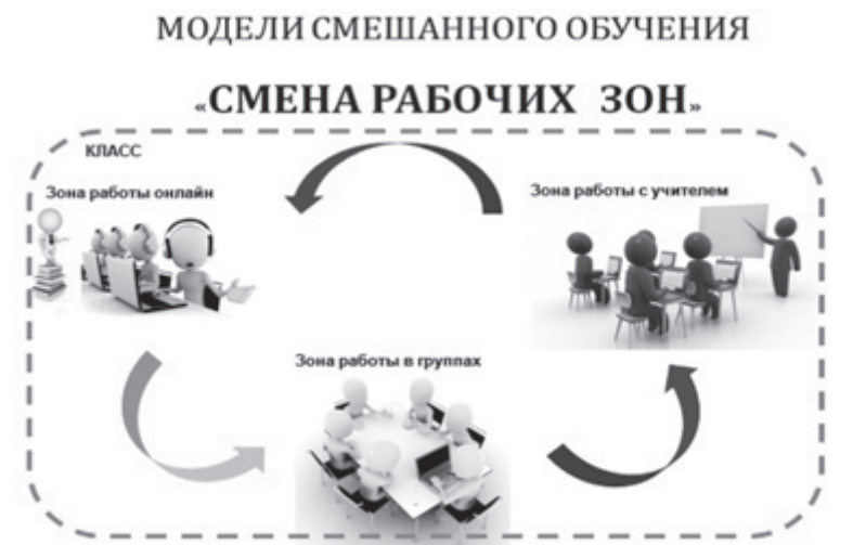
Рис 3. Схема модели «Смена рабочих зон»