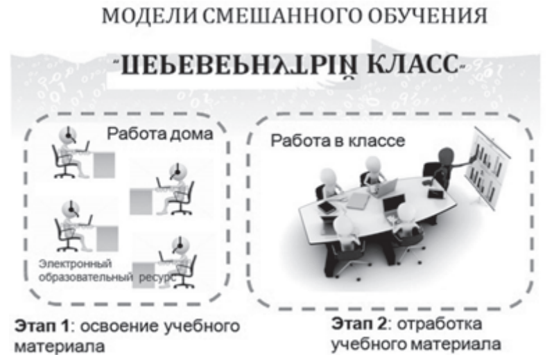
Рис 2. Схема модели «Перевернутый класс»