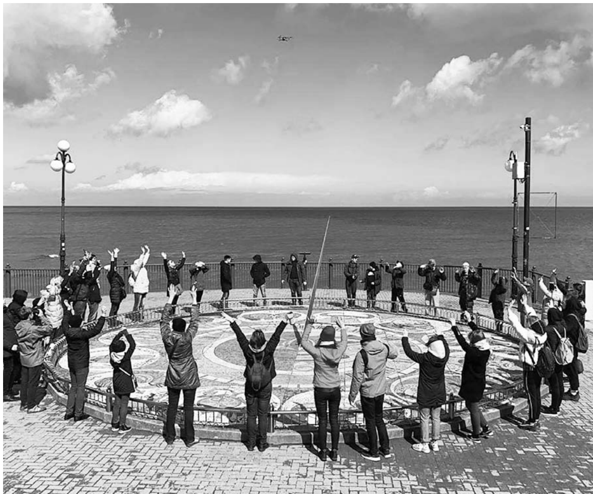
Встанем в круг! В Калининграде много примечательных мест