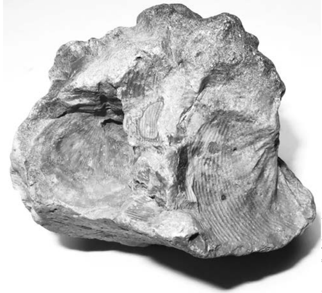
Окаменелая раковина брахиопода

Оказалось, что концентрация кислорода в земной атмосфере в указанную эпоху упала практически до нуля! Такие условия сохранились еще более трех миллионов лет и привели