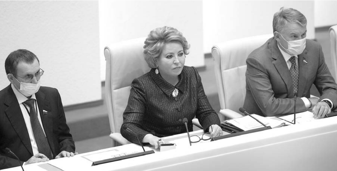
В Совете Федерации обсудили подготовку регионов к организации бесплатного горячего питания учеников начальной школы

- Занимаюсь самостоятельно, сложные темы разбираю с репетитором, хочу набрать максимально возможное количество баллов. Давно решил, что буду врачом, как мама, поэтому для меня очень важно поступить в вуз в этом году. Причем важно на бюджет, чтобы родители не платили за мою учебу. А конкурс всегда очень большой. Из-за эпидемии он не станет мягче, скорее наоборот, потому что медалистов больше, чем обычно. А это конкуренция. Я опасаясь, что меры противоэпидемиологической безопасности, которые будут введены на экзаменах, тоже внесут свои коррективы, что не будет честности и прозрачности. Это меня тревожит. И конечно, есть риск заразиться. У нас пока пик не пройден в регионе. Каждый день более 300 новых подтвержденных случаев - это много. Как будущий врач я понимаю степень опасности.