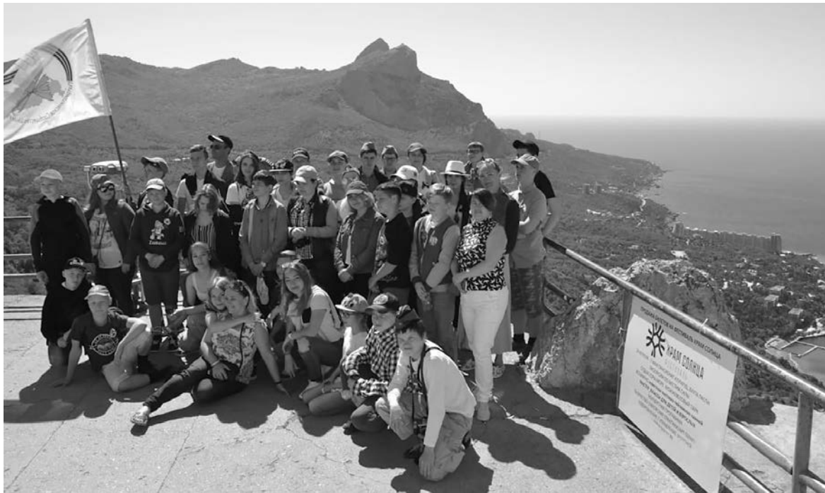
Поездка в Севастополь. Школьники из Мытищ путешествуют всегда со своим флагом

— Работа нашего сообщества строится по простой схеме. Сначала вместе с детьми и их родителями мы решаем, в какой город нам поехать. После начинаем искать в этом городе школу, которая готова принять нас. При подготовке детей к посещению города проводятся тематические классные часы. Ребята узнают имена и биографии детей-героев, воинов-героев тех мест, получают представление о технике советских войск и вермахта, о работе медицинских сестер и так далее. Главное на этом этапе — заинтересовать детей. И это нам