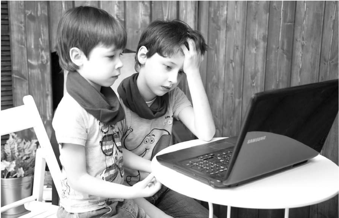
Нужно сохранить психоэмоциональное состояние детей, минимизировав требования к процессу обучения