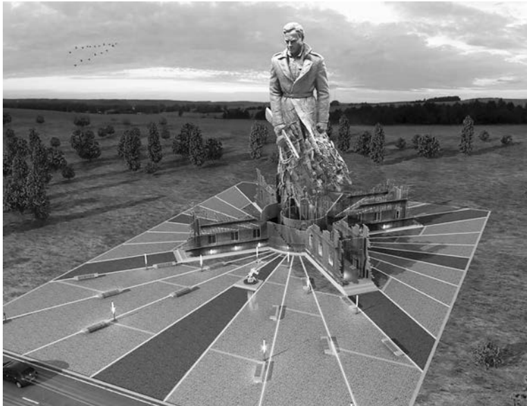
Работая над монументом, скульптор думал о своем дедушке, пропавшем без вести