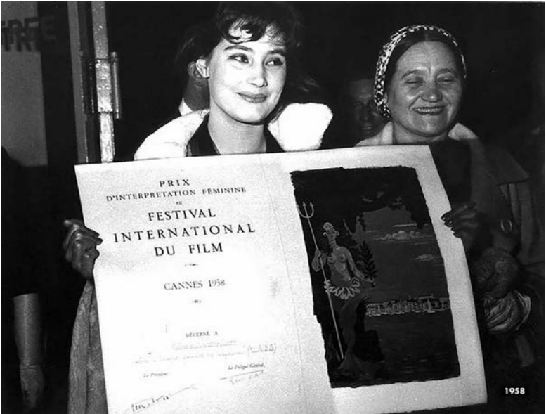
18 мая 1958 года фильм «Летят журавли» завоевал высшую награду Международного Каннского кинофестиваля

Несмотря на то что Великая Отечественная война часто становится разменной монетой политиков всех мастей - от коммунистов до националистов, пытающихся приписать Победе советского народа то, что они хотят приписать, не оскудевают доброта и душевность лучших фильмов о самой страшной бойне XX века. Да, именно душевность, пожалуй, главное, что можно сказать о золотом кинофонде военной летописи. Она даже не военная, а человеческая, искренняя, настоящая. Выбор тут велик. Настоящий обзор фильмов, о которых важно вспомнить представителям любых поколений, конечно, неполный, но характерный.