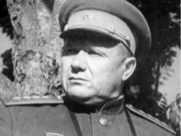
Крестьянский сын по рождению и полководец по призванию Андрей ЕРЕМЕНКО