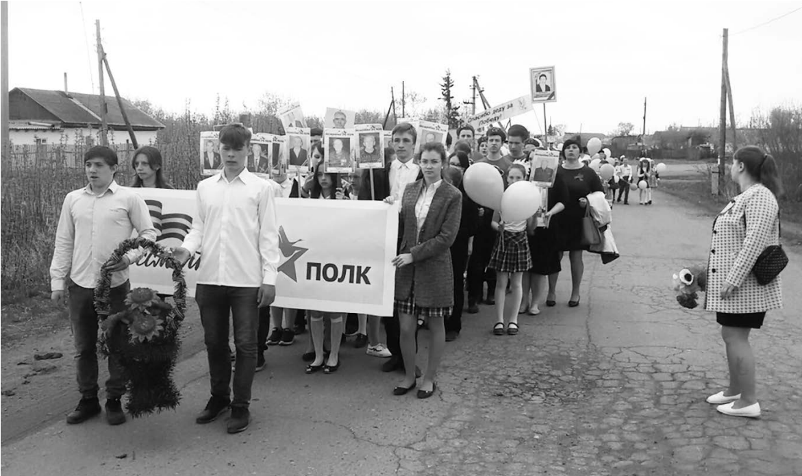
Надеемся, что и в этом году по улицам села пройдет Бессмертный полк

Волонтерский отряд «Феникс» существовал в Пристанской школе с незапамятных времен. Правда, несколько лет практически бездействовал - заниматься им было неко-