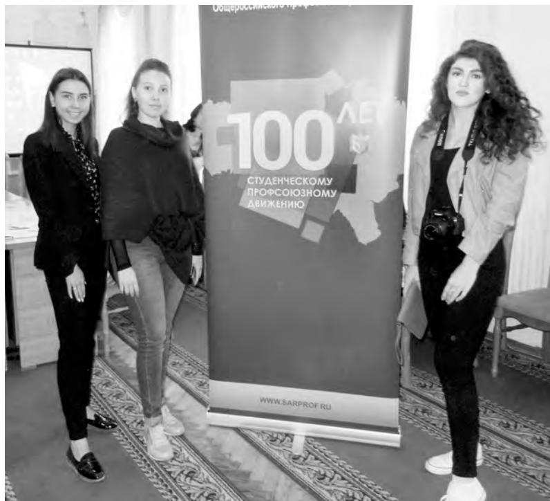
Летописцы студенческих профорганизаций