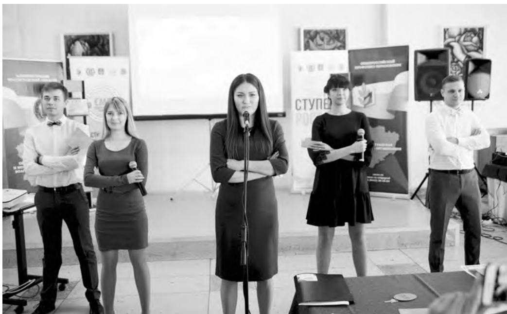
Творческий отчет СМП

IV форум молодых профактивистов прошел в Волгоградской области