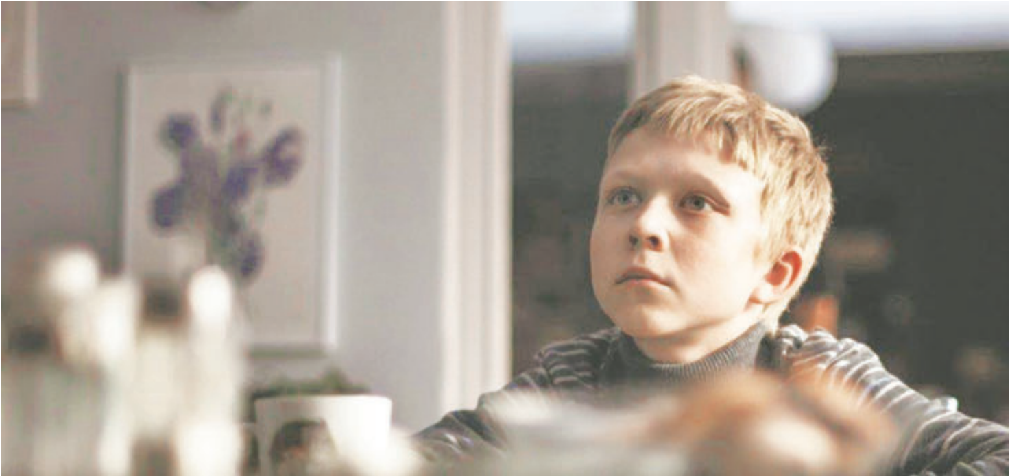
Кадр из фильма Андрея Звягинцева «Нелюбовь»