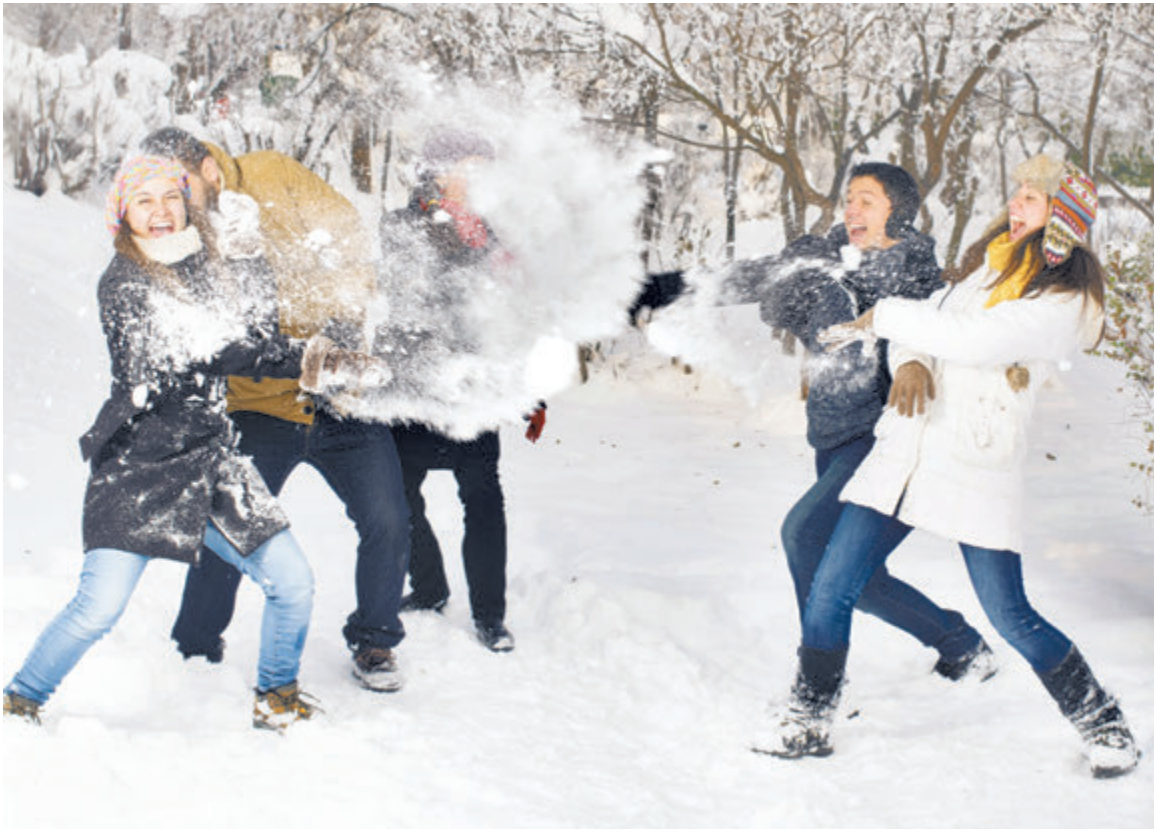
В зимнем круговороте весело и радостно

Я так рада, что мы с моим молодым человеком будем жить отдельно, но рядом с его семьей! Его близкие просто чудесные: папа, мачеха, сводная и единокровная сестренки. Со сводной я пока не знакома, но, судя по его рассказам, это очень милая девочка тринадцати лет. Мы долго ломали голову, что ей подарить, сошлись на единорожьих тапочках и футболках с ее любимыми музыкальными группами. Я вообще плохо помню, каково быть девочкой-подростком... вот и хорошо. Отцу с женой мы решили подарить электрический штопор для бутылок вина. Надеюсь, им это пригодится. А младшей сестренке мы пока только выбираем подарок. Ей полтора года,