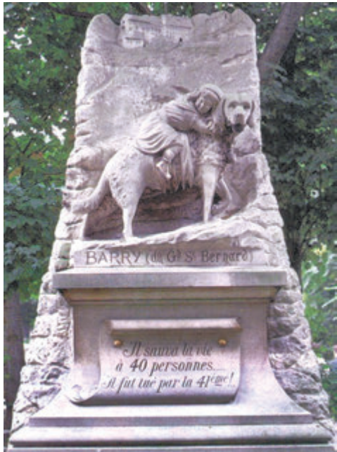
Памятник сенбернару Барри

В 1925 году в городе Ном на Аляске разразилась эпидемия дифтерии. Нужную сыворотку из города Ненана, находившегося в 1000 км от Номы, доставляли на собачьих упряжках. Свирепствовала вьюга. На последнем этапе