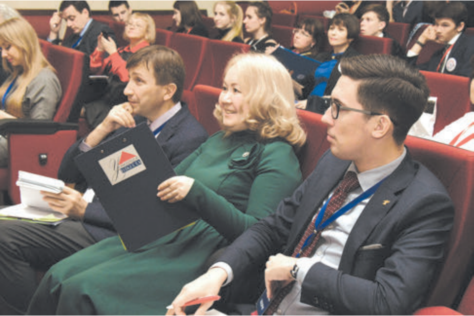
Члены жюри конкурса «Успешная школа»