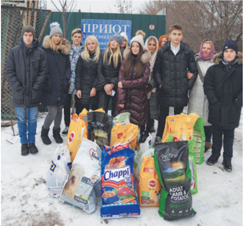
Ученики Ломоносовской школы привезли подарки

держат в трудный час, не останутся безучастны к чужой беде и выполнят свое обещание. А еще они большие мечтатели и идеалисты. А мечты, как известно, двигают прогресс! Мечтай-