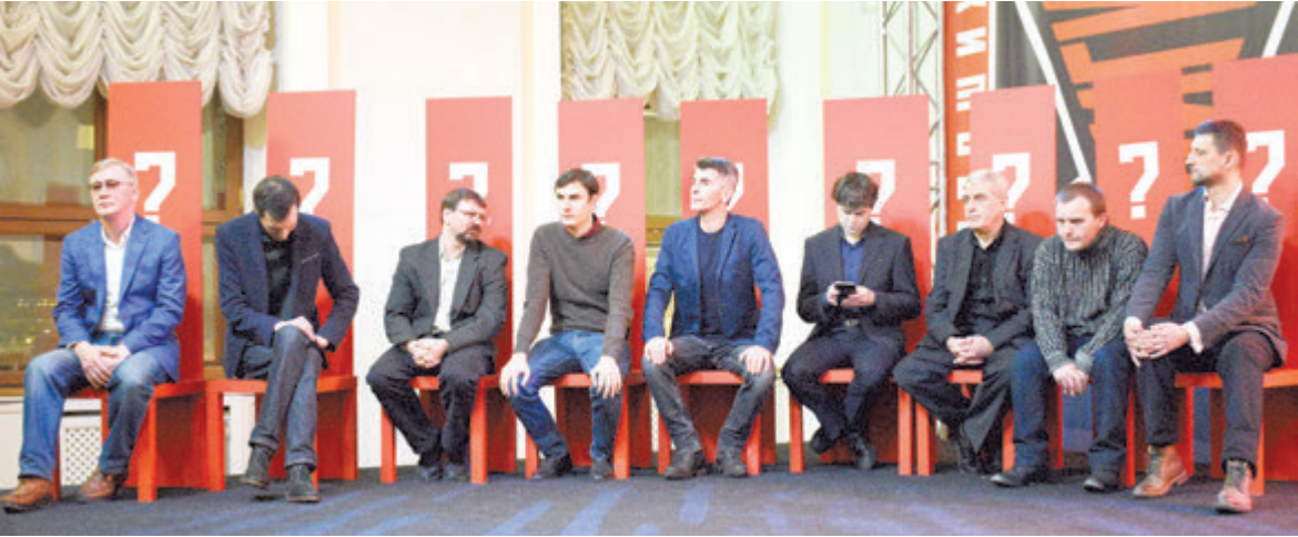
Страна должна знать своих писателей в лицо