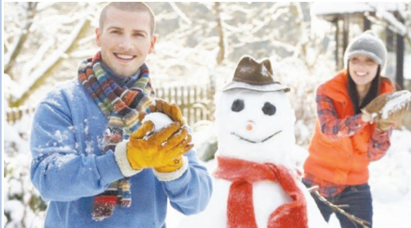
«Мы снежную бабу слепили на славу. На славу, на славу, себе на забаву...» (Александр Бродский)

их услугам, но пока никто до конца не поделился с планами на вечер. В любом случае Новый год встречать мы будем дважды, как это всегда бывает в Самаре. Первый раз по самарскому времени - загадаем желание дома, а потом пойдем веселиться на центральную площадь, где, как всегда, будут катать на санях с оленями, устроят бесплатное массовое катание на коньках и запустят фейерверки. Вообще в самарских праздниках есть что-то, напоминающее народные гулянья. Зима дома всегда снежная, поэтому на площади будут огромные горки и шоу света и ледяных скульптур. Наверное, в этом году для меня главное - это встретить 2018 год дома. У нас нет плана напиться или потусоваться, просто хочется тепла, радости и безграничного уюта, а еще, как это всегда было раньше, растолкать младшего брата утром первого и побежать к елке смотреть подарки. Хотя мы уже взрослые, традицию класть подарки под елку, а не просто вручать друг другу мы всегда соблюдаем.