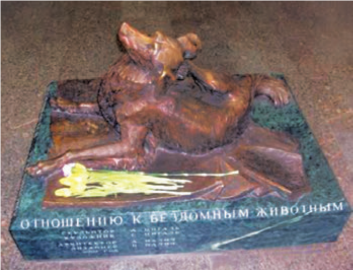
Памятник «Сочувствие» в московском метро

ко и радостно лаял, но машина мчалась мимо, не останавливаясь. Горожане приносили Костику еду, пытались построить конуру, но пес предпочитал отдыхать, лежа на земле, чтобы видеть дорогу с машинами. Верный ждал своего хозяина семь лет. Теперь он живая легенда города. Пса не стало в 2002 году. Это была скорбная весть для тольяттинцев. Общественность города выступила с инициативой поставить у дороги памятник преданности. Деньги собирали всем миром. Скульптура овчарки высотой чуть бо-