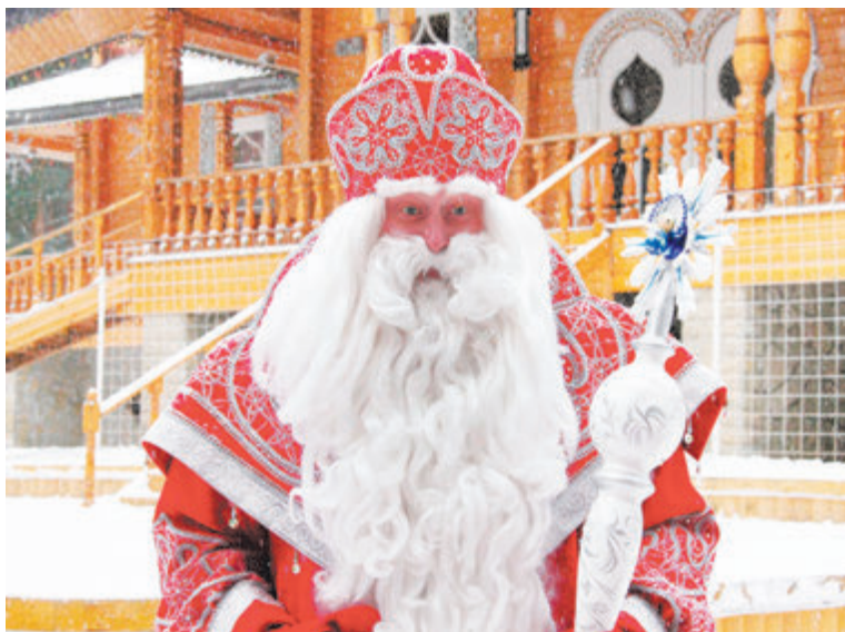
Великий Устюг: Дед Мороз в своей резиденции

Микулаш по приглашению заходит в дома, где есть маленькие дети, и, следуя записям в книге хороших и плохих поступков, дарит детям подарки - конфеты, орешки, фрукты или же уголь с картошкой. Уголь носит в большом мешке Черт, сопровождающий Микулаша. Он грозно потрясает своей железной цепью или хвостом, пугая непослушных малышей. Святого сопровождает и Ангел, заступающийся за детишек. Раньше в микулашском шествии участвовало гораздо больше персонажей: Трубочист, Крестьянин с Крестьянкой, гусары и даже Смерть, но со временем остались только Черт и Ангел.