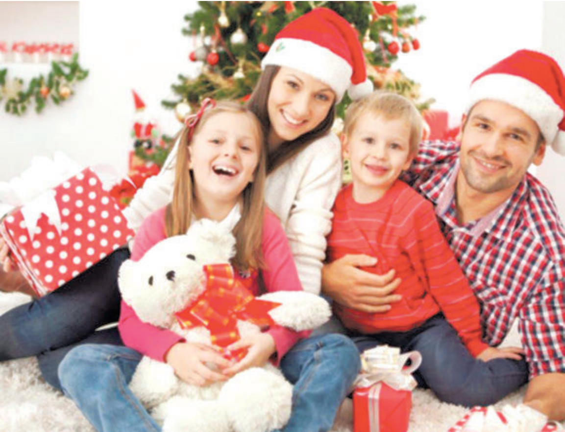
Семья вместе - душа на месте

Кроме того, Желтая Собака терпеть не может резкие запахи, поэтому не вздумайте в качестве подарка предлагать парфюмерию и духи. Если хозяйке года аромат придется не по вкусу, то она очень разозлится. Поэтому не будите в Желтой Собаке волка, иначе вам и вашему окружению не поздоровится. Помните, главные принципы в общении с животными - терпение и ласка.