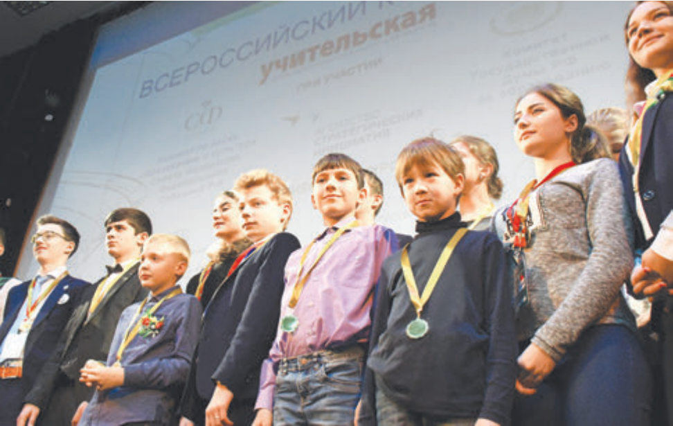
Успешные ученики успешных школ