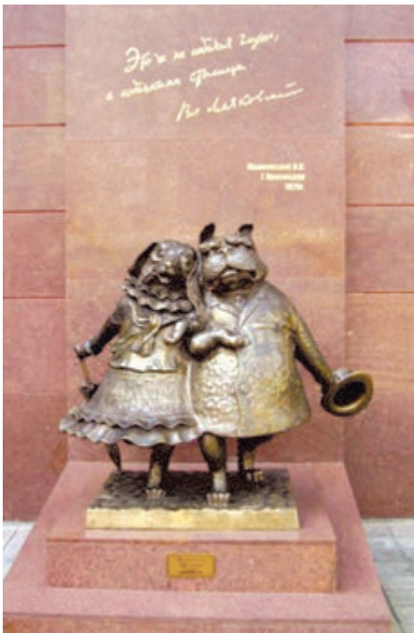
Памятник влюбленным собакам