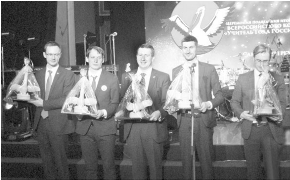
Обаятельной мужской пятерке призеров достались дружные аплодисменты

Наталья АЛЕКСЮТИНА, Лора ЗУЕВА, Михаил КУЗМИНСКИЙ (фото)