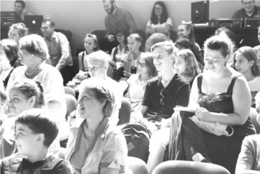
На «Творческом полднике» интересно детям и взрослым

тям. Например, можно жонглировать спрятанными до поры в холодильнике яйцами, сырыми или вареными, до тех пор, пока... из них не вылупятся соловьи-свистульки. Можно даже ненадолго доверить драгоценных соловьев самым отважным родителям и учителям из зрительного зала, чтобы они самостоятельно испытали большую детскую радость заливаясь булькающими трелями и огромное детское огорчение, приключаящееся, когда свистеть нельзя. А что же дети? Их можно превратить в подсолнухи, которые не могут, разумеется, сходить с места, но могут поворачивать головки