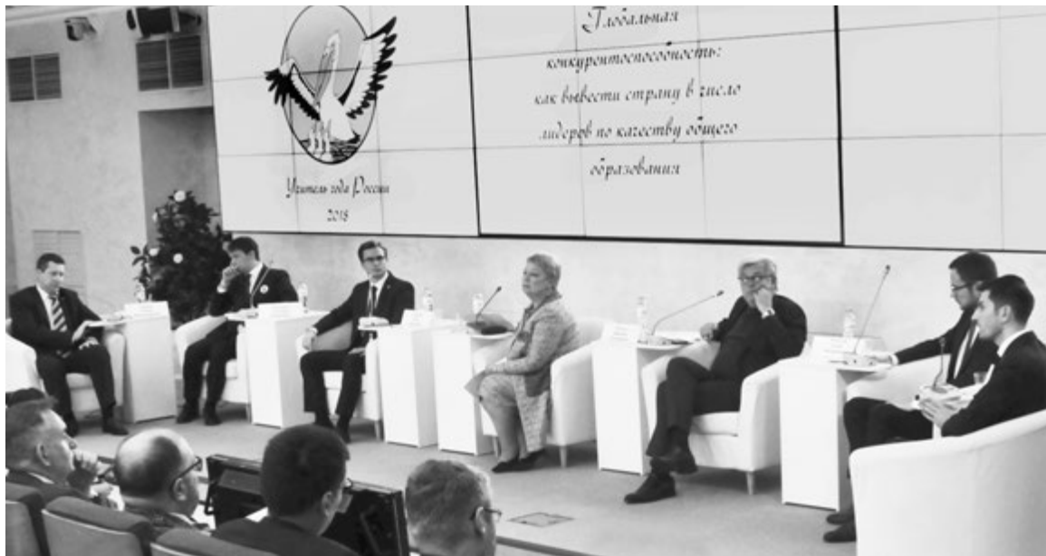
Ответ найти непросто. Даже призерам конкурса «Учитель года России»

...Всего два вопроса надо было обсудить на этой встрече: что такое лучшие образовательные системы и как обеспечить равенство доступа к образованию для всех детей нашей огромной и такой разной страны. Ведь именно равенство и доступность - главные факторы качества образования. Но разговор на эту тему не получился.