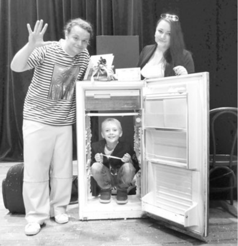
Холодильник - портал в фантазийные миры

Когда после «Полдника» очередь дойдет и до встречи на спектакле, наверняка на сцене будет чуть больше вдохновения, а в зале - чуть больше внимания и сопереживания, чем обычно. Так прорастет доверие. Всем известно, что детский спектакль не сбудется полностью, если зрители не доверятся артистам. «Творческий полдник» существует еще и для того, чтобы артист доверился зрителям. И очень возможно, что «творческие полдники», а также и «завтраки», «обеда» и «ужины» когда-нибудь, может быть, очень даже скоро, будут не только праздничной прелюдией, разведкой боем, средством привлечения внимания к репертуару, но и самодостаточным форматом одновременного творческого общения интересных людей самого разного возраста и роста. Здесь, в МОГТЮЗе, их называют «театральными экскурсиями», «читками современной подростковой прозы», «мастер-классами для детей, учителей и родителей», да мало ли как еще. Оказывается, нам, зрителям относительно небольшого, да и большого роста, этого очень не хватало. Так что вперед, театральные гардемарины!