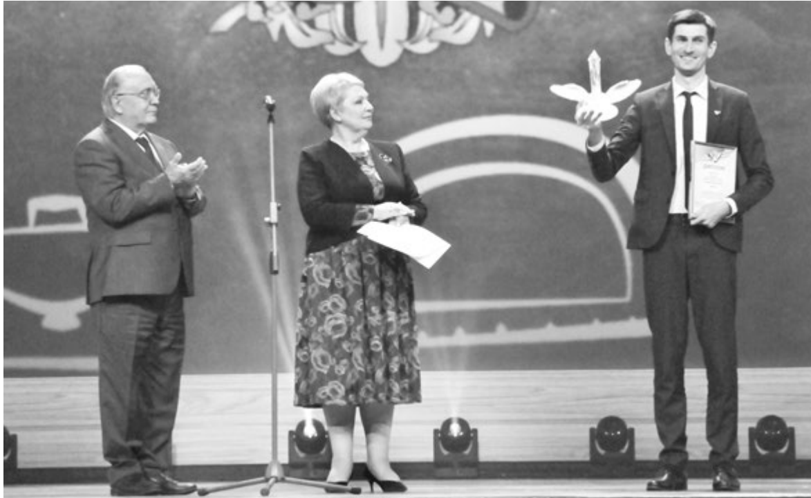
Большой Хрустальный пеликан летит в Грозный

ния Российской Федерации Ольга Васильева.