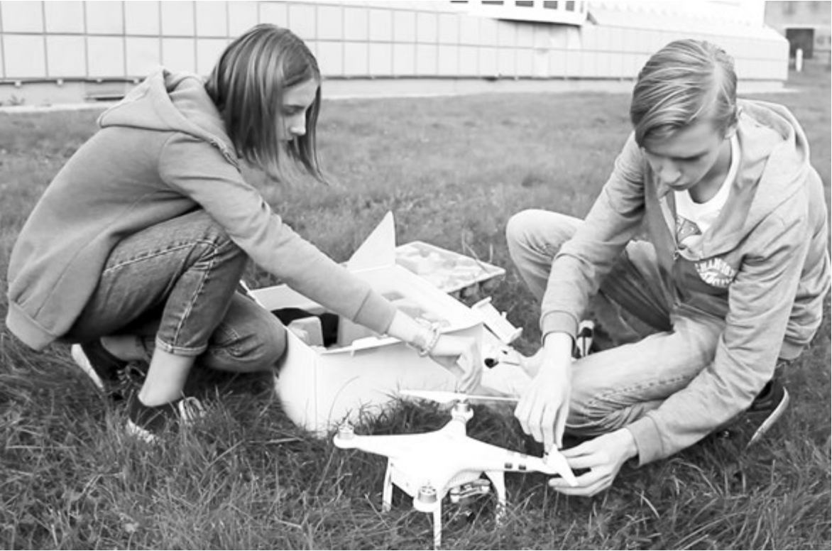
Ребята создают свой медиапродукт, используя последние технические новинки

Из опыта работы детского творческого объединения «Пресс-клуб» Центра детского творчества