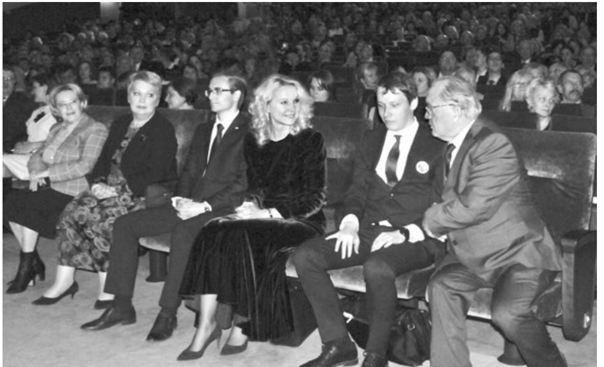
Живое обсуждение: кто он, современный герой, современный учитель?