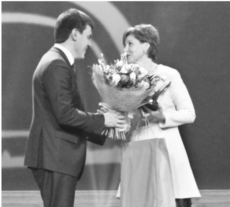
Министр науки и высшего образования РФ Михаил КОТЮКОВ поздравляет с наградой учителя-дефектолога Наталью ЧЕРНОВУ

из федерального бюджета построено 116 тысяч новых школьных мест. С 1 января 2019 года обретет новую жизнь новый национальный проект «Образование», на эти цели будет направлено 747 миллиардов рублей, из них 252 миллиарда пойдут на нашу школу.