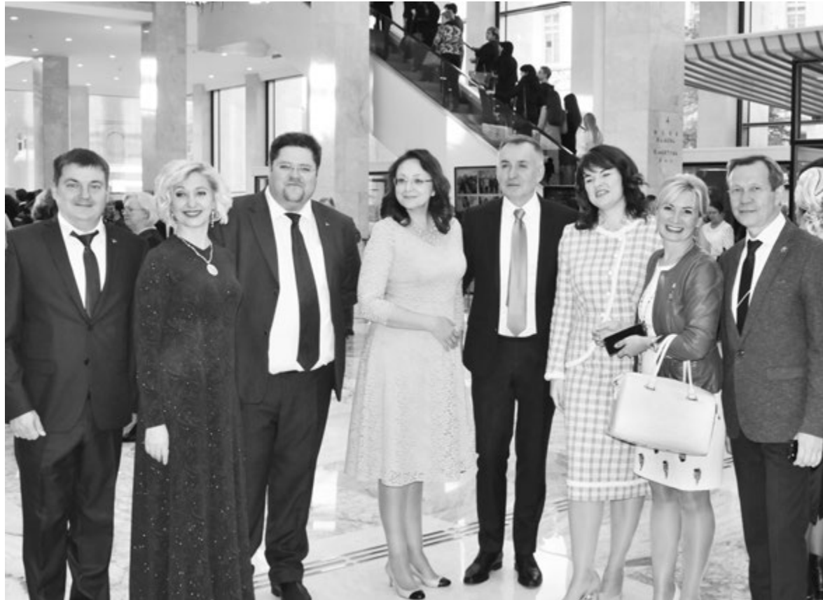
И каждый раз - роскошь общения!

- Я хочу вас искренне поблагодарить за то, что вы выбрали эту благородную профессию - профессию учить детей, - от имени Правительства РФ поздравила всех сидящих в зале Татьяна Голикова. - Вы на протяжении длительного периода находите с ними, они впитывают от вас самое лучшее. В последние годы отрасль образования получает существенную государственную поддержку. Мы эту поддержку продолжим. Мы продолжим строить новые школы. Только за последнее время благодаря финансовой поддержке