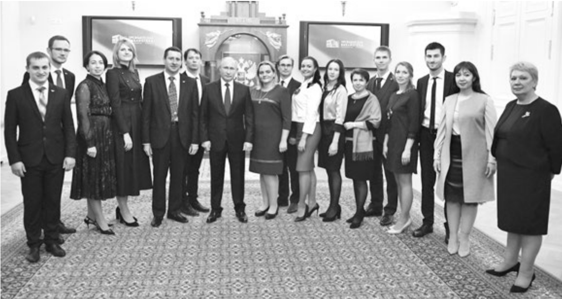
Владимир ПУТИН встретился с лауреатами Всероссийского конкурса «Учитель года России»-2018

Рособрнадзор проведет в октябре Всероссийское исследование компетенций учителей, в котором примут участие порядка 18 тысяч педагогов из 45 регионов. Решение об участии в исследованиях регионы принимали добровольно, сообщили в пресс-службе ведомства. В каждом регионе организуют специальные площадки, где учителя будут выполнять специальные задания по материалам, разработанным на федеральном уров-