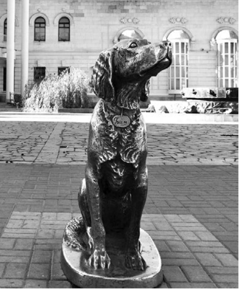
Памятник Белому Биму в Воронеже

Гавриил Николаевич наведывался в Острогожск до конца жизни. Не только литературная жизнь города