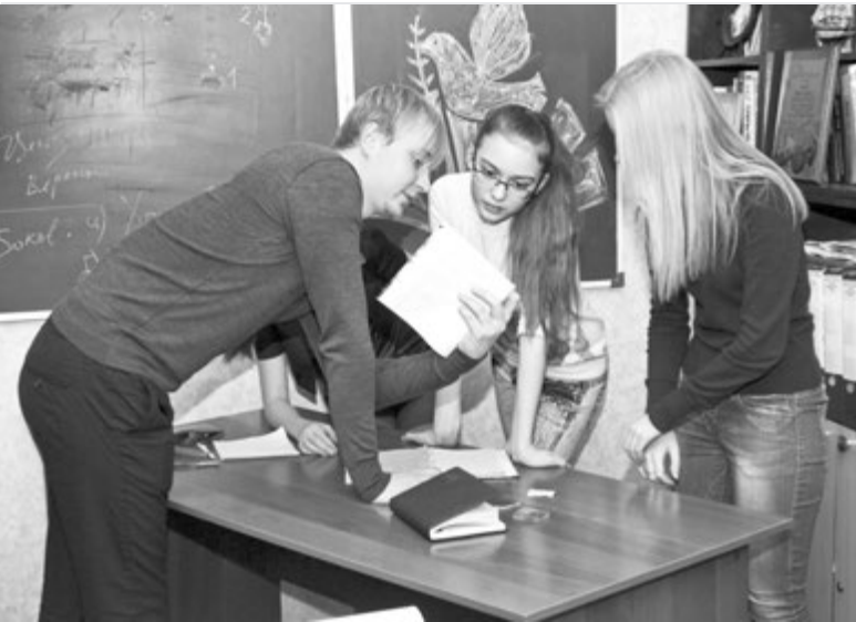
Посоветоваться с профессионалом - бесценно!

В рамках деятельности «Пресс-клуба» на протяжении каждого года обучения учащиеся проходят профессиональные пробы в качестве журналистов, операторов и инженеров видеомонтажа: на журналист-