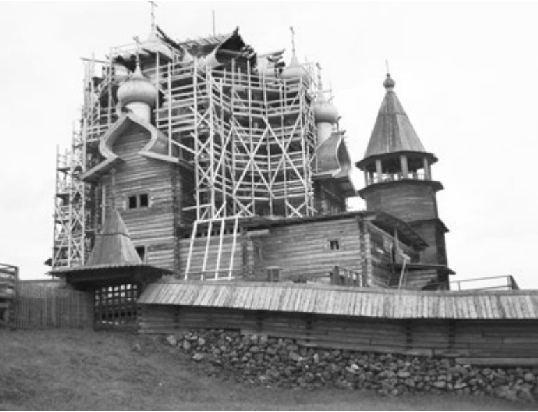
Преображенская церковь, как уверяют реставраторы, простоят еще 300 лет

До реставрации Преображенка простояла почти 300 лет. Специалисты уверены, что после их вмешательства она будет жить как минимум еще столько же.