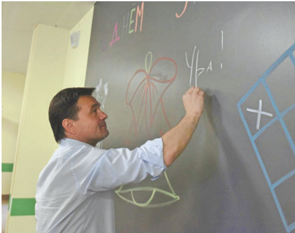
Губернатор Московской области Андрей ВОРОБЬЕВ желает успехов в новом учебном году