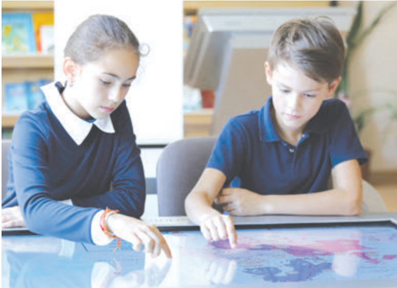
Информационные технологии выводят московскую школу на новый уровень

При этом важно, что заметно сокращаются «отстающие результаты». В 9 раз с 2010 года сократилась доля учеников, не преодолевших минимальный порог по обязательным предметам в рамках ЕГЭ.