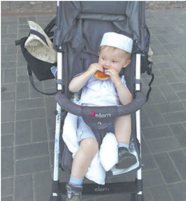
Коляска не роскошь, а средство передвижения!

родители, воспитатели, учителя, тренеры, коучи, тьюторы, преподаватели. Специфика наставничества в бесконечности этого процесса, нацеленности наставника на подготовку новых наставников. В этом главный показатель эффективности и главное отличие от других способов шефского взаимодействия. (Риском является одноразовость наставничества.) Указанная специфика позволяет иначе взглянуть на методы наставничества. Воспитание, обучение, передача опыта, тренинги, беседы - все это вторично по отношению к любви как главному механизму наставничества.