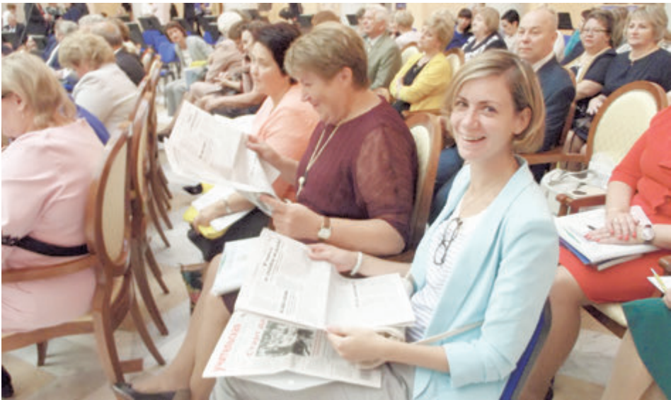
Педагоги с удовольствием читают «Учительскую газету»

Ну а на десерт и «Учительская газета» получила от заслуженного педагога упрек. Господину Ямбургу показалось неправильным, что в заголовке статьи «В Ленинградской области к профессии «учитель» относятся с большим уважением» слово «учитель» закавыче-