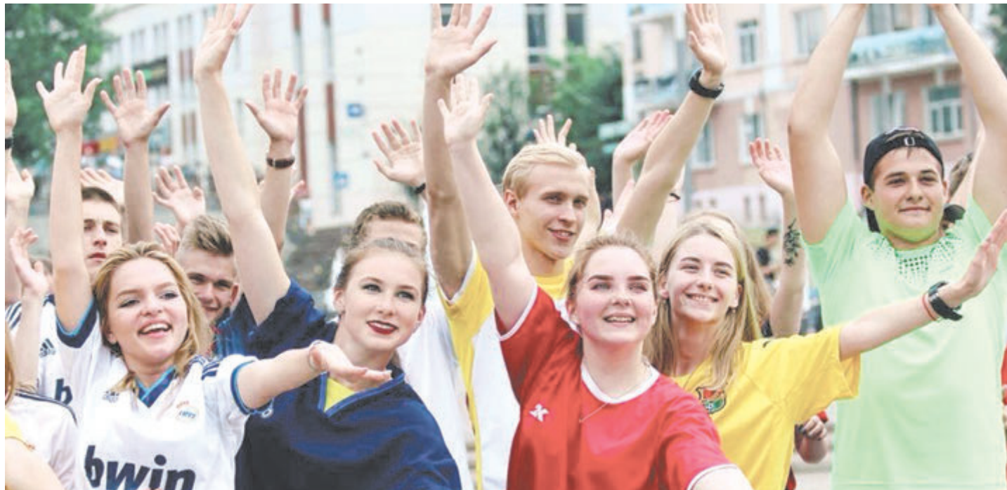
«Энергия» — это не только активная учеба, но и бурная внеурочная деятельность.

пропал страх покупать дорогую современную технику. Раньше руководители предприятий боялись, что им некого будет поставить к этому оборудованию. Теперь, когда в «Энергии» студентов обучают на самых новых станках, компании пытаются синхронизировать с колледжем приобретение таких станков, чтобы