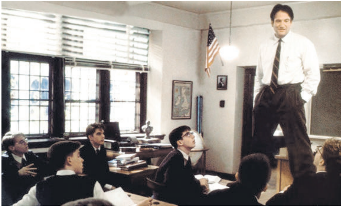
«Общество мертвых поэтов» - фильм о том, насколько глубоко можно любить жизнь

Кажется, это мечта любого молодого педагога, слушающего рок и на досуге поигрывающего на гитарке. Помните «Майора Пэйна»? Там пехотинца, ветерана войны во Вьетнаме, отправляют в отставку, и ему ничего не остается, кроме как идти муштровать юных скаутов. Здесь похожая история. Дьюи Финн, мечтающий о лаврах рок-звезды, терпит фиаско. Его выгоняют из группы. Он впадает в депрессию и влезает в долги. Его величество случай отправляет Дьюи в частную школу на место, ему не предназначавшееся. И точно не на роль учителя музыки. Но воля, увлеченность и безбашенность решают все. Свою педагогическую некомпетентность он с лихвой компенсирует единственной подлинной страстью своей жизни. И вот спустя некоторое время ученики берут в руки электрогитары, басухи, барабанные палочки и... Тот самый случай, когда без заглавного актера не было бы фильма. Майк Уайт, автор сценария, при создании истории вдохновлялся жизнью своего соседа Джека Блэка (исполнитель главной роли), очень бурно проводившего свои досуги-буги.