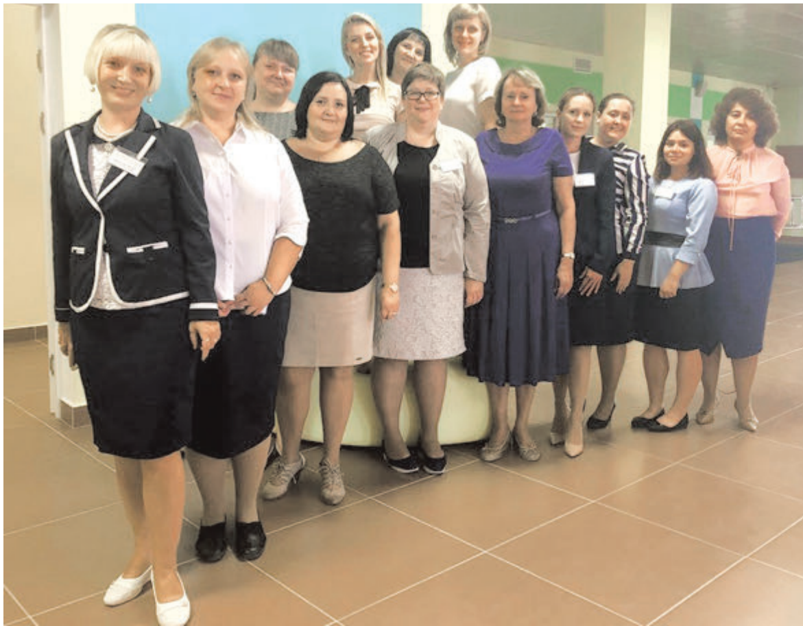
В новой школе коллектив еще только складывается, но педагоги уже ощущают себя одной командой

Прекрасно оборудованный зал для хореографии, музыкальный класс, кабинет изо. Так как третья школа всегда славилась робототехническим творчеством, учителя надеются, что сейчас это направление получит серьезное развитие. Роскошные многофункциональные спортивные залы в самом здании и при школе. Кабине-