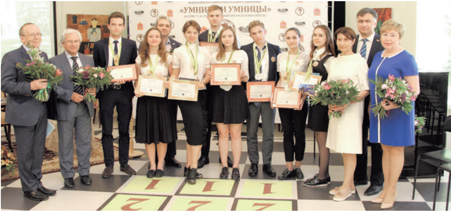
Победители и призеры интеллектуального движения «Умники и умницы»

Всероссийское интеллектуальное движение «Умники и умницы»