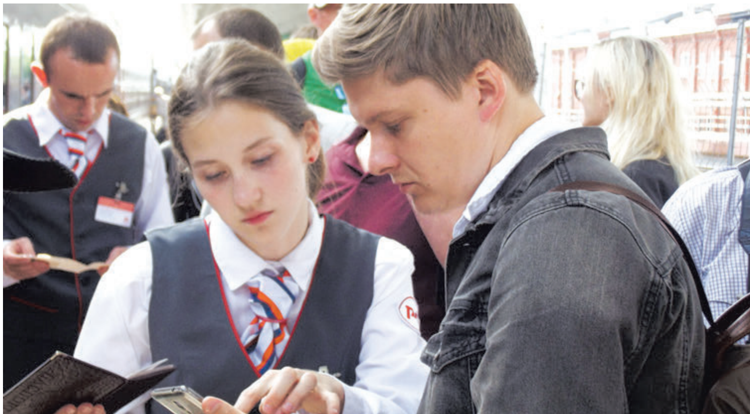
Их задача - обеспечить максимальный комфорт пассажиров в поездке

Сегодня в Санкт-Петербурге насчитывается более 85 трудовых отрядов по 10 направлениям: строительные, сельскохозяйственные, педагогические, сервисные, медицинские, археологические, поисковые, отряды проводников, экологов, энергетиков. Всего более 3 тысяч человек. При этом Санкт-Петербург является единственным городом России, где движение студенческих отрядов не прерывало свое существование.