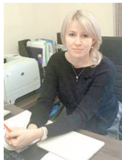
Людмила ОВЕЧКИНА.

их не бросаем, они всегда могут прийти сюда за советом, сохраняется связь и с приемными семьями, ведем постинтернетное сопровождение.