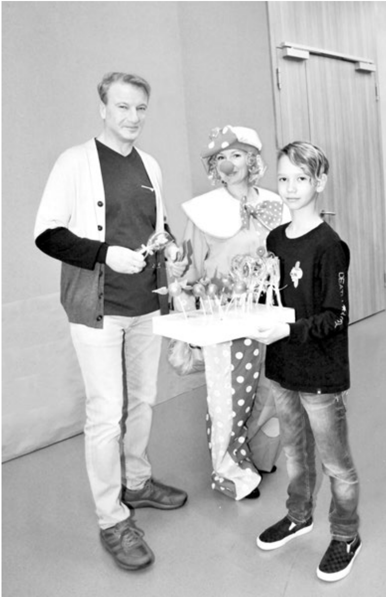
На благотворительной ярмарке побывал и Герман ГРЕФ