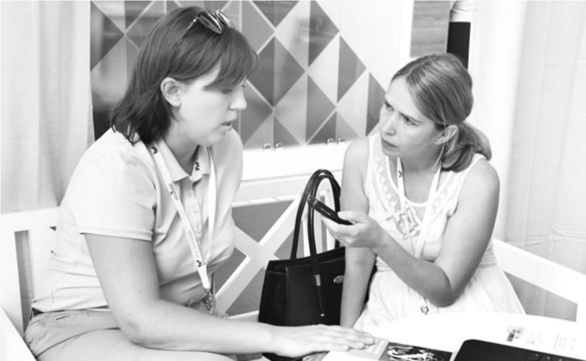
Свобода слова - понятие, за которым стоит очень и очень многое

А признайтесь-ка, дорогие читатели, часто ли вам попадало за то, что вы где-то высказали свое мнение? И существуют ли в вашей образовательной организации нормы и правила, писанные или неписанные, которые бы запретили вам делать это без разрешения начальства?