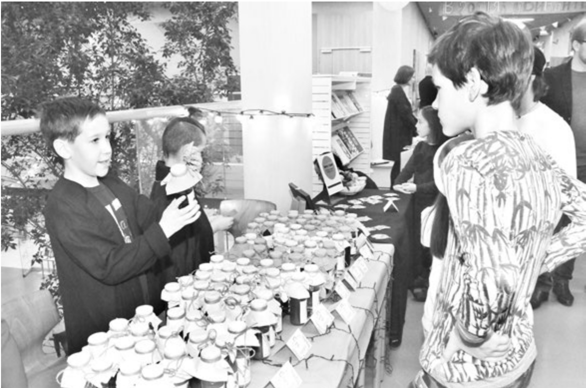
Волшебное зелье пользовалось спросом у покупателей

...Программа благотворительной ярмарки была чрезвычайно насыщенной и разнообразной, на всех четырех этажах жизнь кипела чуть ли не до самого вечера. В атриуме на сцене сразу после открытия вы-