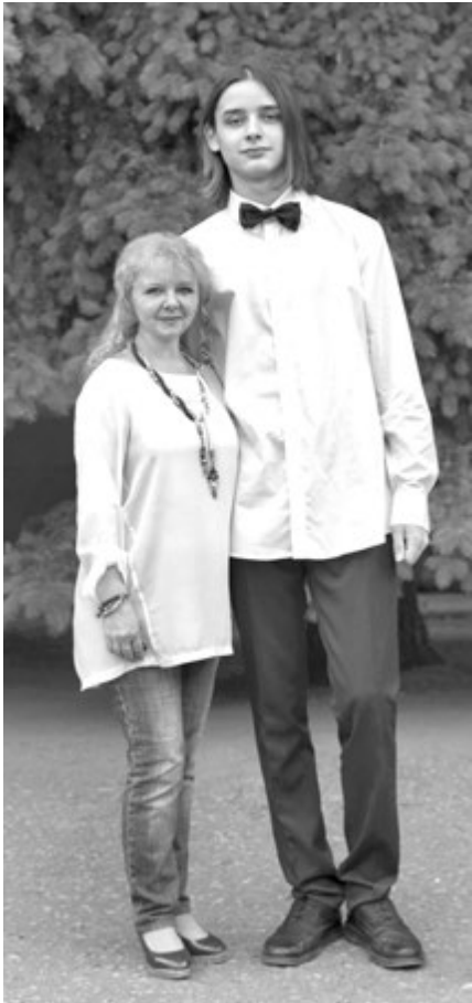
Светлана с сыном

И это тоже нормально. Сначала Слава жил работой взрослых, те-