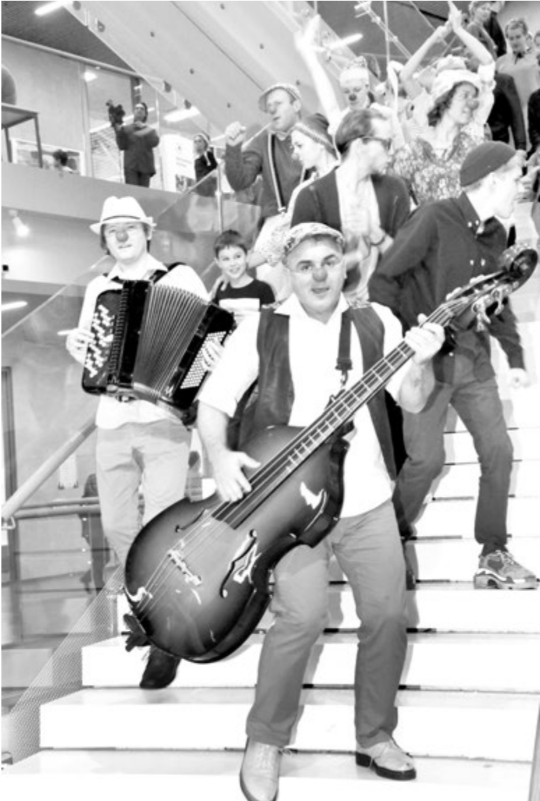
Эти клоуны еще и отлично играют на музыкальных инструментах

их родители отправились в увлекательное путешествие по страницам любимых книг. Каждый класс приглашал гостей ярмарки в свою любимую книгу, - рассказывает Татьяна Игоревна. - Когда книги были выбраны, учителя литературы вместе с детьми подробно изучали произведения, чтобы на основе литературного текста можно было придумать свои аттракционы, квесты, литературные кафе. А потом уже, чтобы оформить пространство, придумать костюмы, подключались родители. Кстати, все, что вы здесь видите, сделано руками наших родителей. И это очень важно, что все это волшебство - совместный труд наших учеников и их пап и мам, а не специальной приглашенной группы оформителей. Примечательно, что уроки литературы, искусства и математики все эти три недели, пока шла подготовка, были заточены под ярмарку. Во время этого увлекательного процесса дети учились понимать текст, считать, читать, а главное - создавать вместе нечто новое и творческое. Кстати, самыми популярными у наших ребят ока-