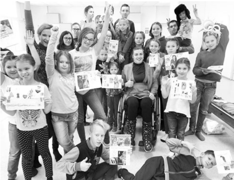
Когда мы едины, мы непобедимы!