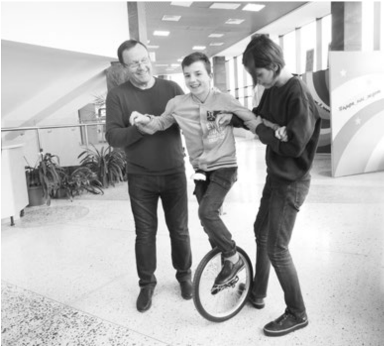
Дайте мне точку опоры!..

Таким образом, когда речь идет о зарплате, то нужно понимать это в более широком смысле, чем денежное вознаграждение. Это еще и возможность оценить деятельность педагога в разных аспектах, возможность проанализировать деятельность каждого преподавателя и коллектива в целом и на основе этого анализа понять, в каких курсах квалификации есть потребность.