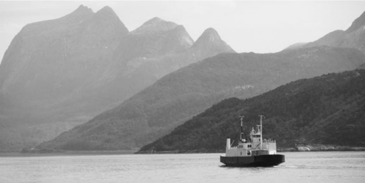
Чем глубже врезается фьорд в сушу, тем яснее и удивительнее его скальная геометричность