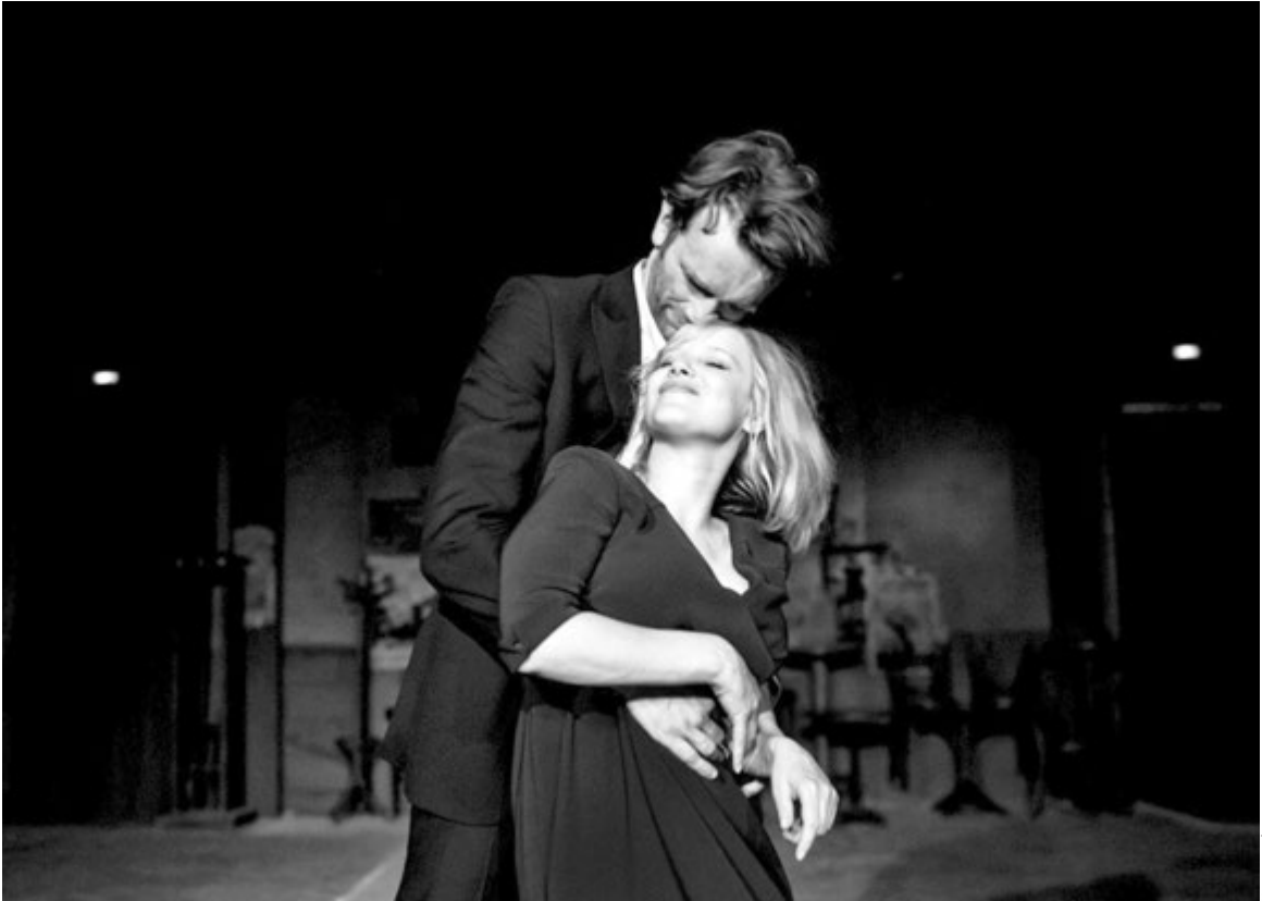
Война не только политика, но и сама жизнь