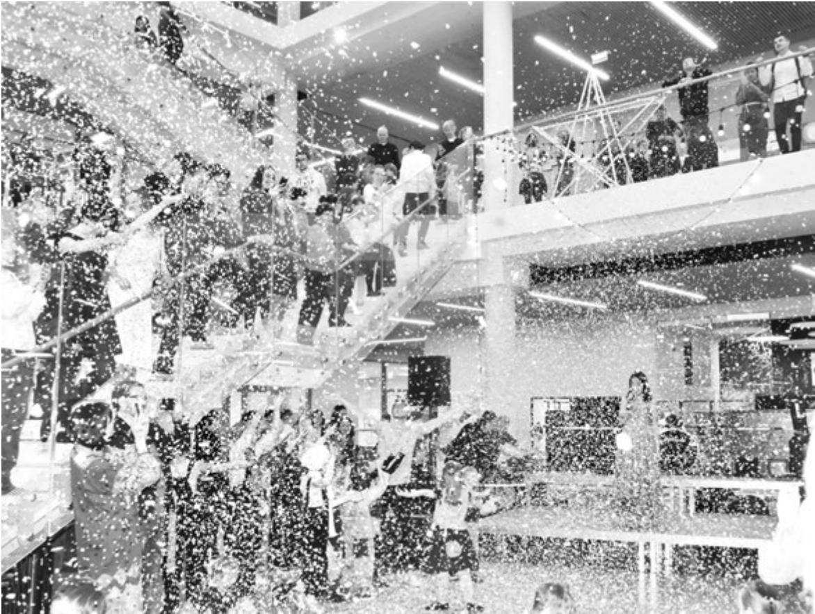
Снежный фейерверк стал неожиданным сюрпризом для всех