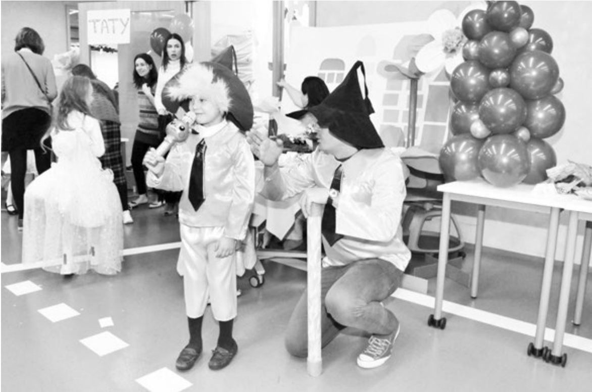
Большой и маленький Незнайки

...Зазвучала музыка, и на сцене появились ребята в разноцветных