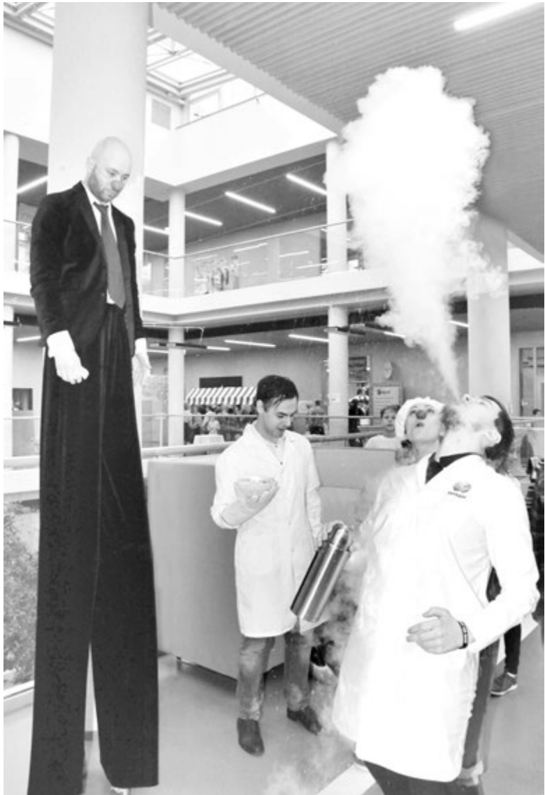
На мастер-класс по молекулярной кулинарии заглянул и клоун на ходулях