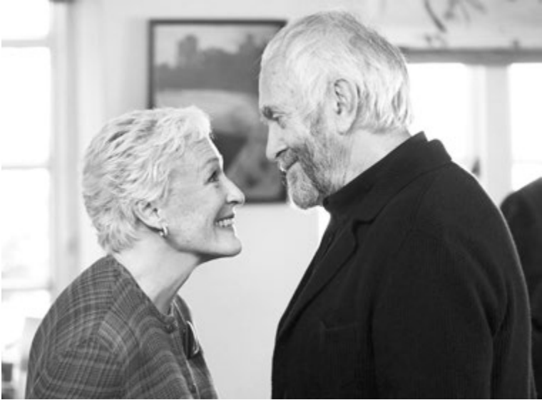
Он, Она и Талант

Кто абыюзер, а кто жертва? Кто чистен, а кто лицемерит? Кто более виноват в том, что стыдно смотреть в глаза друг другу и окружающим? Ответы на эти вопросы не могут быть