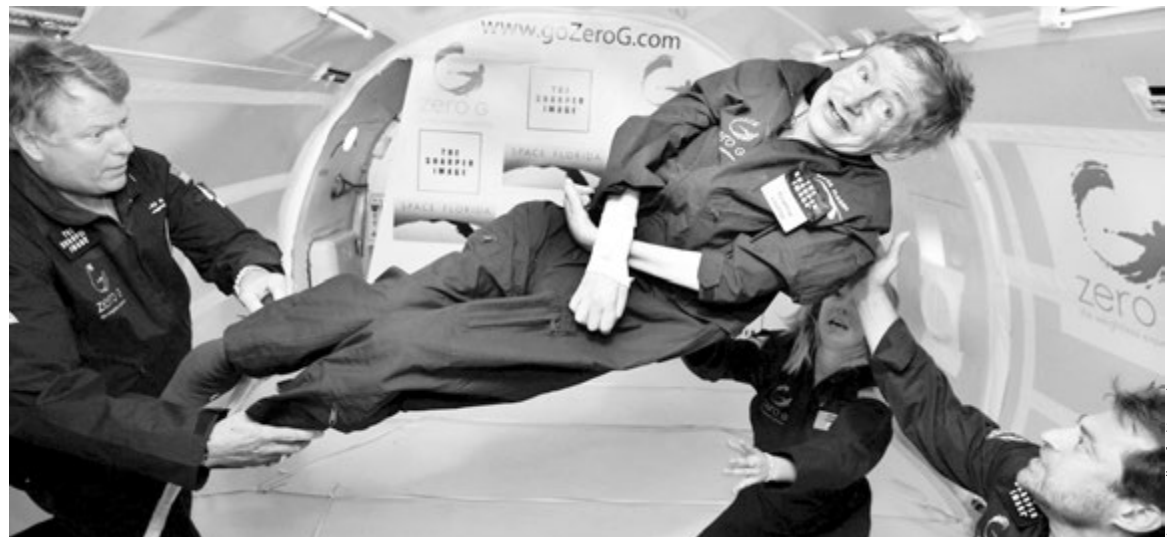
Стивен ХОКИНГ в условиях невесомости

Одной из наиболее сенсационных идей, высказанных в «Кратких ответах», является появление расы «суперлюдей». Хокинг уверяет, что рано или поздно тем, кто обладает финан-