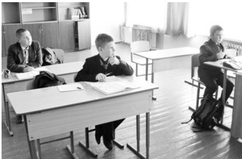
В пятом классе всего три ученика

Пока существовал колхоз, до Исы можно было в любой момент добраться если не на рейсовом автобусе, то на попутке, да и у школы был свой транспорт. Сейчас автобус