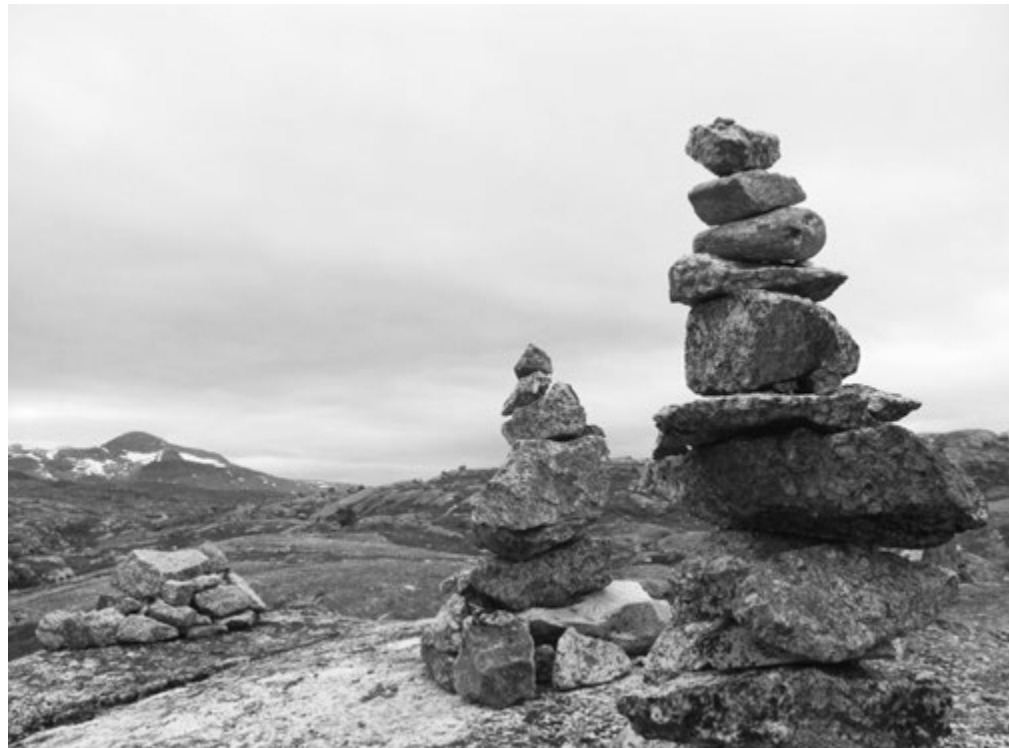
Местные сейды - священные камни