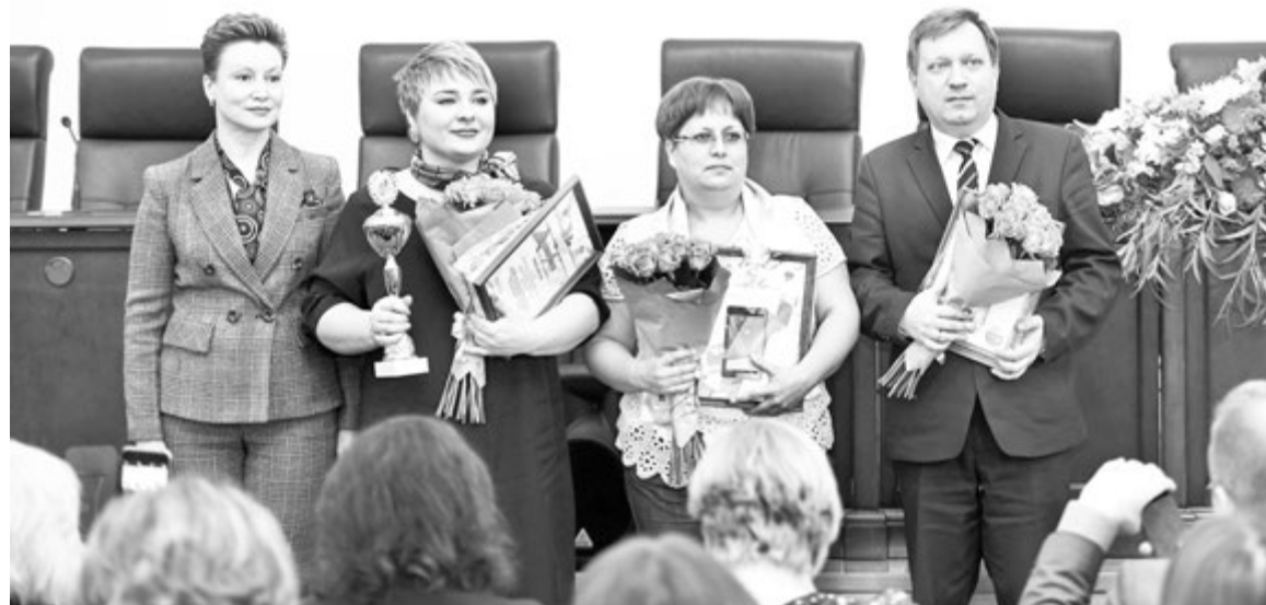
В Минпросвещения России вручили награды лучшим инклюзивным школам и детским садам

Участникам запрещено иметь при себе средства связи, фото-, аудио- и видеопараметры, справочные материалы, письменные заметки и другие средства хранения и передачи информации. Также выпускники не имеют права пользоваться текстами литературных источников.