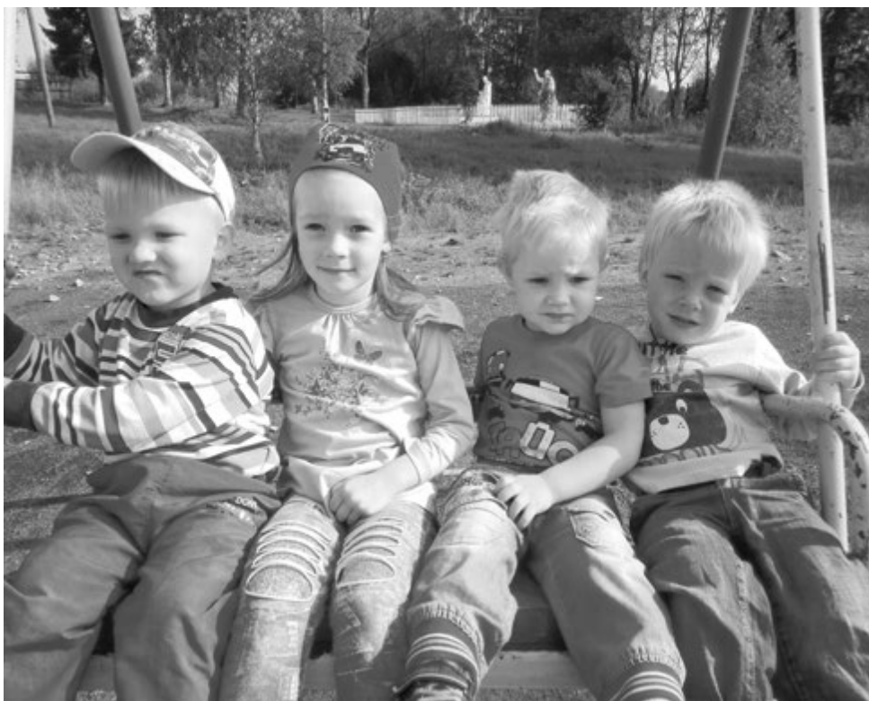
Все общение с детьми происходит на карельском языке

В контексте таких процессов особенную новизну приобретает проект «Языковое гнездо» (кар. kielipezä), работающий не в государственной бюджетной организации, а на базе общественной организации. Созданная в 2012 году в селе Ведлозеро (Пряжинский район, юго-западная часть Республики Карелия) для сохранения карельского языка и культуры, а также для улучшения качества жизни сельчан карельская региональная общественная организация «Дом карельского языка» старается направлять усилия на работу с детьми, семьями, местным сообществом. Больше половины жителей Ведлозера - коренное население, карелы. Пожилое поколение в общении между собой использует карельский язык, в общении со своими детьми использует или карельский с русским вперемешку, или же только русский язык, а в общении с внуками и правнуками - лишь русский. Многие родители проявляют желание, чтобы их дети знали карельский язык наравне с русским, но оказались в такой реалии, ког-