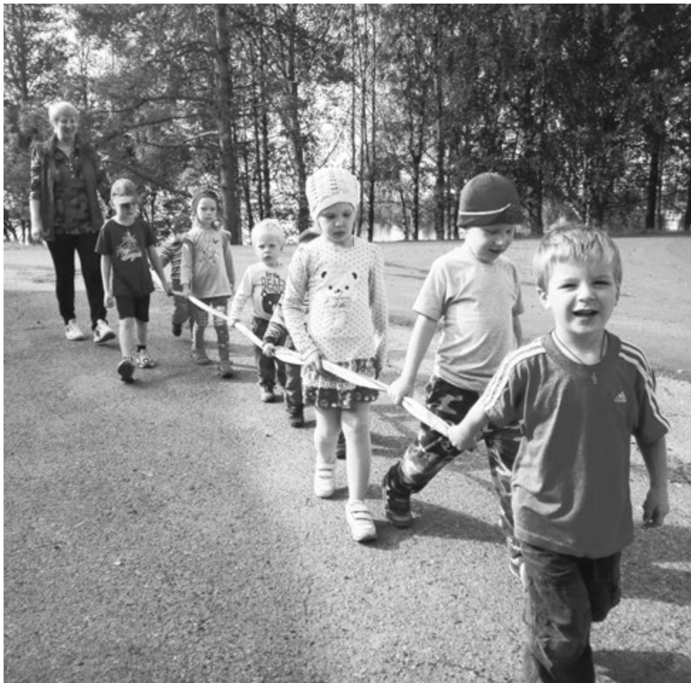
В группе дети от полутора до семи лет

языку учатся не только дети, но и взрослые сотрудники. Работа Дома карельского языка, представляющего собой двухэтажное деревянное здание общей площадью в 500 кв. м, построена так, чтобы пользу от нее получали все посетители, как взрослые, так и дети.