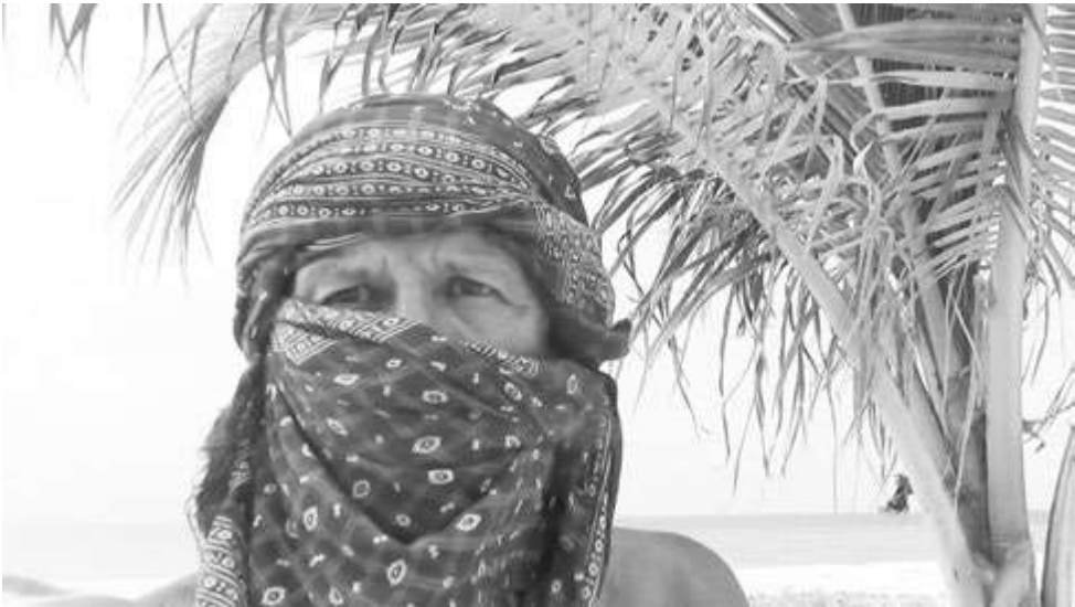
Скитания - это школа жизни

Я уверен, что слово «шляхетство» - «благородство» произошло не от шляхты - дворянского сословия, а именно от звучного и гордого украинского «шлях» - большая верстовая дорога. Они просты, мудры и очень насущны. Привычная домашняя дума (хоть и модно наряженная и целомудренно застегнутая на все пуговицы ученого мундира) для их постижения не годится. Все придет само собой и в свое время. Чем длиннее пройденный путь, чем сложнее его преодоление, тем увереннее шаг по жизни. Ее коренные основы легко и просто распознаются в деталях дорожного быта. В нем порой решение запутанных житейских проблем, ответы на самые сложные вопросы бытия. В том числе и денежные.