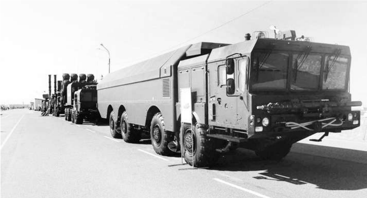
Береговой ракетный комплекс «Бастион-П»

Мы тоже бывали больные и темные. Простим ей ее боль и темноту.