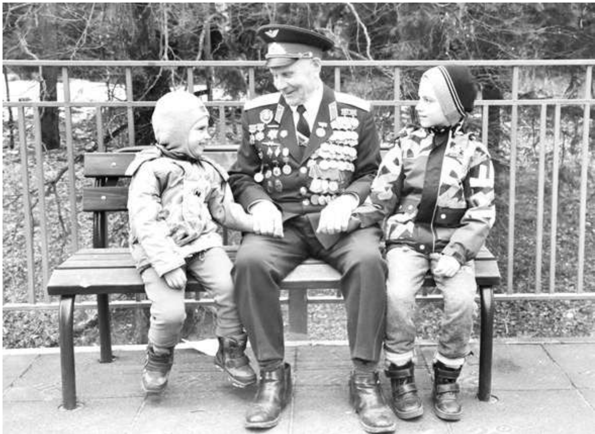
В Троицке немало ребят хотели бы узнать о боевом прошлом фронтовика