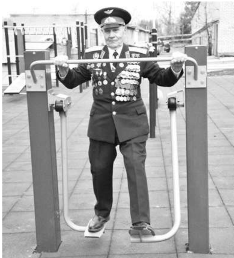
Всегда в форме