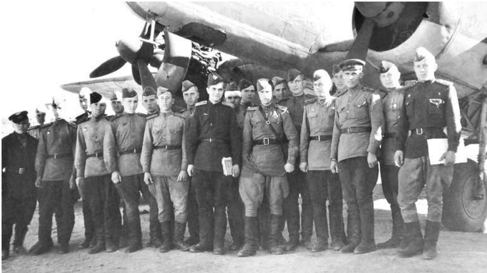
Они были молоды, они сражались за Родину