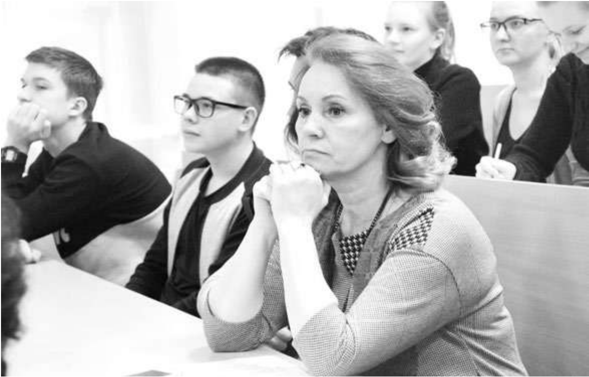
Качественный совмещенный урок - серьезная задача для учителя

ния урок проводится одновременно в нескольких классах, то есть с детьми разного возраста. Таким образом, меняется одно из существенных свойств классического понятия «урок». В теории и практике образования используется такое понятие, как «совмещенный урок».