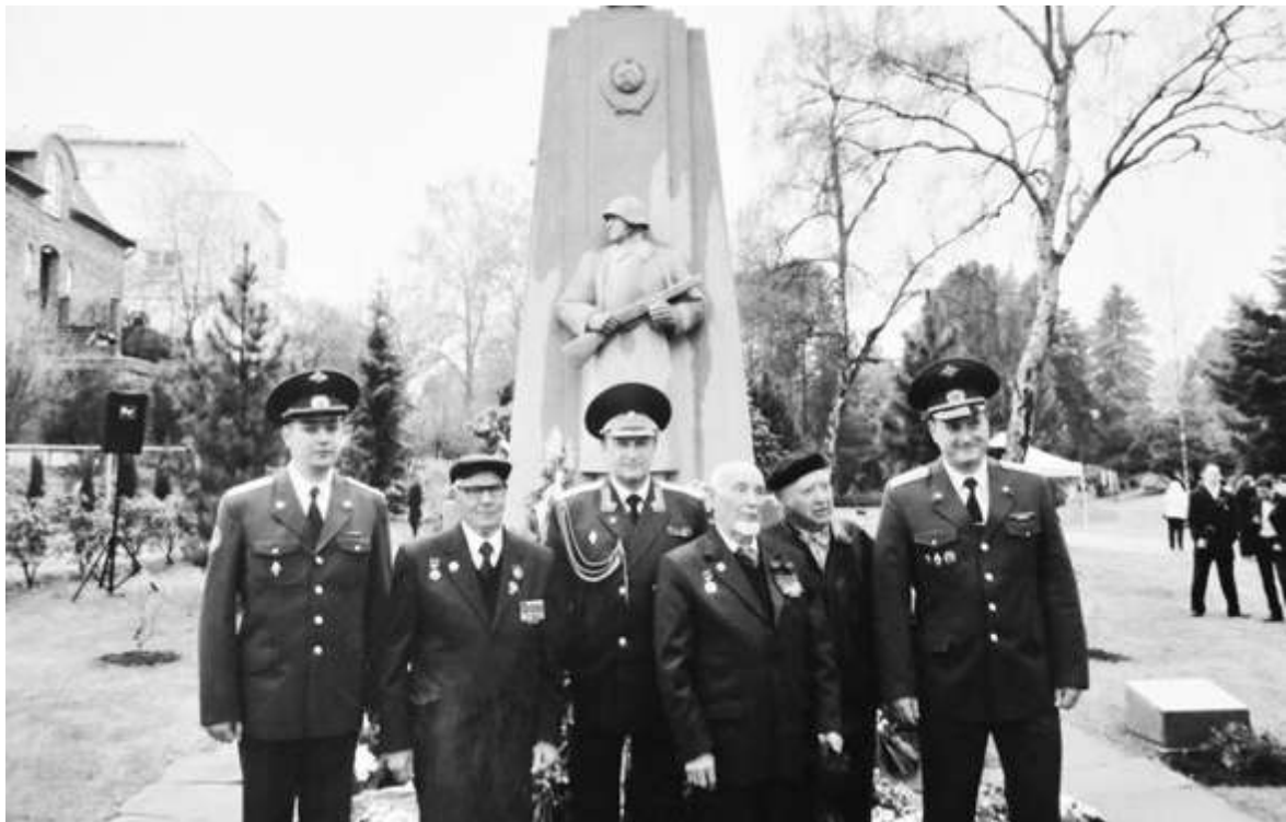
Встреча ветеранов в Осло