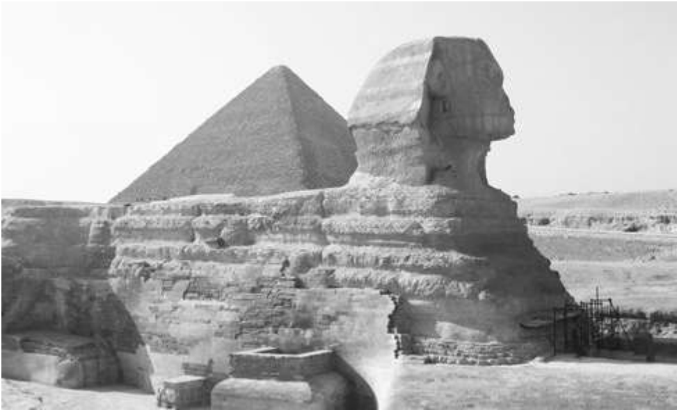
Самый таинственный памятник в Египте - Большой Сфинкс

В «заезжках» меня, как правило, снабжают кипятком, этого достаточно. С полулитровой кружкой чая я располагаюсь на лужайке, бревне, крыльце, веранде (велосипед всегда рядом со мной) и наблюдаю за дорогой. Здесь она приостанавливает свой бег, и можно расслабиться. Ко мне нередко подходят дальнбойщики, расспрашивают, удивляются, предлагают помощь.