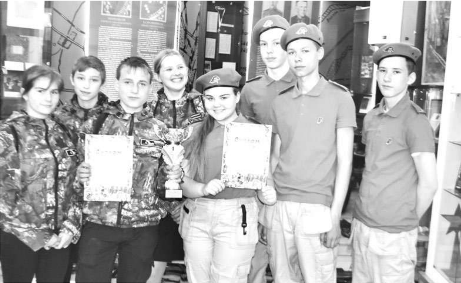
Юнармейский отряд занял первое место в городском квесте по истории Победы

По-прежнему юнармейцы являются самыми активными участниками мероприятий. По итогам реализованных проектов ребятам в