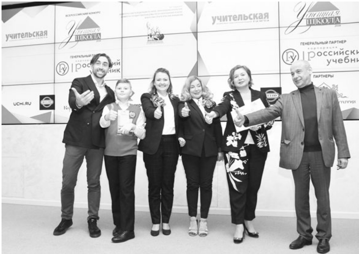
Как нужно действовать, чтобы достичь успеха? Конкурс дает ответ на этот вопрос

да не публикуют состав экспертов, а главное - нечетко определяют «сверхзадачу» конкурса, которая, думается, должна служить общим задачам развития образования, школы и профессиональному росту учителя. Стоит ли говорить, что подавляющее большинство этих конкурсов коммерческие, что эксперты (или члены жюри) не известны педагогическому сообществу, что материалы победителей чаще всего не публикуются (потому ли, что они слабые, потому ли, что всякий заплативший за участие в конкурсе, автоматически победитель)?