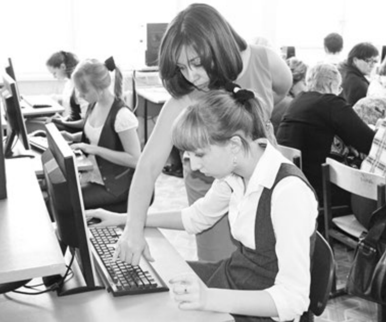
Марина Викторовна на уроках помогает каждому проявить себя