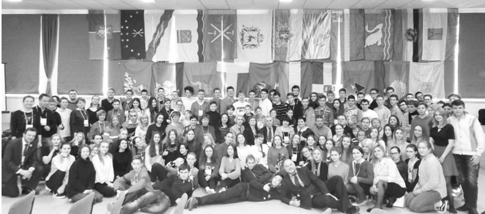
До свидания, Ростов, до новых встреч, друзья!

- Песни под гитару, новые друзья, древние города Азов и Новочеркасск, открытые уроки, путешествие в буран по набережной Дона - это не пять дней, а целая жизнь! Нестандартные уроки, мастер-классы, экскурсии. Мы побывали в космосе и в микромире, вывели новые определения и перестали пить чай из пакетиков, приняли участие в «Ростовских штучках», говорили о равенстве и дискриминации, выводили формулу добра и говорили о счастье! Счастье - это то, что есть проект «Зимняя школа», и мы благодарим всех организаторов этого праздника.