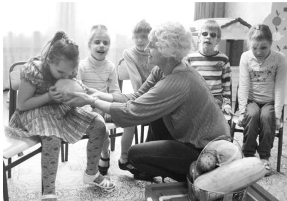
Знакомство с миром овощей

дактильной азбуки, но освоить этот язык для зрячеслышащего человека довольно сложно.