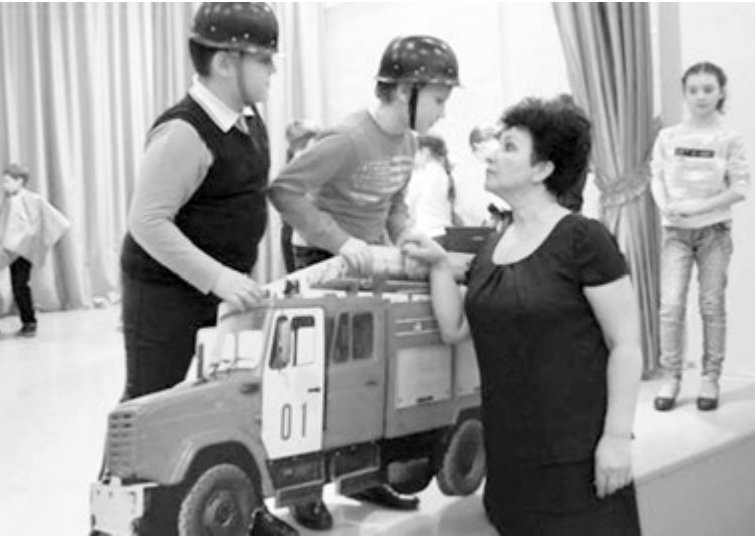
Выступление на сцене - это результат коллективного творчества

ления МЧС России по Ярославской области и пригласили 2 июня для выступления на стадион «Шинник» на церемонии открытия соревнований среди подразделений добровольной