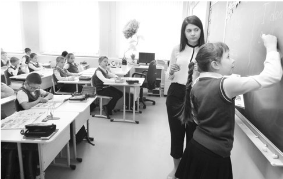
Верный ответ ищем вместе