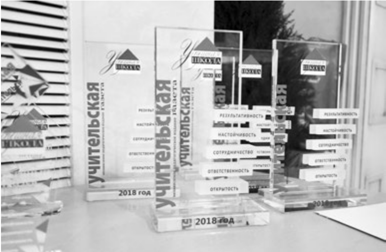
Шаги к победе. Приз Всероссийского конкурса «Успешная школа»-2018

Во-вторых, Положение конкурса - это одновременно и программа подготовки к нему, и матрица создания конкурсных текстов. Она, матрица, никоим образом не лишает школу «творческой» в подходе к осмыслению и подаче материала, но дает четкое представление о том, «что будет спрашивать».