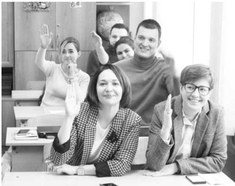
Педагоги превратились в примерных учеников

Коллекция золота скифов, палеонтологический музей, памятники военному-инженерному искусству, история Азова не оставили равнодушными участников зимней школы. Экспонаты завораживали, притягива-