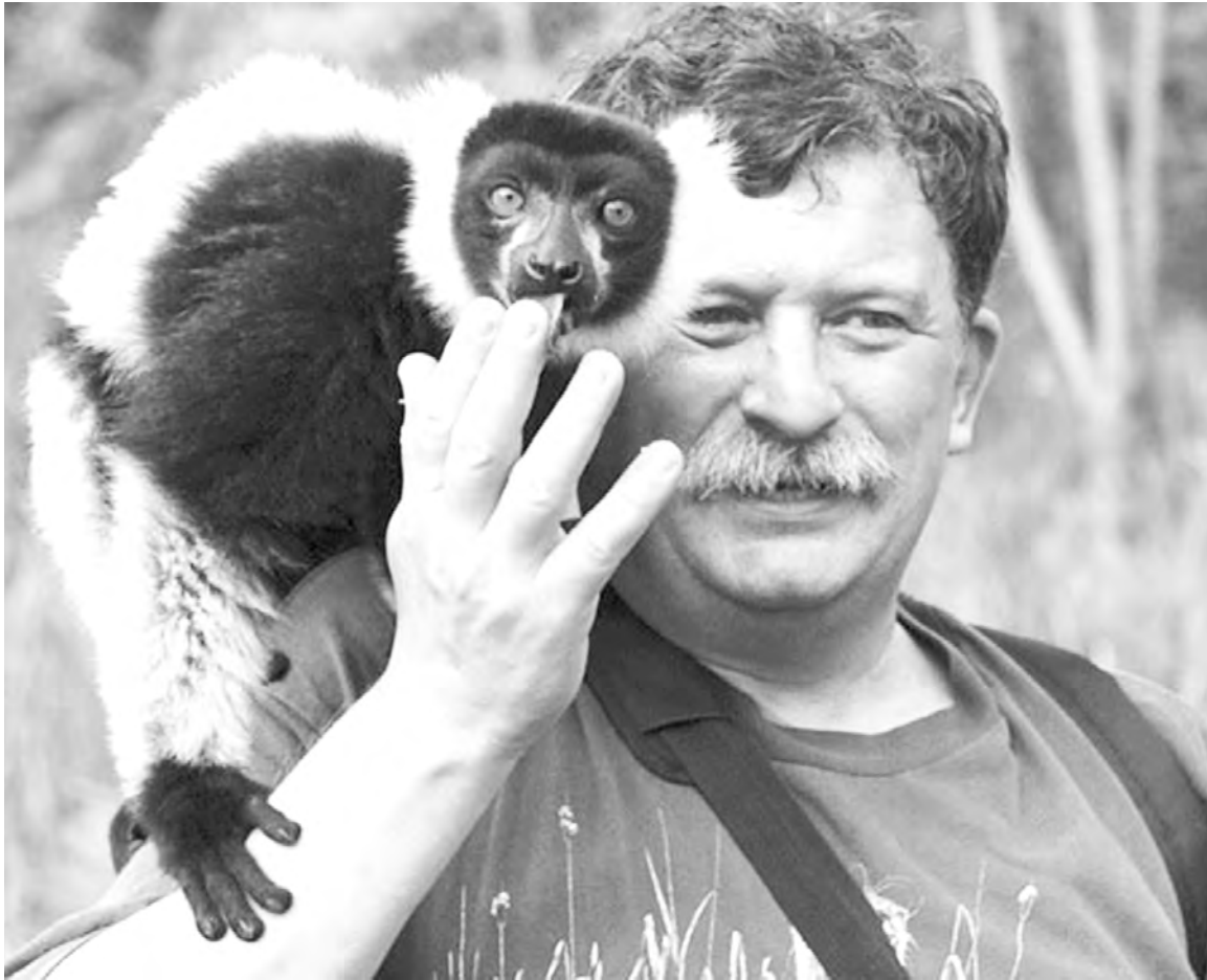
Человек и животные: мир един!

детства (что уж там говорить о крахе идеи профессиональной ориентации школьников - будущих биологов, экологов, географов), это все пустое, главное, чтобы чего не вышло и начальство не заругало. Бюрократы, формалисты, имитаторы деятельно-