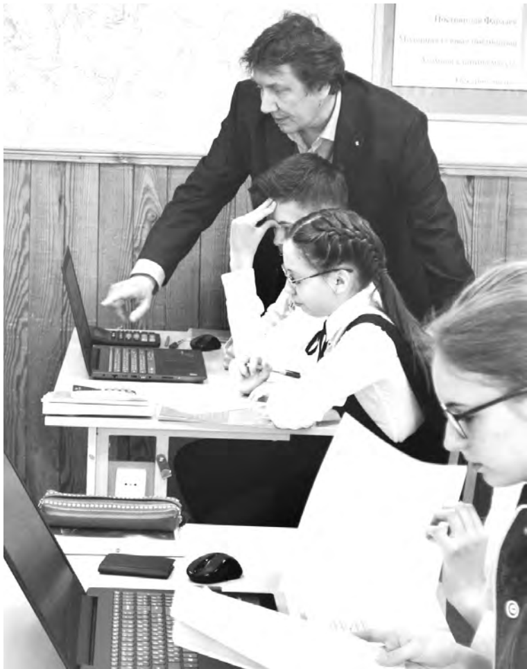
Виртуальное и реальное на уроках физики

ствии мы в региональном конкурсе школ получили цифровую лабораторию PASCO и набор датчиков к ней. Используя в образовательном процессе виртуальный и реальный эксперименты, стремясь решить вопросы недостаточной мотивации школьников, разрыва между требованиями ФГОС и реальными компетенциями учащихся, я пришел к идее интеграции реального и виртуального учебного эксперимента как средства повышения качества образования на уроке физики.