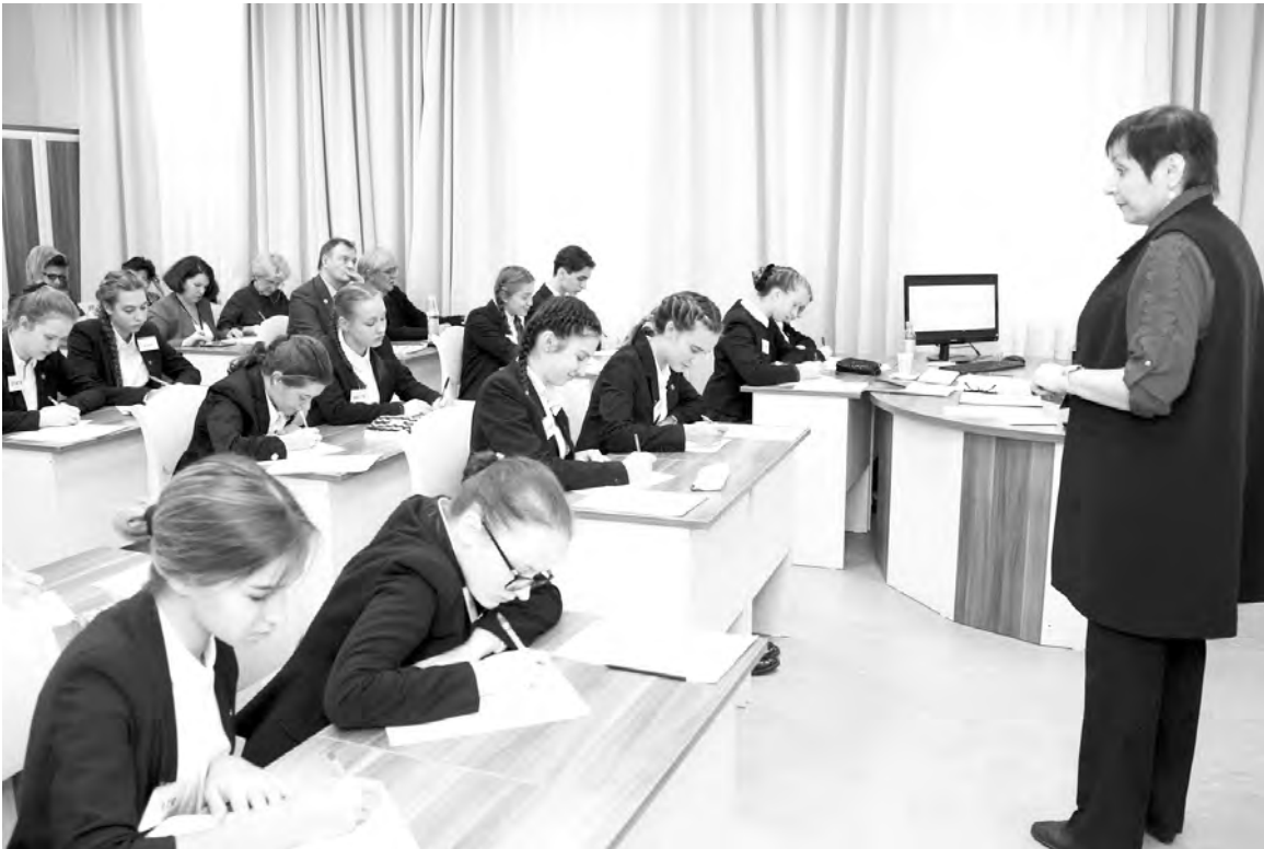
«...мы сохраним тебя, русская речь, великое русское слово...» (Анна Ахматова)

Непрерывное самообразование нужно каждому