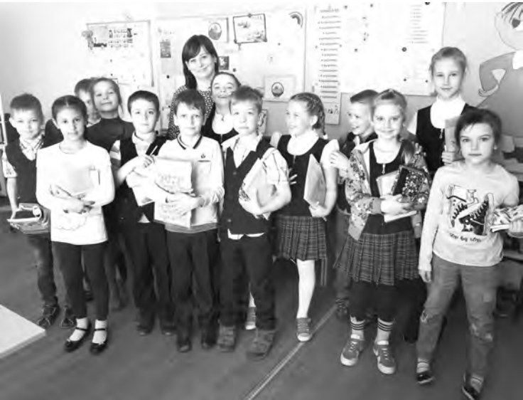
Учитель и ученики: всегда рядом

Конечно, для активной работы на уроке одной коробки кубиков мало, необходимо еще хотя бы две. Идей использования много!