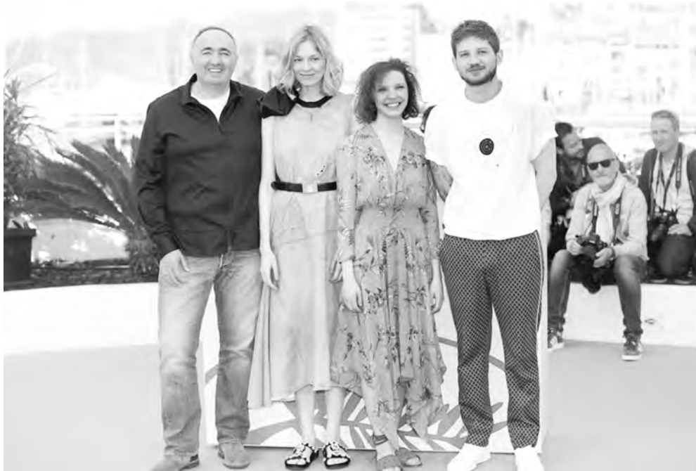
Команда фильма «Дылда» радуетс победы на Каннском кинофестивале

И если к героям «Тесноты» ты рад приблизиться, лучше понять, то из «Дылды» хочется бежать. Нет ужаса войны, есть ужас отдельных человеческих патологий. Нет ощущения жизни после смерти, то есть мира после войны, но есть сплошные индивидуумы со своими скелетами в шкафах. Кому нужно считать скелеты в шкафу, когда война только закончилась?! Если «Теснота» - выраженное национальное кино, то «Дылда» лишена идентичности и сделана скорее под заказ интернационального арт-сообщества. Это действительно арт, но не кинематографическое исследование определенного аспекта действительности. Из-за чего и возникает очевидный вопрос: при чем тут постблокадный Ленинград? Действие фильма могло происходить в 50-е, в наши дни, в Европе, на неизвестной планете. Это цена за игру в условность. Современные режиссеры умеют ярко дебютировать, но вырабатывать устойчивый авторский язык, индивидуальность получается далеко не у всех. Самое ненужное современному кинематографу - вычурность, интеллектуализм и изыск. Самое необходимое - целесообразность и желание познавать жизнь, а не концепты.