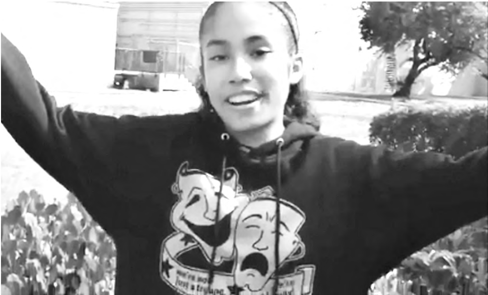
Видеообщение со школьниками из штата Флорида

Сколько бы грамматических правил мы ни заучивали, насколько богатым словарным запасом мы бы ни обладали, все же главное в изучении иностранного языка - практика. Безусловно, теоретические знания являются необходимой базой, но коммуникационные навыки приобретаются главным образом в процессе непосредственного общения. Общение - один из лучших способов выучить язык. Для этого на уроках можно использовать как возможности Интернета, так и обычную переписку. Лю-