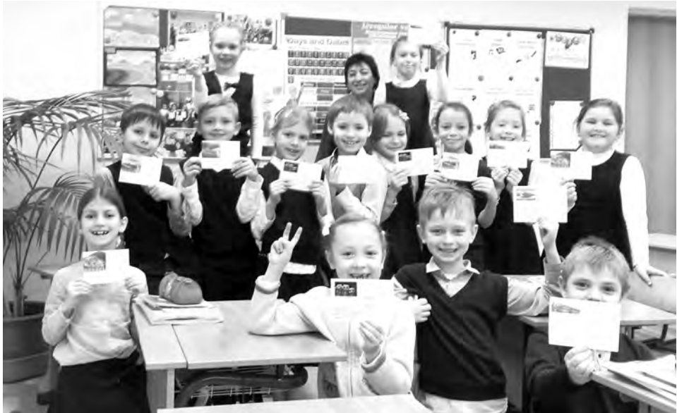
Третьеклассники переписываются с ровесниками из Джакарты

И все же все эти трудности с лихвой окупаются ростом мотивации, расширением кругозора, повышением интереса к жизни других людей. Даже для тех детей, которые никогда не выезжали за пределы России!