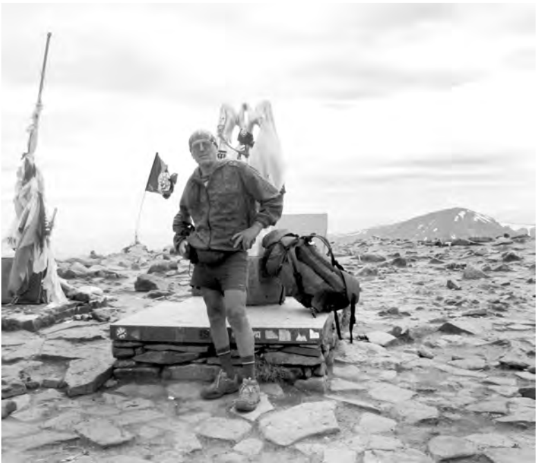
Горная высота - это близость к другим мирам

...«Лучше гор могут быть только горы, на которых еще не бывал». Горы и вершина, где побывал, - это как первая любовь. Возможно, будет и вторая, и третья. Лучше? Вряд ли. Просто другая любовь. Другая вершина.