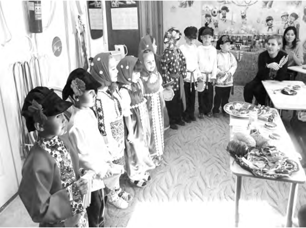
Выступление фольклорной группы с русскими частушками