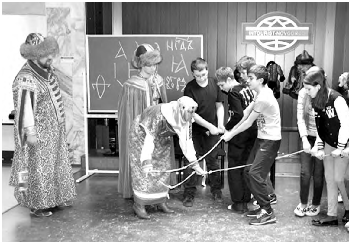
Прошлое как живая реальность

- Нет. У нас существует целая сеть школьных музеев, в которых дети пробуют себя в роли экскурсоводов.