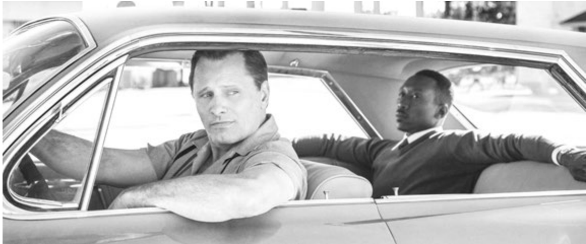
Вигго МОРТЕНСЕН (слева) и Махершала АЛИ составили отличный актерский тандем

Повествование довольно традиционно структурировано: условно фильм разделен на временные и пространственные отрезки, где за единицу принят очередной город, где Дону предстоит выступить. Тур нужно успеть закончить к Рождеству, о чем сам Валлелонга, рвущийся к семье, очень переживает, что тоже добавляет остроты истории. Подобный прием я не раз встречал в том же «Элвисе и Никсоне» с Кевином Спейси и Майклом Шенноном, но раз он работает при умелом использовании, так почему бы и нет?!