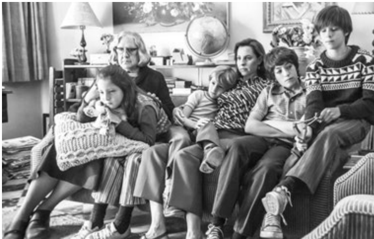
Одна из немногочисленных идилических сцен в фильме

Так что рекомендуем идти в кинотеатр, наслаждаться просмотром и формировать собственное видение.