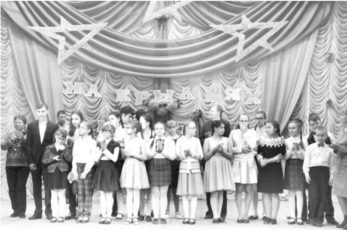
Каждый концерт - праздник для участников и зрителей

- Меня всегда радуют, восхищают и вдохновляют упорство, трудолюбие