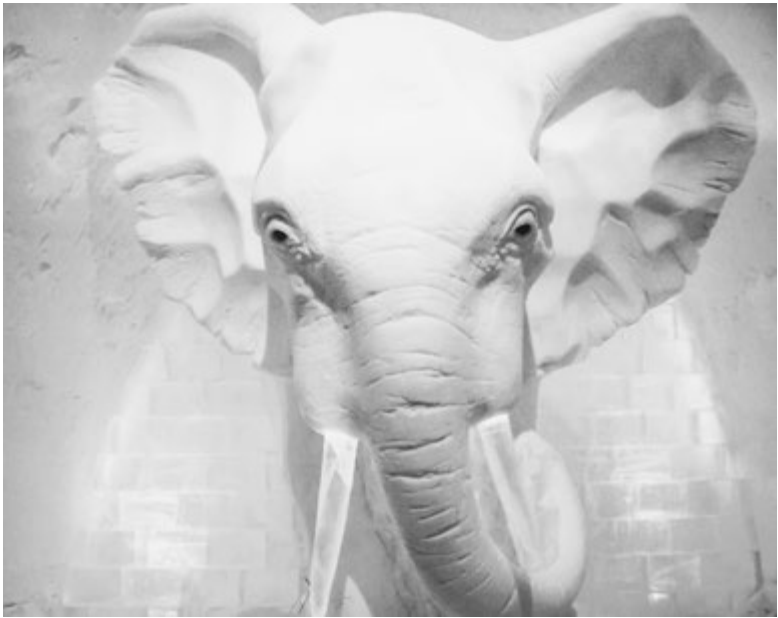
Скульптуры - украшение города

У природы нет ни хорошей, ни плохой погоды