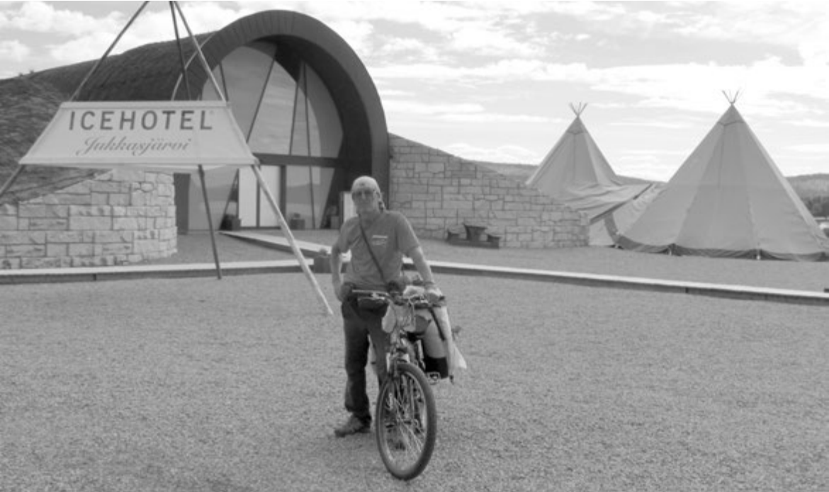
Ледяной отель встретил путешественника

Река Турне-Эльв, на берегу которой стояла расположенная в двадцати километрах от самого северного шведского города Кируна лапландская деревушка Юккасьярви, была идеальным местом, куда издавна на