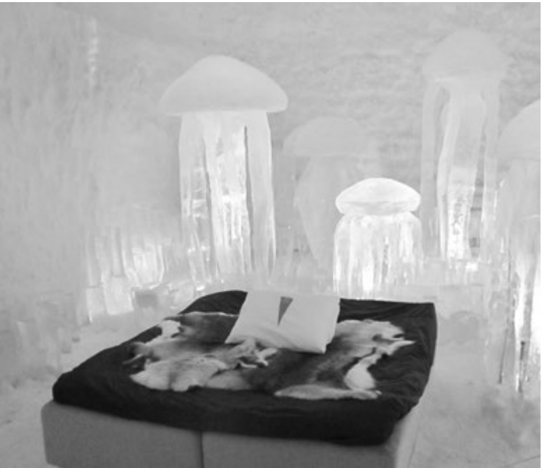
Лед - благодатный материал для создания сказки

Экзотический отдых в ледяной гостинице со всеми присущими ей отельными услугами - сезонное на-