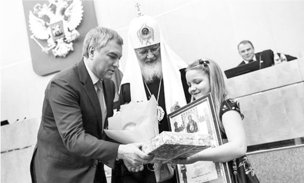
Награждение лауреатов Международного конкурса детского творчества «Красота Божьего мира»

«Каждый раз, когда я прогуливаюсь в окрестностях родного села Уркарах, да и бываю в других селах по долгу службы, с болью отмечаю экологическое неблагополучие территорий. На дорогах, ведущих в села, в оврагах вдоль речушек, да и в самих селах очень много отходов, мусора. Некоторые жители пытаются сжигать отходы, что очень вредно для атмосферы. Наблюдаю часто, как дети, да и взрослые бросают обертки, пакеты где угодно и никто не делает замечания. Как не вспомнить русскую поговорку о том, что чисто не там, где убирают, а там, где не сорят. Когда я работал директором средней школы, то всю территорию села мы разделили на три части, закрепив каждую за определенной школой (у нас их три). Школьники регулярно проводили субботники, старались облагородить свой участок. Наводили порядок, чистоту и еще получали уроки заботы о родных местах, навыки участия в общественной жизни. Почему бы не вспомнить сегодня этот опыт?»