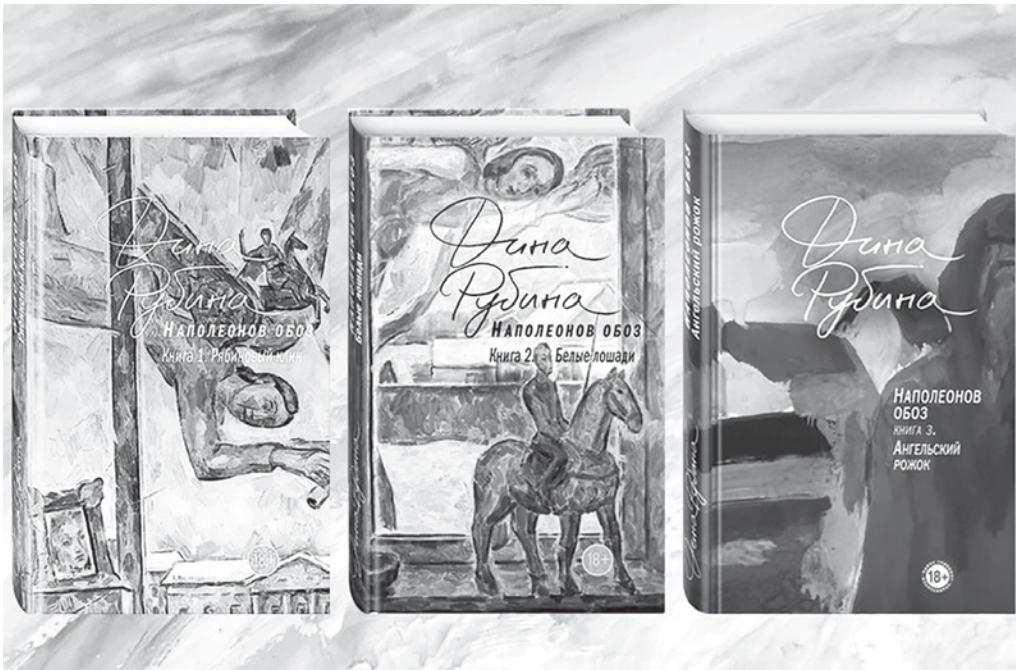
За второй и третьей частями романа Дины Рубиной выстраивалась очередь