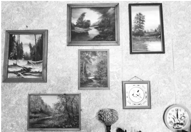
Пейзажи - любимая тема этого художника