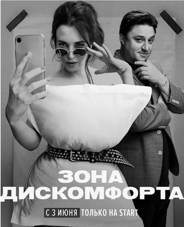
Смотреть сериал интересно вопреки характеру героини