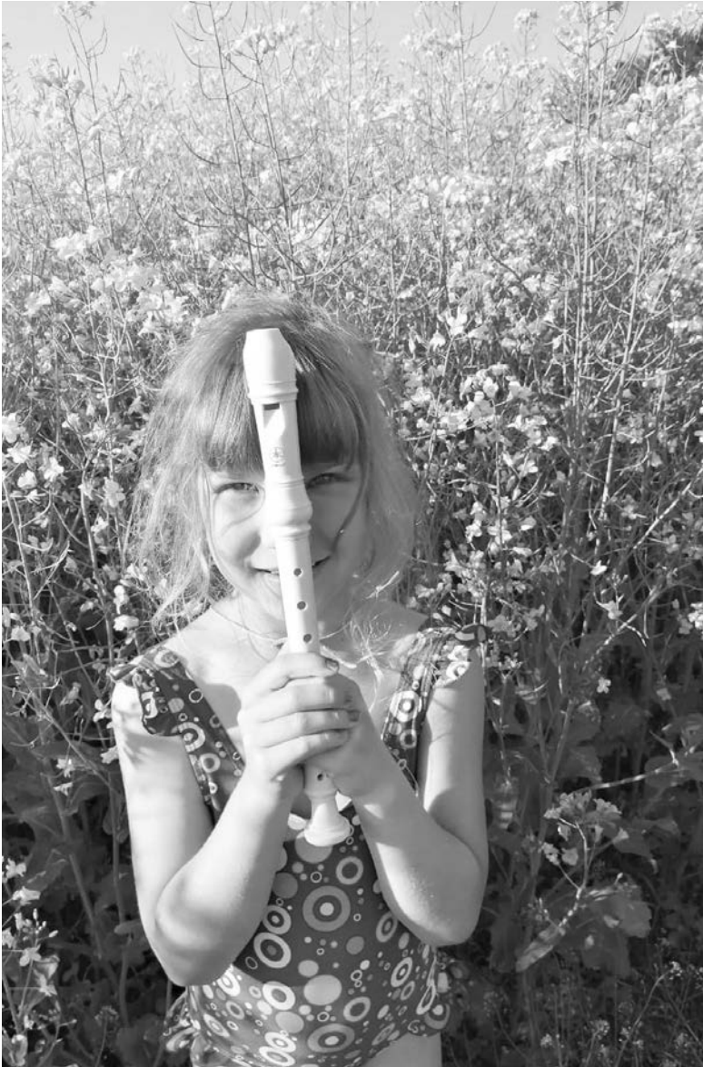
Если ребенок в городе, проблема организации его времени и пространства встает остро

- Выбор инструмента обусловлен его легкостью в прямом и переносном смысле слова. Блокфлейту легко взять на дачу, на ней легко добиться первых результатов даже в очень раннем возрасте. По причине даже того, что на этом инструменте достаточно просто извлечь нужный