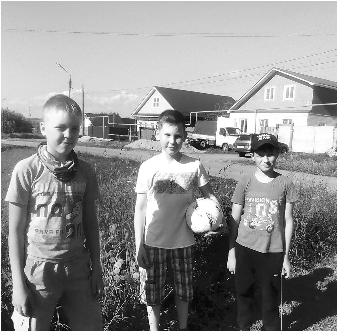
Благодаря дистанционным занятиям ребята правильно проведут лето

звук (в отличие от гитары, где важна сила пальцев, нужная сила обычно появляется годам к 9-10). Ребенку важно достичь результата - услышать музыку. И это его непременно вдохновит на дальнейшие занятия, на освоение других, более сложных инструментов. Поэтому для самого первого знакомства с инструментальным музицированием, для перехода от пения к исполнительству флейта самый подходящий инструмент. И формат занятий я выбрала тоже с учетом того, что не у всех летом есть хороший Интернет. За городом часто бывают перебои связи. Свои уроки я записываю на канале YouTube, они в свободном доступе, и каждый ребенок может их просматривать столько раз, сколько ему нужно, делать это можно в любое время, ставить на паузу, перематывать в нужное место, для освоения инструмента это важно, потому что двух занятий в неделю, конечно, недостаточно. Хорошо, если ребенок занимается ежедневно хотя бы по 15 минут, а еще лучше, если подходов к инструменту будет несколько в день.