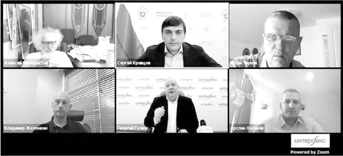
Трансляция встречи с министром, по словам организаторов, набрала рекордное количество просмотров