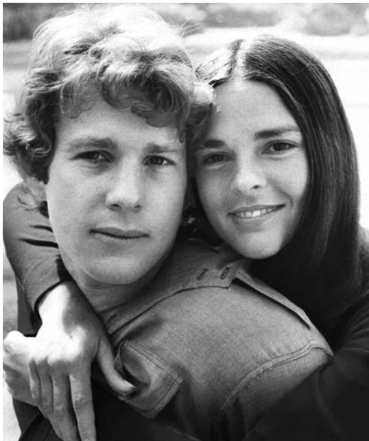
После фильма «История любви» ссоры и скандалы кажутся сущей мелочью

Оно пробуждает осознание неизбежности смерти и одновременно заставляет еще больше ценить жизнь. Узнав о неизлечимой болезни Дженни, Оливер не просто забывает о карьерных амбициях, заманчивых командировках и прибыльных делах, но стремится сделать каждый день своей возлюбленной самым ярким и прекрасным. Увы, любовь лишь краткий миг, подобный легкому дыханию из одноименного бунинского рассказа: «Это легкое дыхание снова рассеялось в мире, в этом облачном небе, в этом холодном весеннем ветре». Эпиграфом к фильму могут послужить слова Дженни, обращенные к Оливеру: «Любовь - это когда не нужно говорить «прости». Герой повторяет эту фразу и в финальном разговоре с отцом, который сожалеет, что не смог помочь. В каком-то смысле несчастье примиряет их. Происходит как в тургеневском стихотворении в прозе: «Да... Смерть нас примирила».