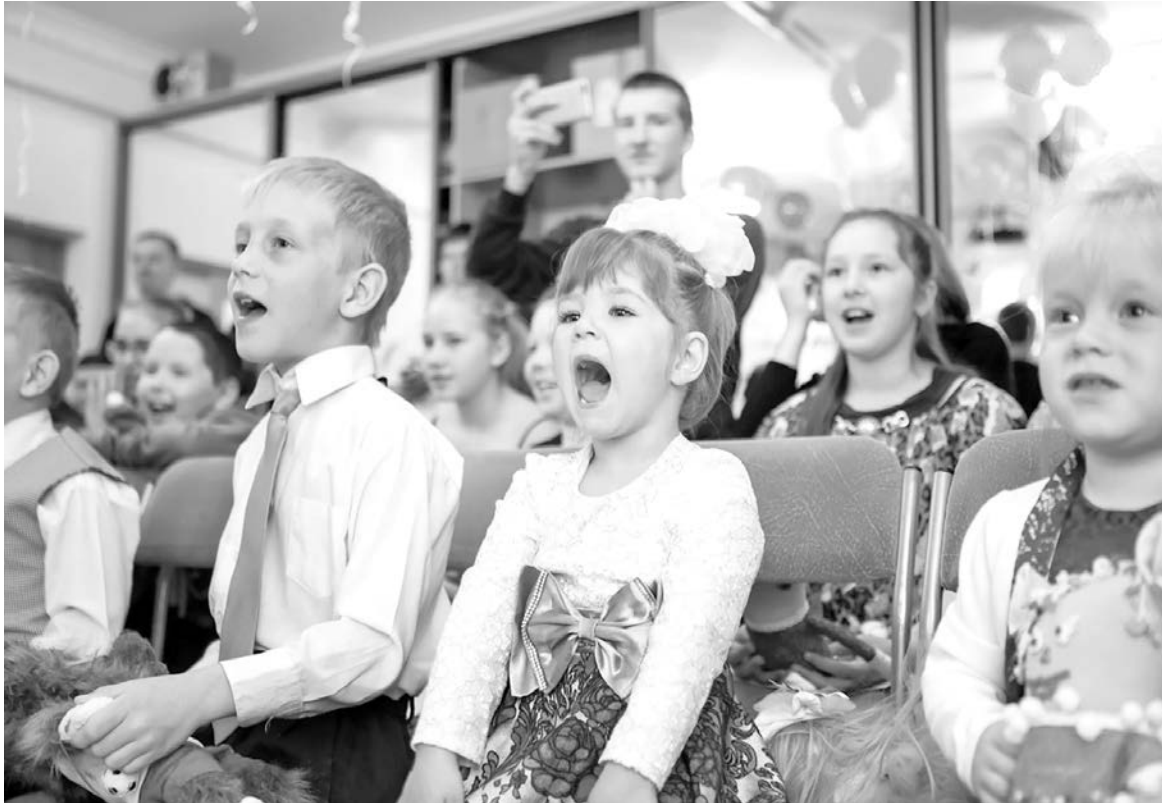
Это не зрители, а участники

Мир не без добрых людей. Есть у центра помощники, которые считают своим человеческим долгом по-