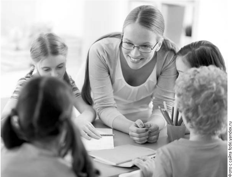
Главное - верить в потенциал молодых учителей

«Другими словами, основная задача нашей профессии - организовать учебно-воспитательный процесс так, чтобы наше сегодня было лучше, чем вчера», - сказал он в завершение нашей беседы.