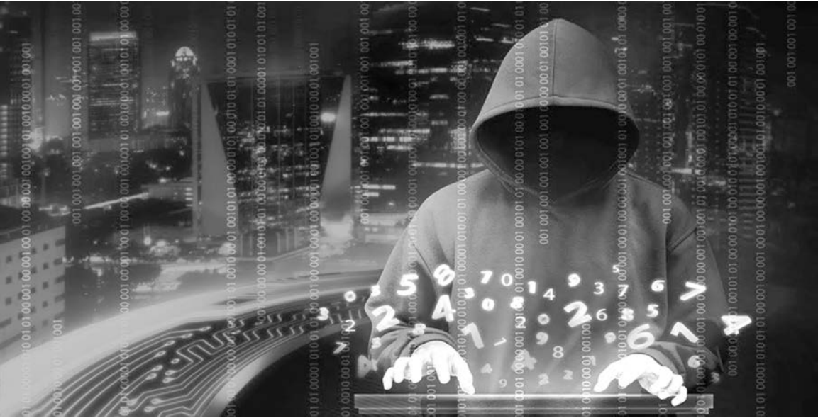
О русских хакерах на Западе не говорит разве что ленивый

Полагаю, это уже открытая информационная война. А на войне как на войне! Причитать и возражать тут