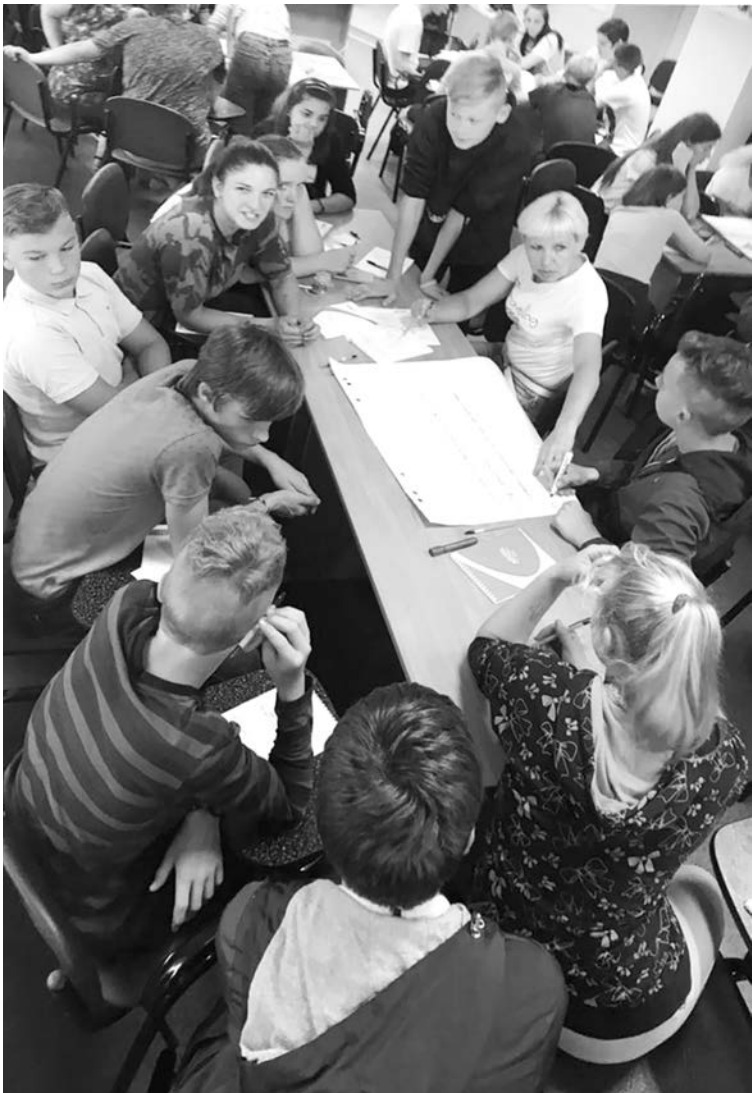
Мозговой штурм. Задачу решаем сообща

Есть еще одна программа в этом центре, которая популярна во всем поселке Каложица. Это школа приемных родителей. Сюда приходят за помощью и советом, в том числе родители собственных детей. Ну а будущие приемные отцы и матери получают в ней очень нужные им педагогические, психологические, медицинские, юридические, экономические и другие знания. «Без них мы были бы словно в лесу без компаса», - очень точно выразилась одна приемная мама.