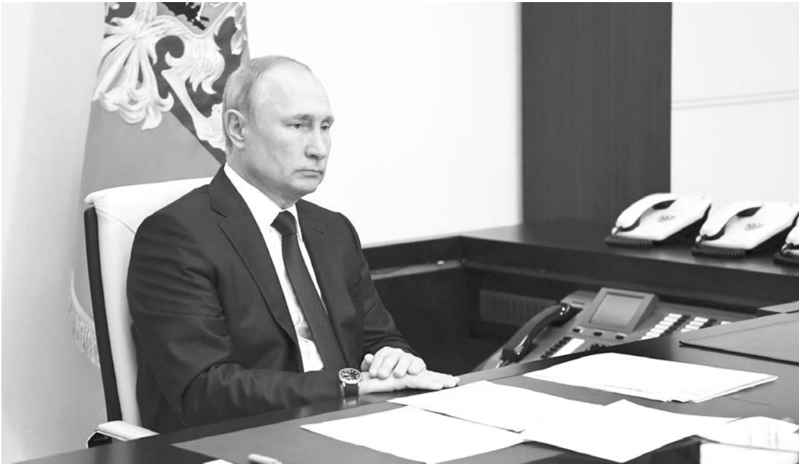
Владимир ПУТИН потребовал сохранить приоритетность обучения в стенах образовательных учреждений

Президент России утвердил перечень поручений по итогам совещания о ситуации в системе образования в условиях распространения новой коронавирусной инфекции. Минпросвещения России совместно с Рособрнадзором и органами исполнительной власти субъектов РФ поручено обеспечить в период подготовки и проведения ЕГЭ учебно-консультационное сопровождение выпускников 11-х классов, а также определить дополнительные сроки проведения единого госэкзамена в течение 2020-2021 учебного года. Кроме того, к 1 октября необходимо организовать проверку знаний школьников и их дополнительное обучение по неусвоенным темам. К 20 июня Минпросвещения России совместно с Роспотребнадзором и регионами должны определить сроки и условия приема детей в летние лагеря в 2020 году, обеспечив упрощенный режим оформления необходимых документов. Также президент поручил в период каникул увеличить количество дежурных групп в детских садах и обеспечить работу летних городских лагерей с дневным пребыванием на базе образовательных учреждений и других объектов социальной инфраструктуры с привлечением высокотехнологичных компаний.